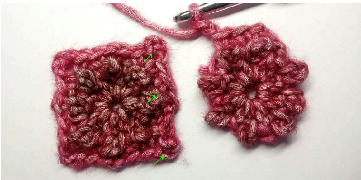
Vierkant A (links) Vierkant B (rechts)

Sluit al hakend de volgende 2 (3) vierkanten in de rij aan. Om dat te doen herhaal je rondes 1-2 voor elk volgende vierkant en ga op deze manier verder met ronde 3: L1 (telt niet als een st), (v, L1, v) in volgende 1L-ruimte, (v, L2) in volgende 1L-ruimte, v in hoek 3L-ruimte van vierkant A (houd de vierkanten met de verkeerde kanten op elkaar, steek de naald in van achter naar voren als je in vierkant A werkt), terug in vierkant B en haak v in dezelfde ruimte als de voorgaande v, v in volgende 1L-ruimte, v in de tegenoverliggende 1L-ruimte van vierkant A, terug naar vierkant B en haak v in dezelfde 1L-ruimte als de voorgaande v, v in volgende 1L-ruimte, v in de tegenoverliggende hoek 3L-ruimte van vierkant A, L2, terug naar vierkant B en haak v in dezelfde 1L-ruimte als de voorgaande v, *(v, L1, v) in volgende 1L-ruimte, (v, L3, v) in volgende 1L-ruimte* 2 keer, sluit met een hv in 1 e v. Knip het garen af en zet de losse uiteinden stevig vast.