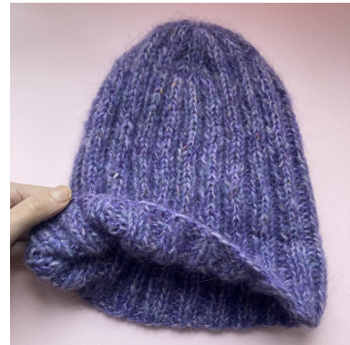
Detail: Rand omvouden