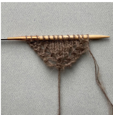
Het begin van de sjaal