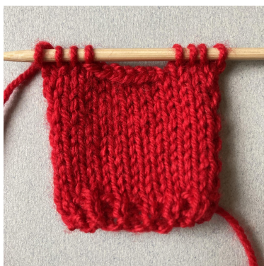
Voorpand, afkanten voor hals