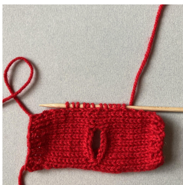
Opnemen van steken voor de mouw