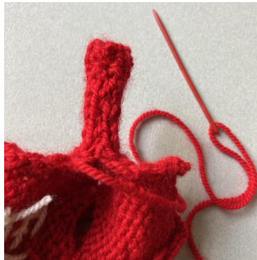
Zo is de mouw klaar