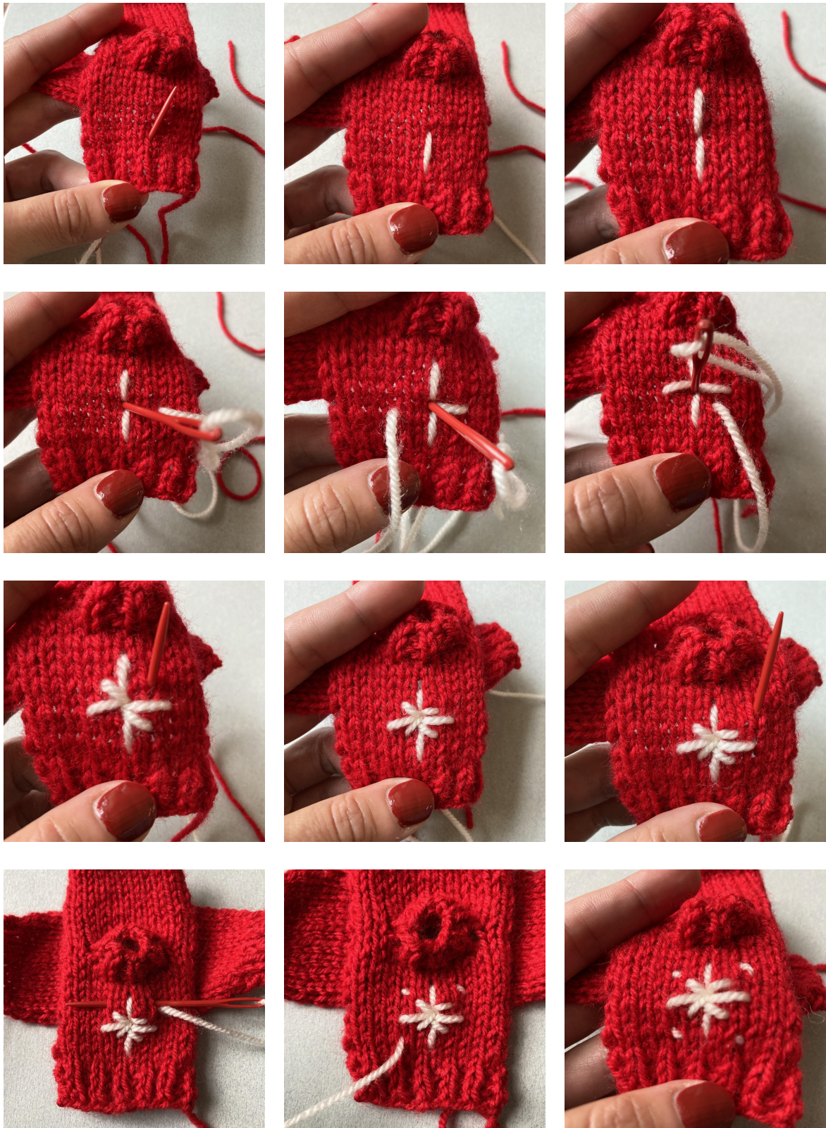
Foto overzicht voor het opmazen van een sneeuwvlok