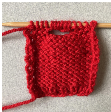
Opzetten voor hals, achterpand