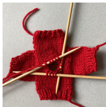
Opnemen van steken voor de hals