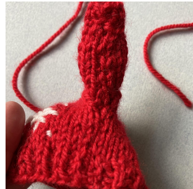
Zo is de zijnaad klaar