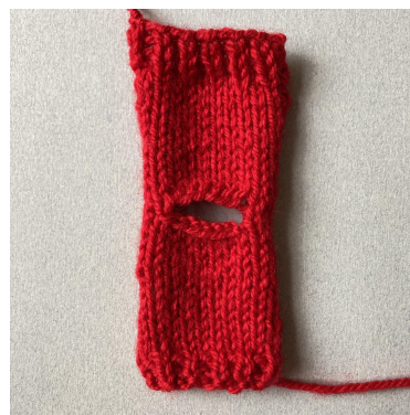
Voor- en achterpand als deze klaar zijn