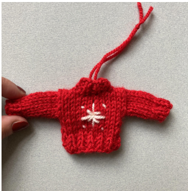
Zo ziet de trui eruit als hij klaar is