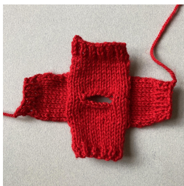
Mouwen zijn klaar