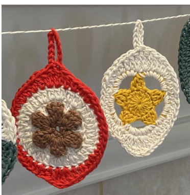
De popcorn en de ster

Toer 4: 3 kst, 2 stk, [2 dubb.stk], [2 dubb.stk, 3 stk, [2 hstk], hstk, 6 v, 3 hst, [2 hstk], 3 stk, [2 dubb.stk], [dubb.stk, kst10, hv in de dubb.st, dubb.stk], 3 stk, [2 hstk], 3 hstk, 6 v, hstk, [2 hstk], hv op de kst 3 en hecht af (48 st + kst10-lr).