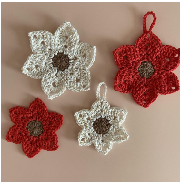
De kleine en grote kerstster

Toer 3: 1 kst (telt als eerste v), stk]. In de kst3-lr [2 stk, kst 15, v in de eerste kst van kst 15, 2 stk], stk, v. {v, stk, in de kst3-lr [2 stk, kst 3, v in eerste kst van de kst 3, 2 stk], stk, v}. Herhaal 4 keer { }. Haak hv op de eerste kst en hecht af. (48 st + 6 kst-lr).