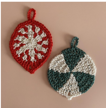
Het snoepje en de groene krul

Toer 4: [2 kst (telt als het eerste hstk), hstk]. 2 stk [dubb.stk, 3 kst in het eerste hstk, dubb.stk]. 2 stk, [2 hstk], 2 hstk, {[2 v], 2 v}, herhaal 3 keer { }. [v, kst 10, haak hv op de v, v], 2 v, herhaal 3 keer { }. [2 v], 2 hstk. Haak hv op de 2 kst en hecht de draad af (48 st en 2 kst-lr).