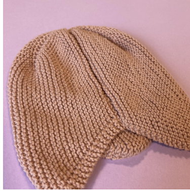
Samen naaien de opzetkant samen met de afkantrand