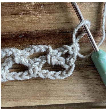
Foto laat eind van toer 2 zien. Het werk is al gekeerd.

Toer 2: L-6. In de 1e L-boog: 1 V. *(5 L, 1 V in volgende L-boog). Herhaal vanaf *( ) de gehele naald. 2 L, 1 Stk in de 5e L van de 9L-boog eronder. KEER. (21 bogen)