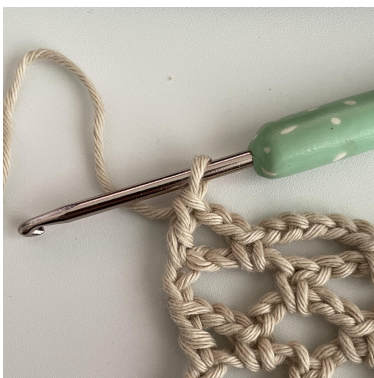
Foto laat eind toer 4 zien.

Toer 4: L-6. in de eerste L-boog: 1 V. *(L-5, 1 V in volgende L-boog). Herhaal vanaf *( ) de gehele toer. 1 L, 1 Stk in de 2e L van de 6L-boog eronder. KEER. (21 bogen)