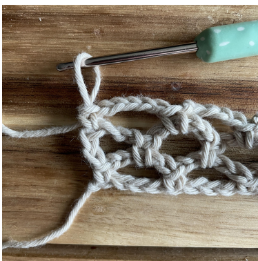
Foto laat eind toer 3 zien.

Toer 4: L-6. in de eerste L-boog: 1 V. *(L-5, 1 V in volgende L-boog). Herhaal vanaf *( ) de gehele toer. 1 L, 1 Stk in de 2e L van de 6L-boog eronder. KEER. (21 bogen)