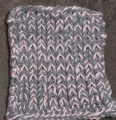
Cosy: Grey SBF: Light Pink