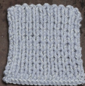
Cosy: Sky blue SBF: Light Grey