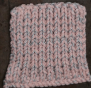
Cosy: Pastel Rose SBF: Light Grey