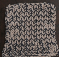
Cosy: Pastel Brown SBF: Dark Grey