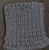
Cosy: Grey SBF: Grey