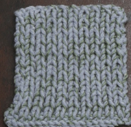
Cosy: Sky Blue SBF: Soft Green