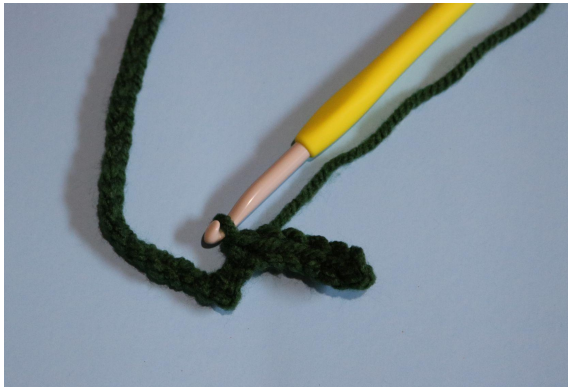
3. beginnend vanaf de tweede l vanaf de naald 6 hv