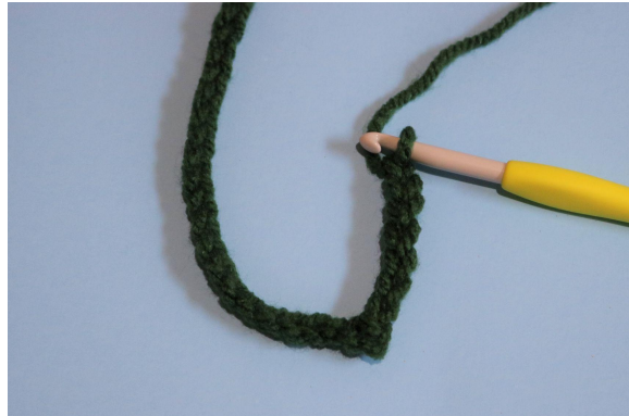
2. In de tweede l vanaf de naald, hv en 7 l