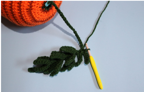
5. herhaal stap 8 18 keer (19 bladeren in totaal) en hv in de resterende 20 l