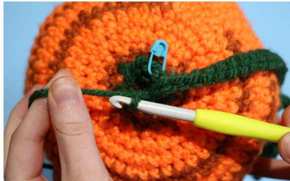
6. Hv in de voorste lus van de volgende steek, (begin dan met blad B)