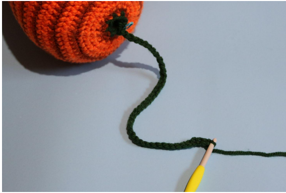
1. Blad A.) 1 v in de voorste lus, 40 l