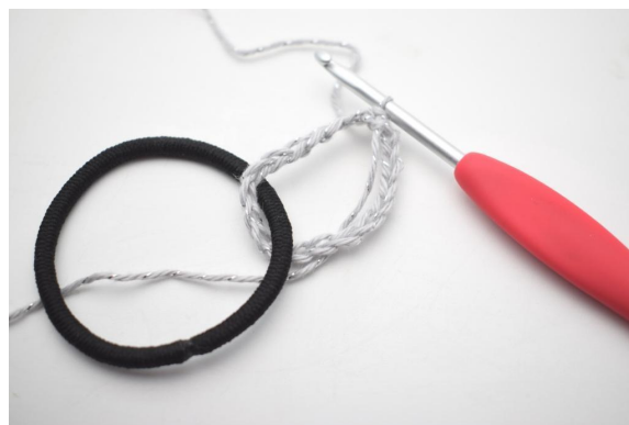
2. Sluit tot een ring om het haarelastiek met 1 Hv.