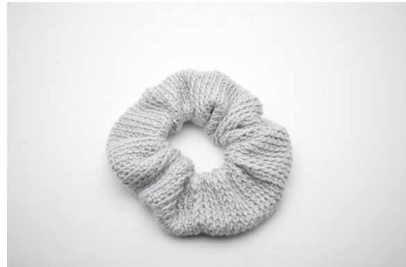
16. Knip het garen af en hecht af.