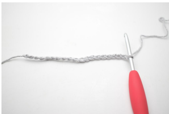
1. Haak 20 L.