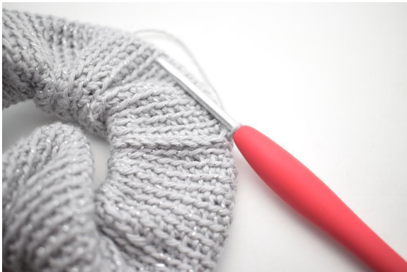
15. Ga helemaal rond op deze manier.