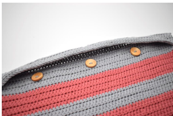
7. Naai de 3 knopen vast zodat ze in de knoopsgaten passen.