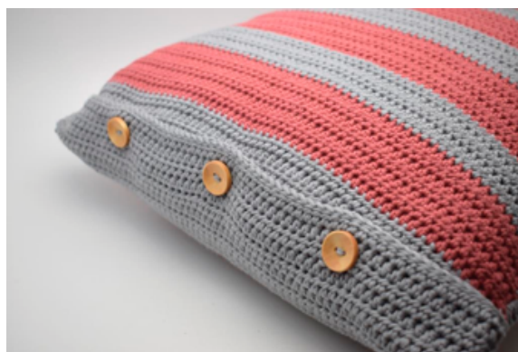
8. Zodanig. Stop het binnenkussen in de hoes.