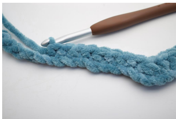
6. Haak 1 V in de volgende 8 L.