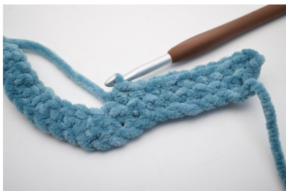
18. "Haak 1 V in de volgende 8 steken.