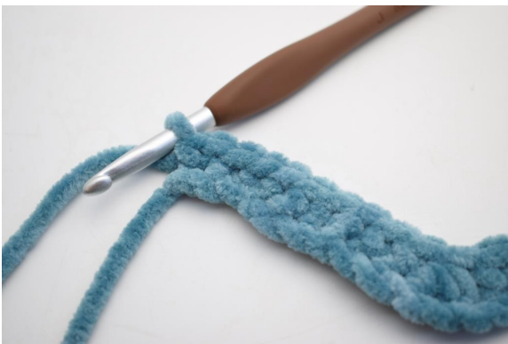
15. Haak 2 V in de laatste L.