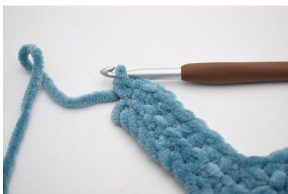
26. Haak 2 V in de laatste steek.