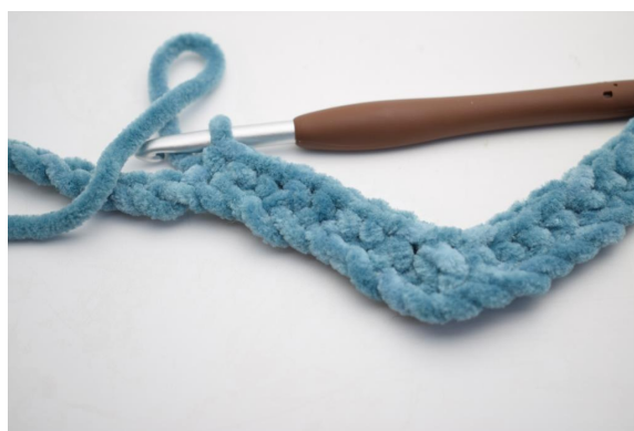
10. Haak 1 V in de volgende 8 L.