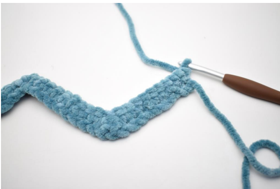
16. Keer met 1 L.