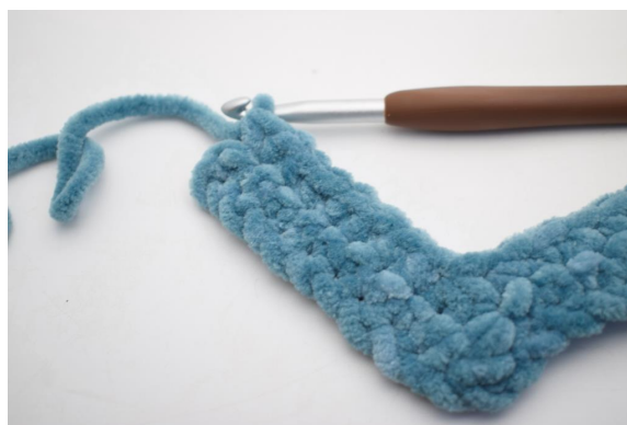
25. Haak 1 V in de volgende 8 steken.