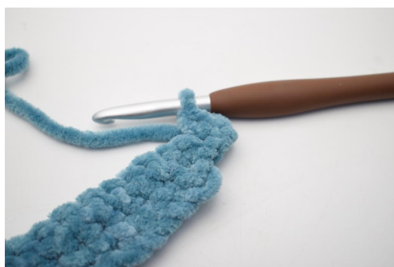
28. Haak 2 V in de eerste steek.