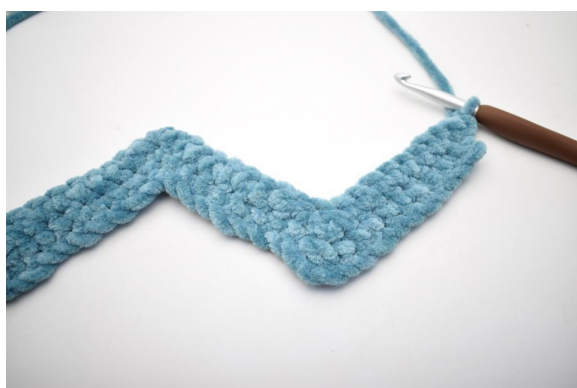
27. Deze wordt gehaakt als toer 2. Keer met 1 L.