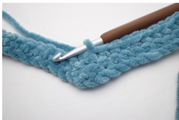
19. Haak 3 V samen.