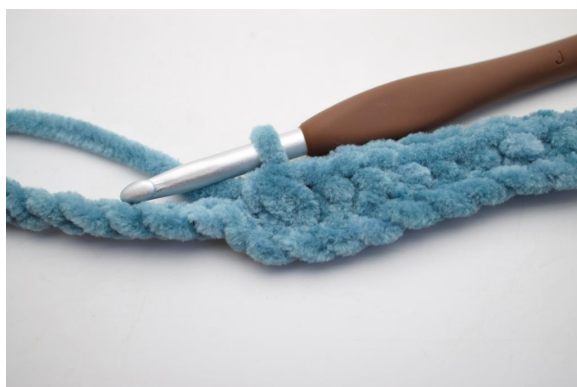
5. Haak 3 V samen.