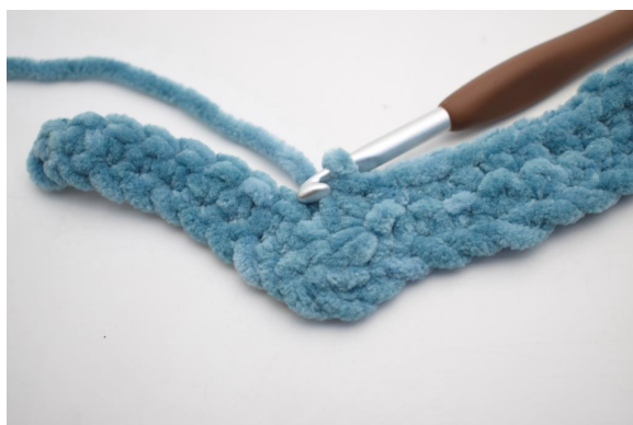
24. Haak 3 V samen.