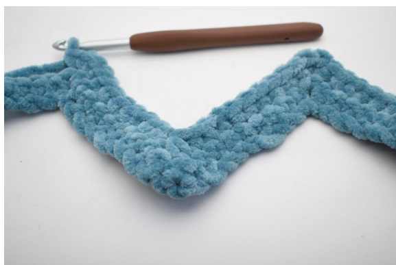
22. "Haak 1 V in de volgende 8 steken, h aak 3 V samen. Haak 1 V in de volgende 8 steken, 3 V in de volgende steek".