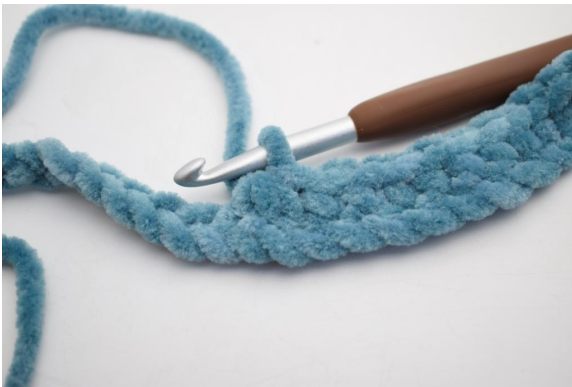
13. Haak 3 V samen.