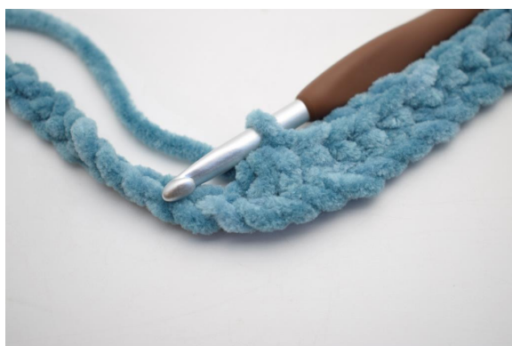
9. Haak 3 V samen.