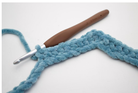
12. Haak 1 V in de volgende 8 L.