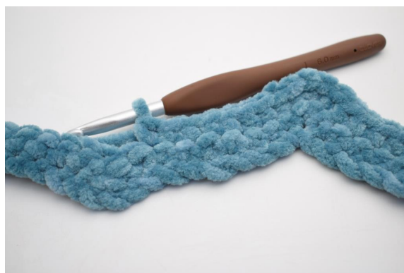
23. Haak 1 V in de volgende 8 steken.