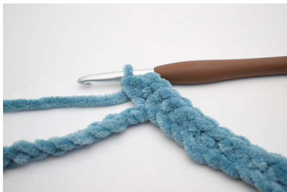
7. Haak 3 V in de volgende L”.