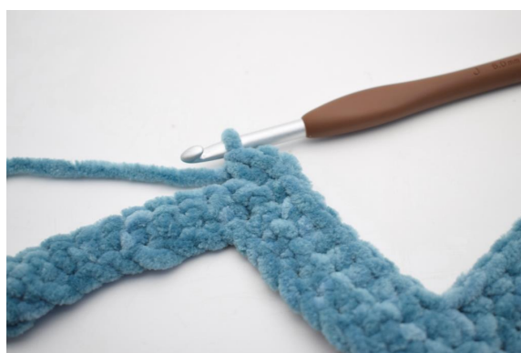
21. Haak 3 V in de volgende steek".