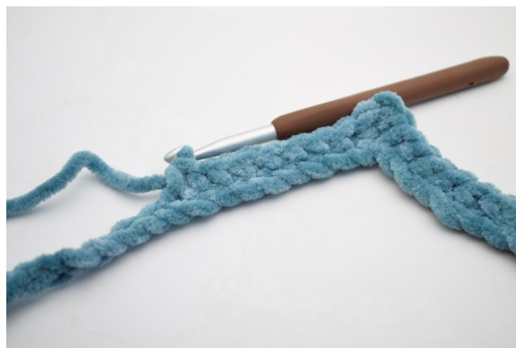
8. “Haak 1 V in de volgende 8 L.