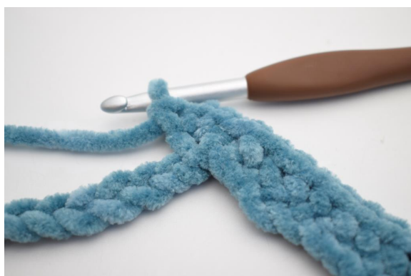
11. Haak 3 V in de volgende L”.