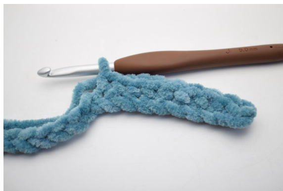
4. "Haak 1 V in de volgende 8 L.