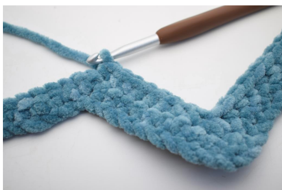
20. Haak 1 V in de volgende 8 steken.