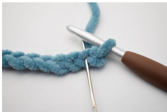
2. Haak 2 V in de 2e L vanaf de haaknaald.