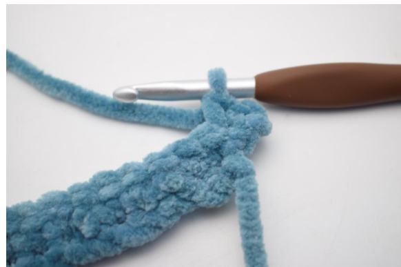
17. Haak 2 V in de eerste steek.