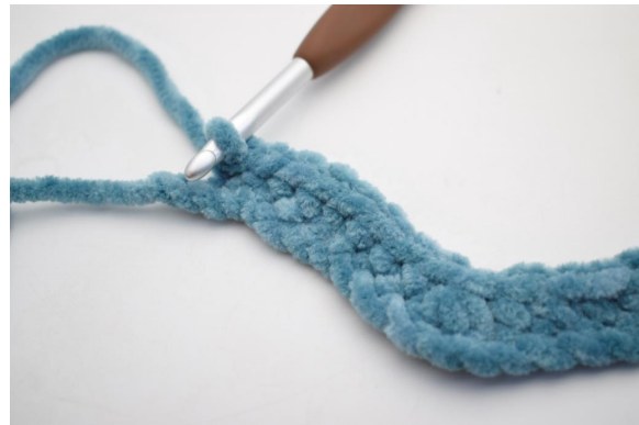
14. Haak 1 V in de volgende 8 L.