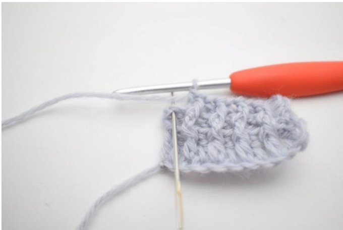
9. Haak 1 Stk in de laatste steek.