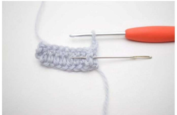
2. Haak 1 RstkV om de eerste steek. De naald markeert om welk stokje van de vorige toer je moet haken.