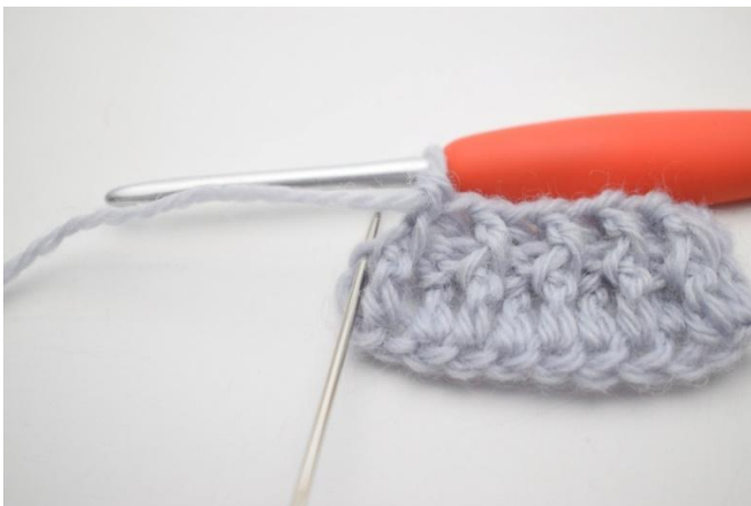
9. Haak 1 Stk in de laatste steek.