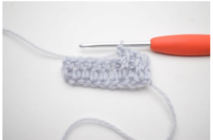
6. "Haak 1 RstkV om de volgende steek, haak 1 RstkA om de daarop volgende steek".