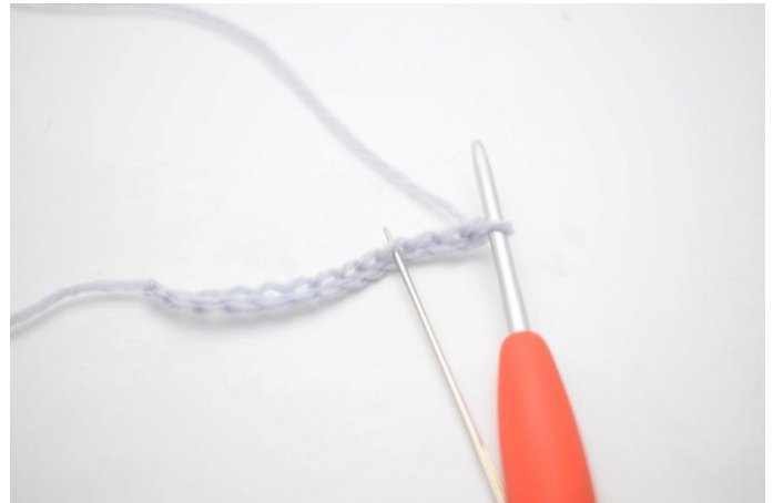
2. Haak 1 Stk in de 4e L vanaf de haaknaald.