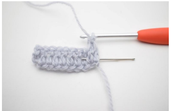
4. Haak 1 RstkA om de volgende steek. De naald wijst waar je moet haken.