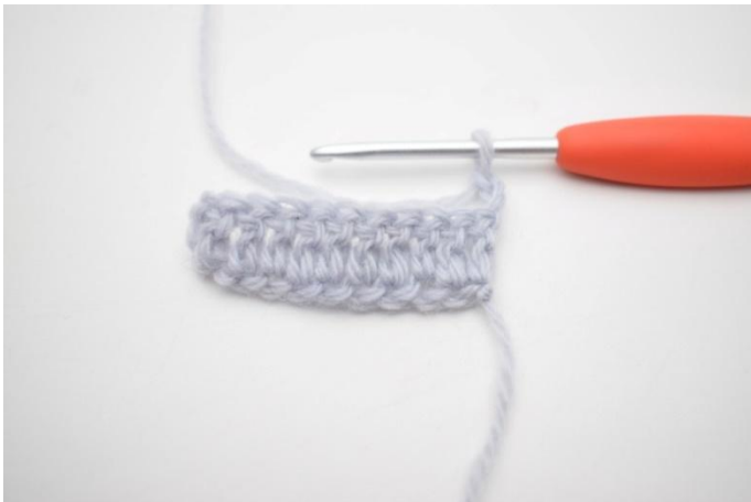
1. Keer met 3 L.