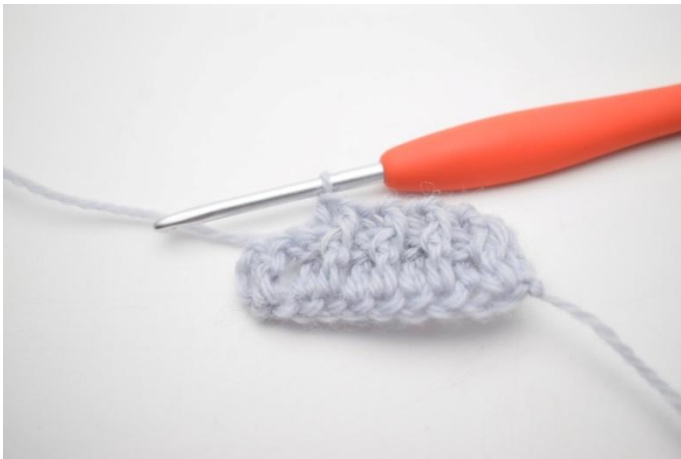
7. Herhaal "tot" tot er nog 2 steken zijn.