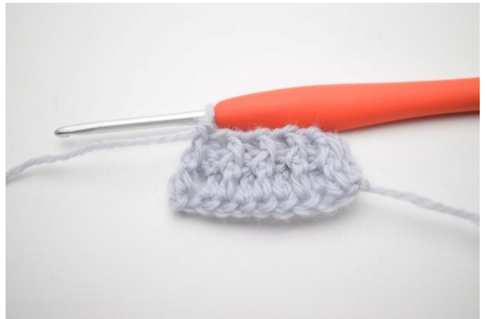
8. Haak 1 RstkV om de volgende steek.