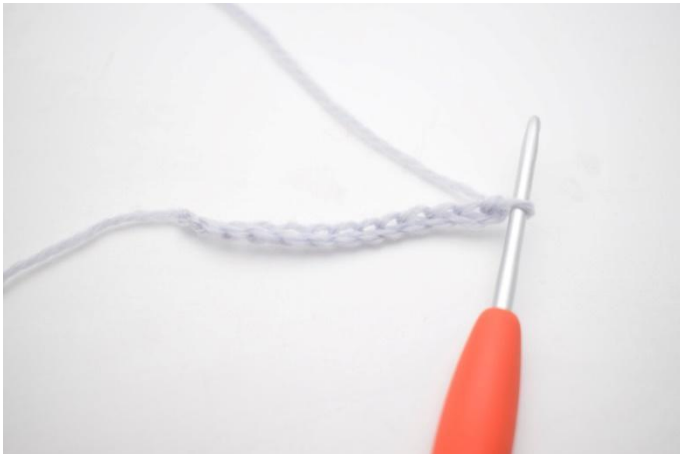
1. Haak 25 L.