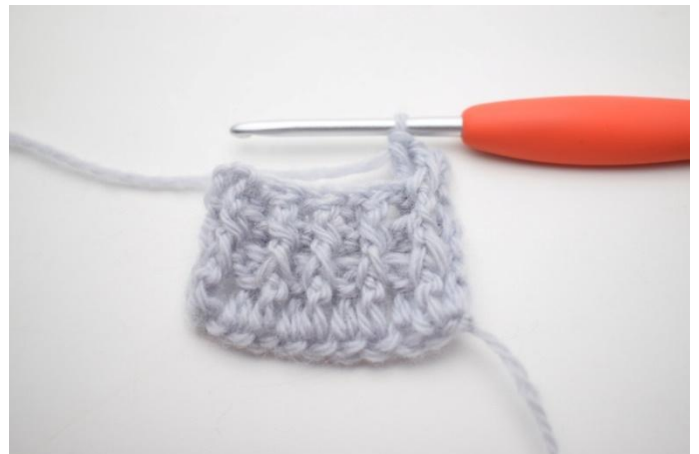
2. "Haak 1 RstkV om de volgende steek, haak 1 RstkA om de daarop volgende steek.