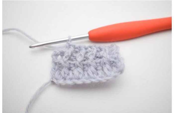
8. Haak 1 RstkA om de volgende steek.