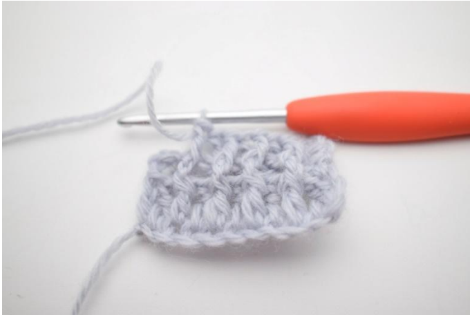
7. Herhaal "tot" tot er nog 2 steken zijn.