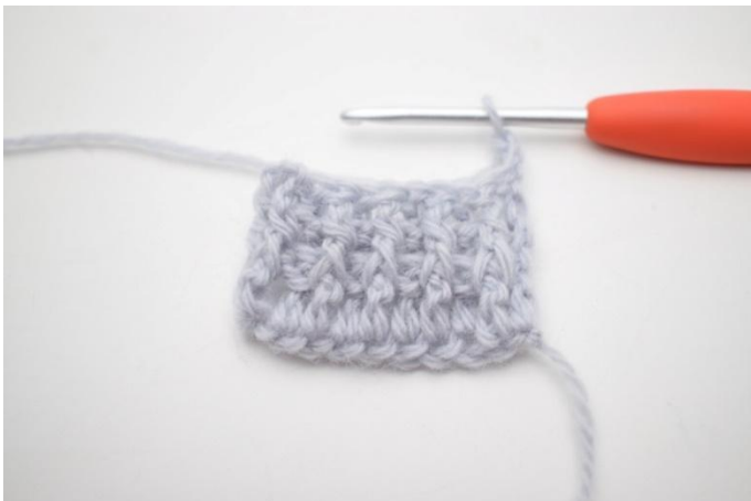
1. Deze toer haak je als toer 2. Keer met 3 L.