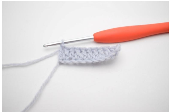
4. Haak 1 Stk in elke steek. (23)