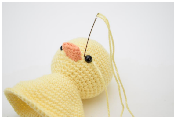
2. Steek de naald naar beneden aan de andere kant.