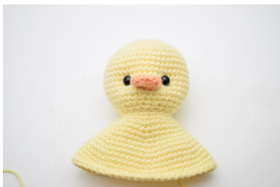
5. Trek licht aan zodat de ogen iets dieper komen. Hecht af.