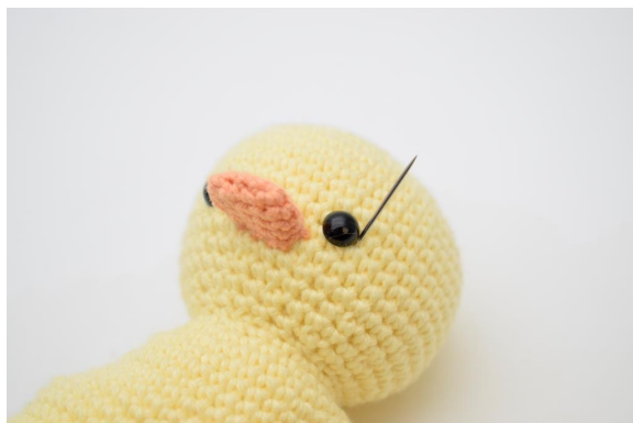
1. Steek het garen omhoog aan een kant van het oog.