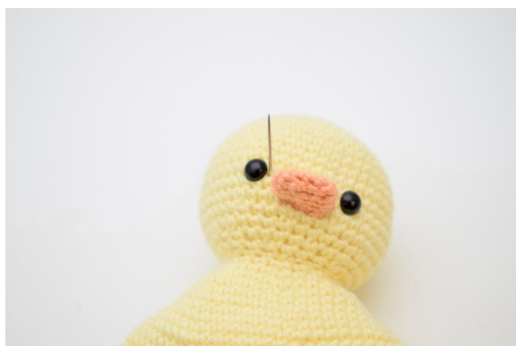
3. Steek de naald weer omhoog bij het andere oog.