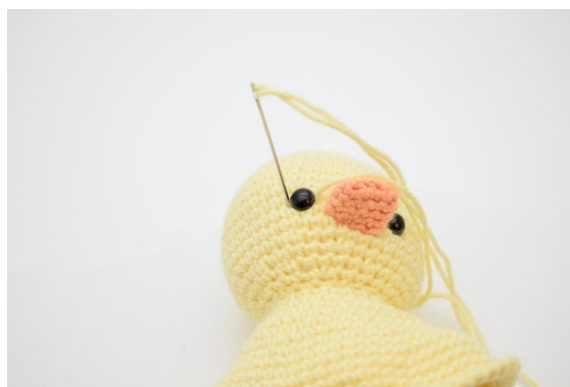
4. Steek naar beneden aan de andere kant van dit oog