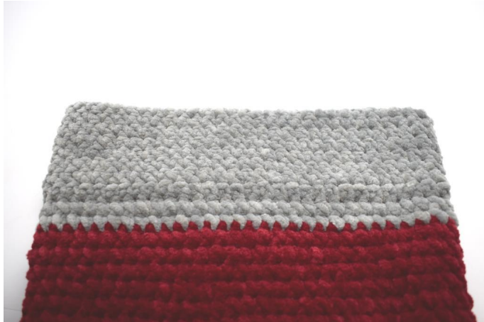
De rand is nu klaar.