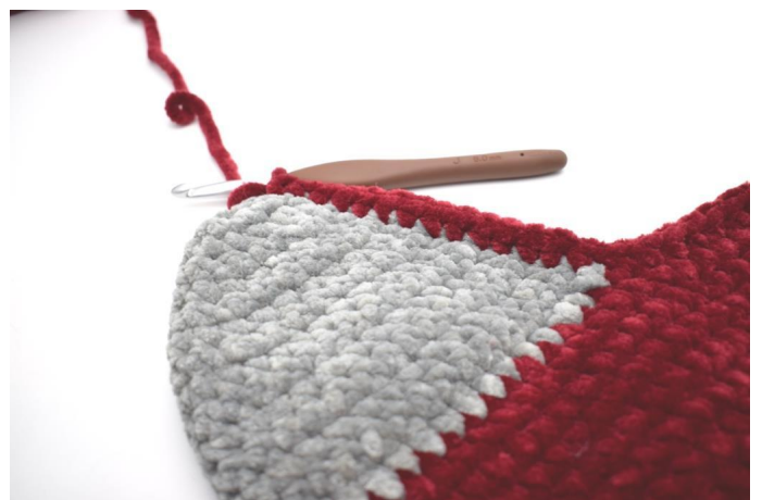
Haak nu 14 v langs de ene kant van de hiel