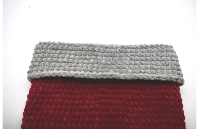
Vouw de rand over de sok.