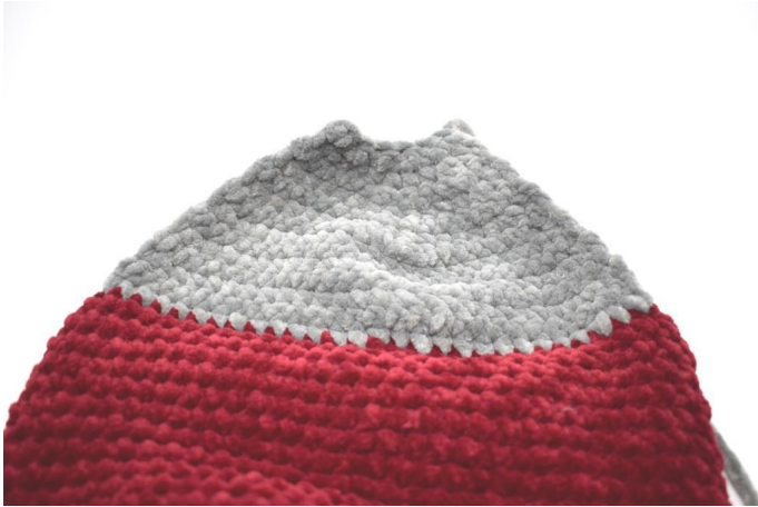
Zo ziet de hiel er nu uit.