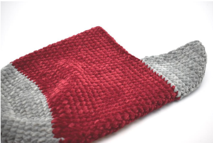
Draai de sok zo.