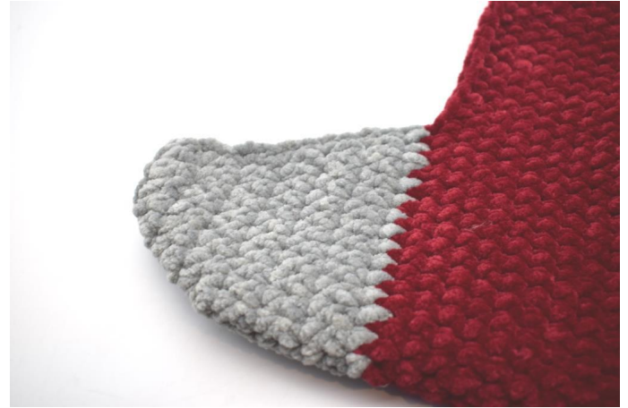
Naai de eindjes vast aan de verkeerde kant van het werk. Je hiel is nu klaar.