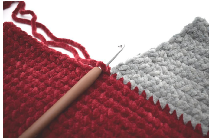
Bevestig het rode garen.