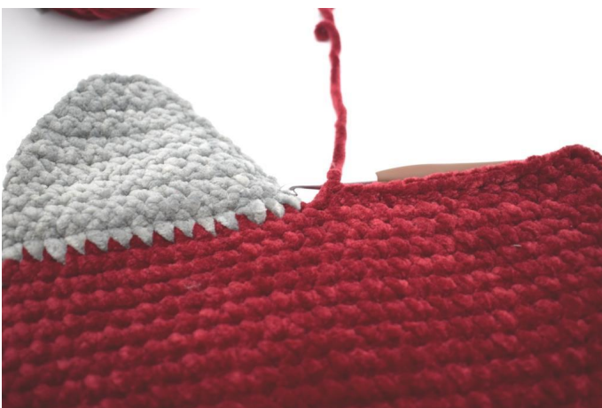
Haak 1 v in 32 s, totdat je bij de hiel belandt.