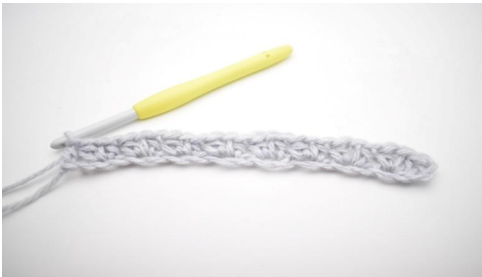
11. Dit is de eerste toer.