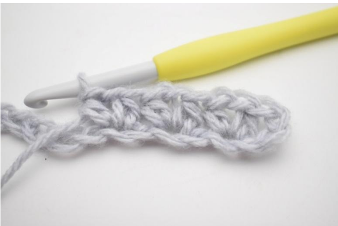
7. Haak 1 Hstk, 1 L en 1 Hstk in volgende L.