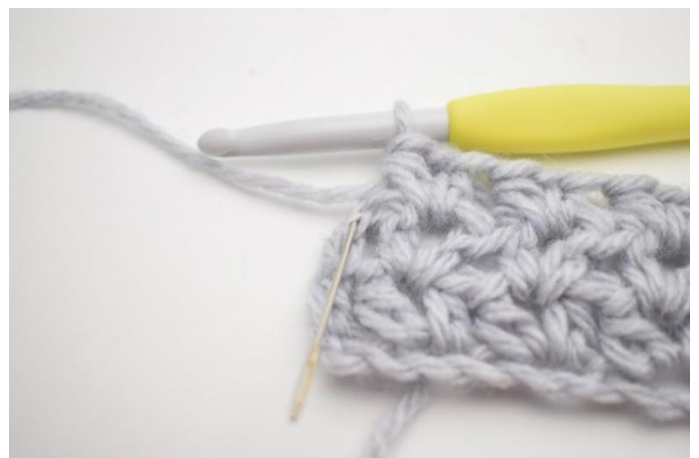
4. Haak 1 hstk in de laatste steek.