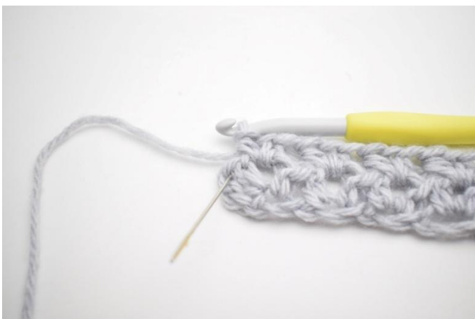
7. Haak 1 Hstk in de laatste steek.