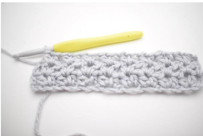
3. Herhaal "tot" de gehele toer.