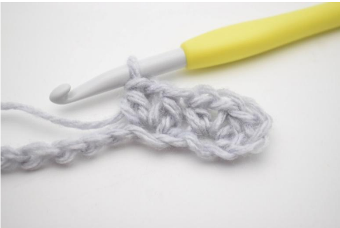
5. Haak 1 Hstk, 1 L en 1 Hstk in volgende L.