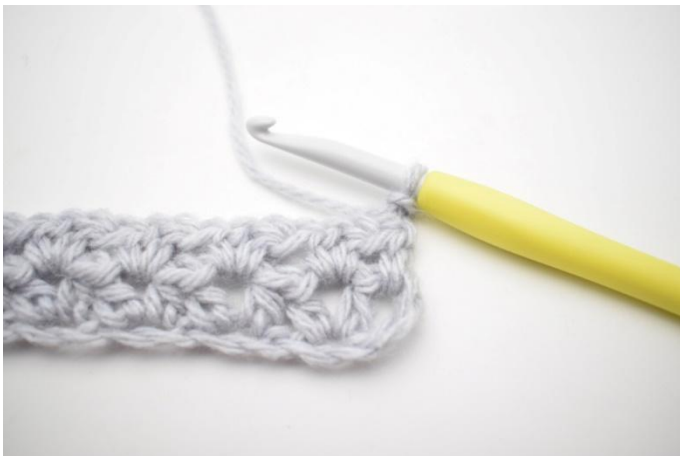
1. Toer 3 wordt gehaakt als toer 2. Keer het werk met 2 L.