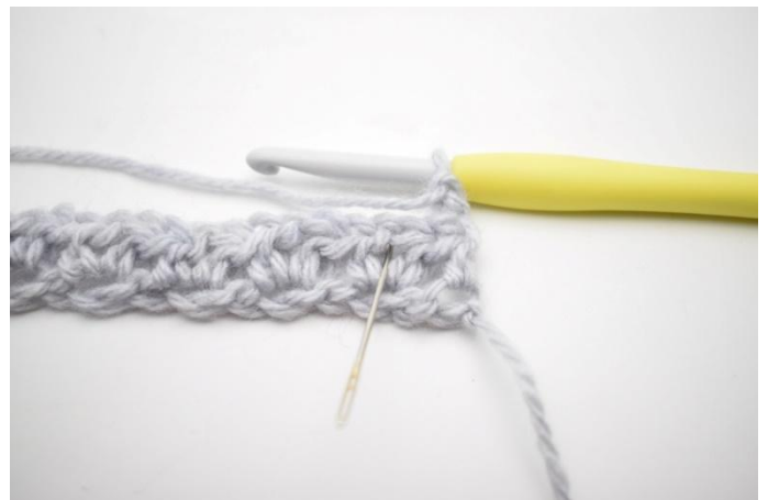
2. "Haak 1 Hstk, 1 L en 1 Hstk in de lossenruimte van de vorige toer". De naald markeert de lossenruimte.