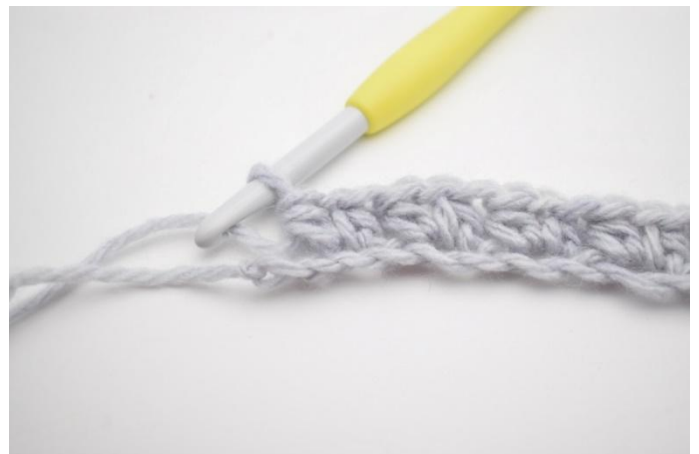
8. "Sla 1 L over. Haak 1 Hstk, 1 L en 1 Hstk in volgende L". Herhaal "tot" de gehele toer tot er nog 2 L over zijn.