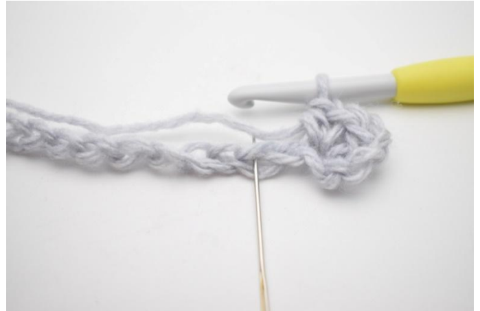
4. Sla 1 L over.