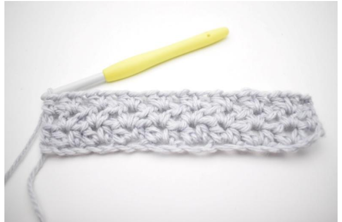
6. Dit was toer 3.