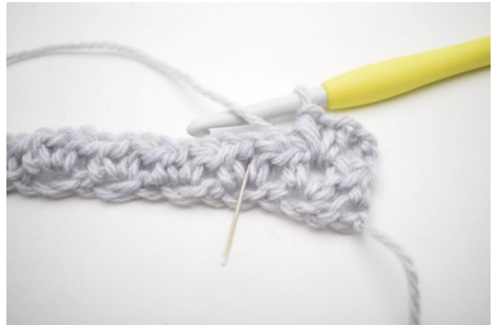
4. "Haak 1 Hstk, 1 L en 1 Hstk in de volgende lossenruimte."