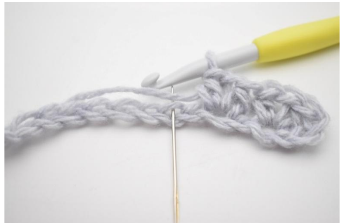
6. Sla 1 L over.