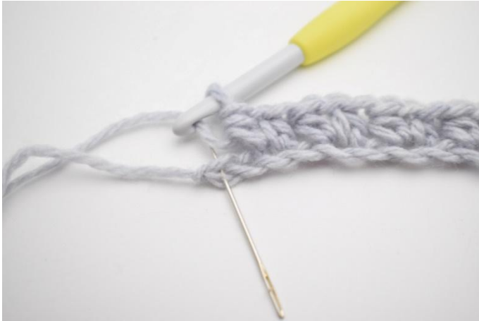
9. Sla 1 L over en haak 1 Hstk in de laatste steek.