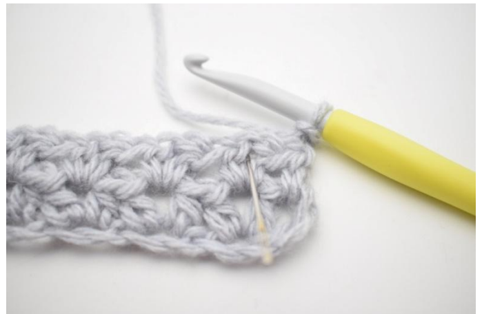
2. "Haak 1 Hstk, 1 L en 1 Hstk in de eerste lossenruimte van de vorige toer". De naald markeert waar je moet haken.