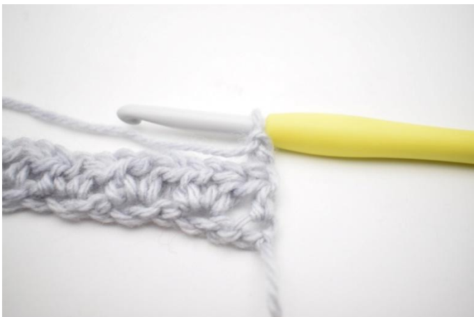
1. Keer met 2 L.