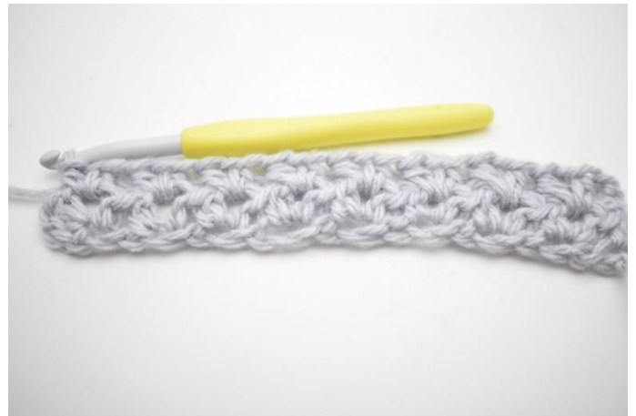
6. Herhaal "tot" de gehele toer.