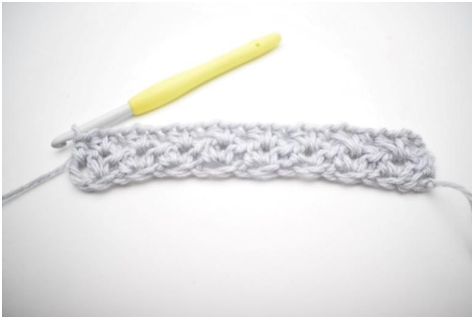
9. Dit was toer 2.