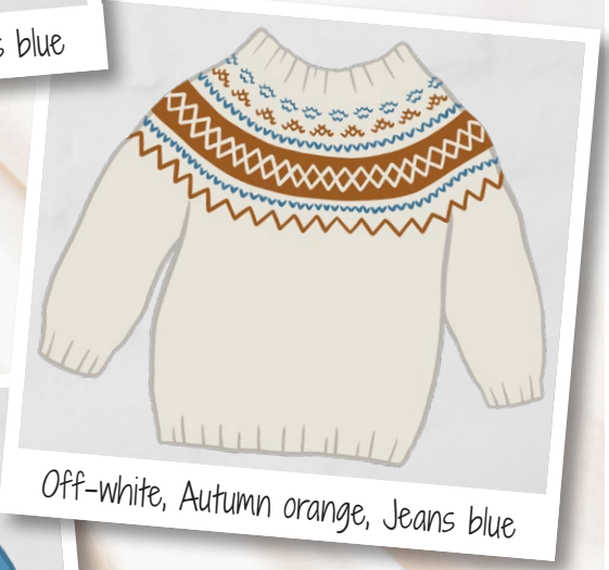
Off-white, Autumn orange, Jeans blue

Tip Het patroon kan ook in 3 kleuren gebreid worden.