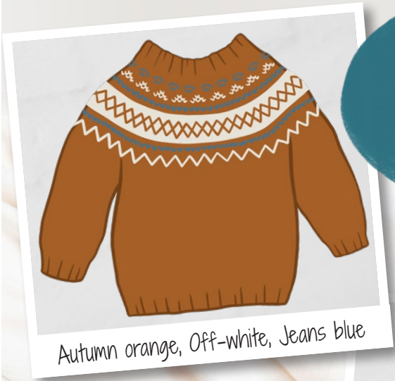
Autumn orange, Off-white, Jeans blue

Tip Het patroon kan ook in 3 kleuren gebreid worden.