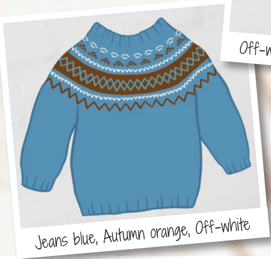
Jeans blue, Autumn orange, Off-white