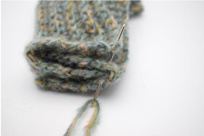
7. Naai door alle 4 lagen de uiteinden samen.