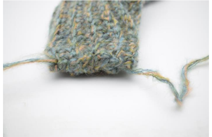
8. Zodanig. Knip het garen af en hecht af.