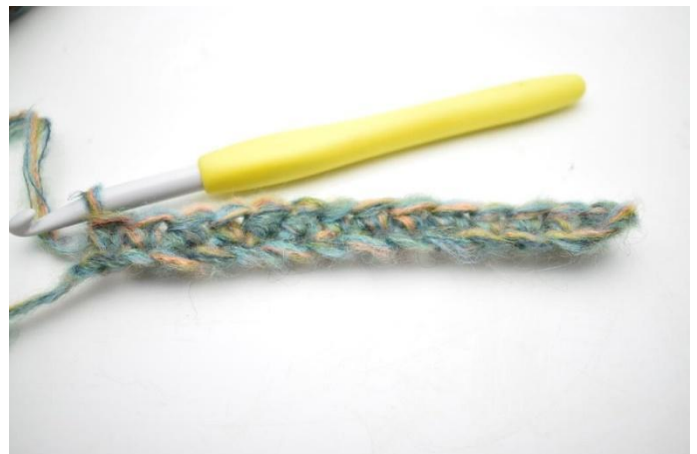
4. Haak V de gehele toer. = 49(52)55 steken.