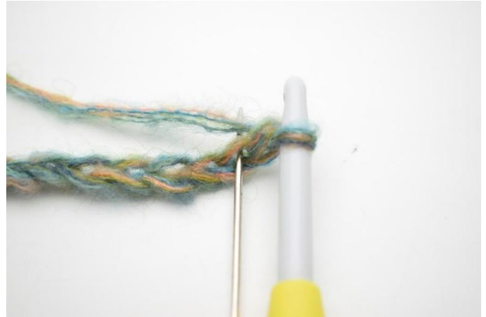
2. Haak 1 V in de 2e L vanaf de haaknaald.