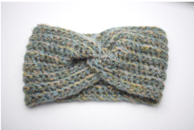
9. Keer het werk nu om zodat de naad aan de binnenkant zit. Er is nu een mooie "knoop" ontstaan en de hoofdband is rond 😊