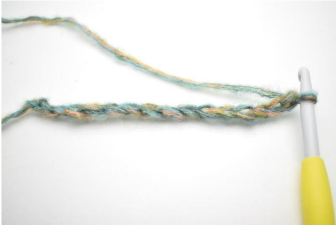
1. Haak 50(53)56 L.