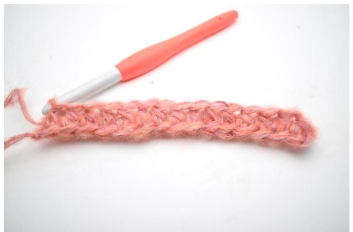
4. Haak Hstk de gehele toer. (180)