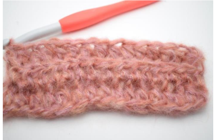
4. Haak Hstk in Al de gehele toer. (180)