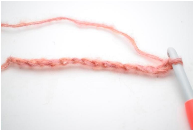
1. Haak 180 L.