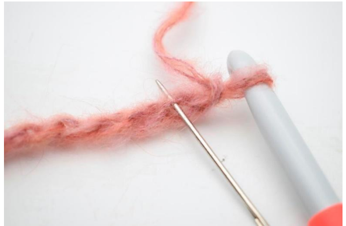
2. Draai de lossenketting zodat je de 'liggende' lusjes ziet. Haak 1 Hstk in de 2e L vanaf de haaknaald.