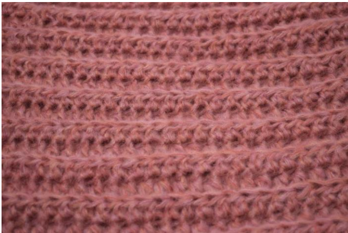
5. Herhaal toer 2 tot in totaal 19 toeren. Knip het garen af en hecht af