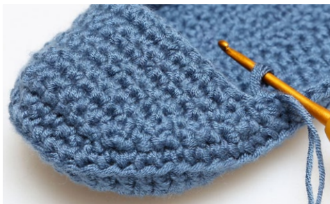
Start hier in de tiende rij van het Bovenstuk.