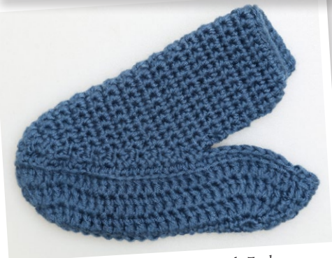
Het voltooide Bovenstuk op de Zool.