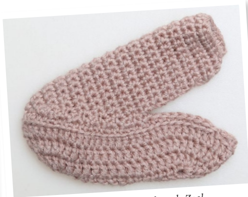
Het voltooide Bovenstuk op de Zool.