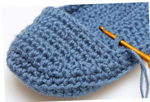
Start hier in de tiende rij van het Bovenstuk.