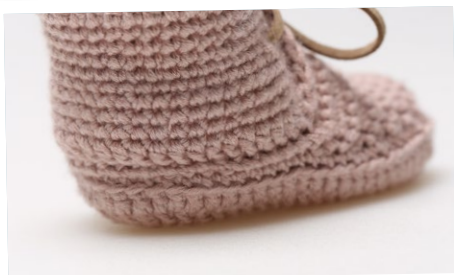
Hielkap vastgezet op de Zool.