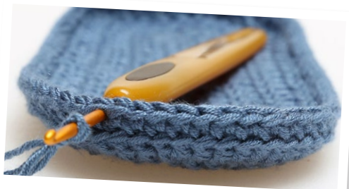
Start hier met het Bovenstuk.