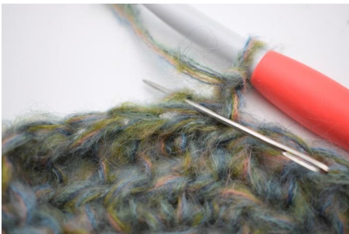
9. Haak 1 Hstk in Al in eerste steek.