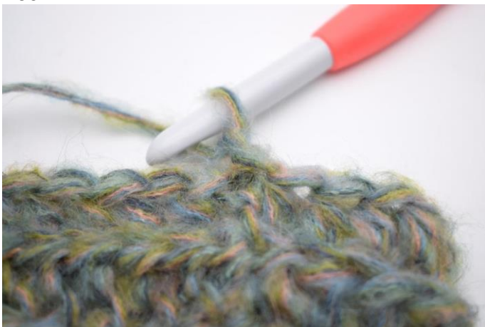
12. Deze toer wordt gehakt als toer 3. Haak 1 L.