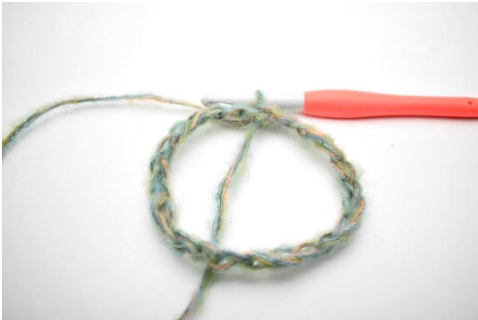
1. Haak 58 L. Sluit tot een ring met 1 Hv.