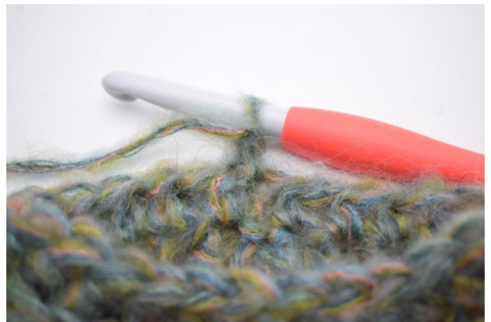
13. Keer het werk.