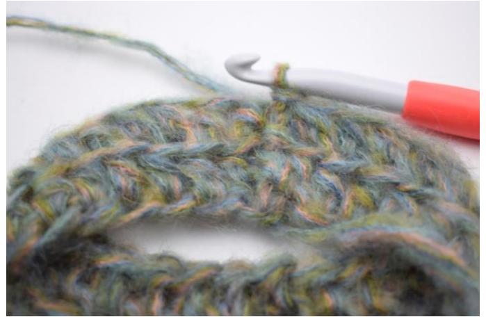
6. Haak Hstk in Al de gehele toer. Sluit met 1 Hv in eerste Hstk. (58)