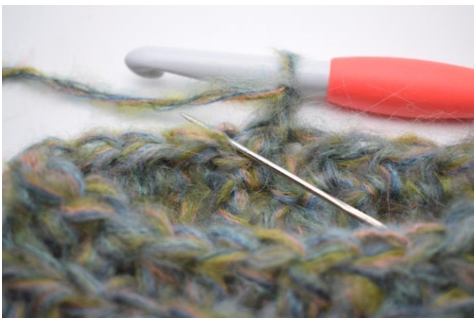
14. Haak 1 Hstk in Al in eerste steek.