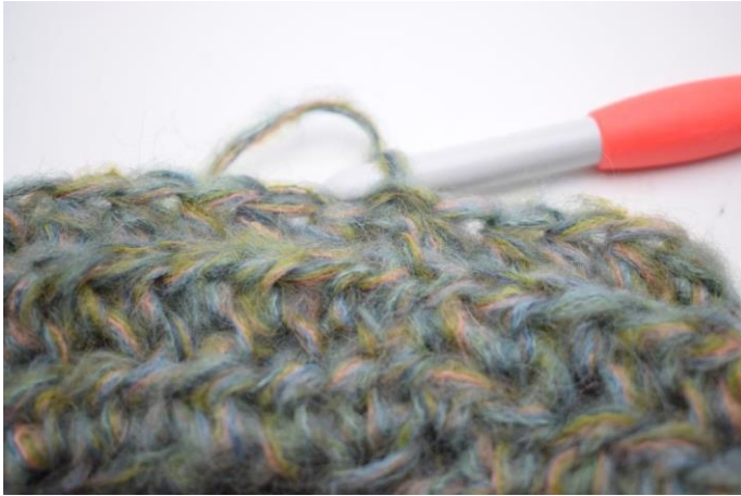
11. Haak Hstk in Al de gehele toer. Sluit met 1 Hv in eerste Hstk. (58)