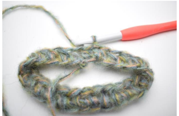
2. Haak 1 L. Haak 1 Hstk in elke steek de gehele toer. Sluit met 1 Hv in eerste Hstk. (58)