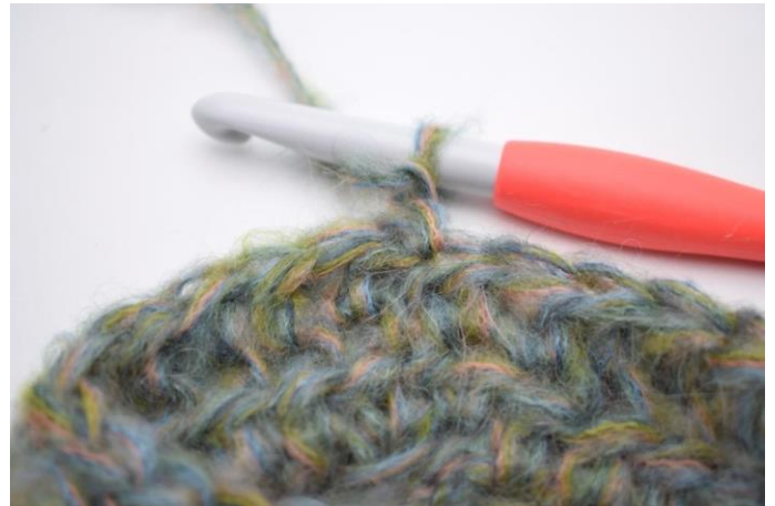
8. Keer het werk.