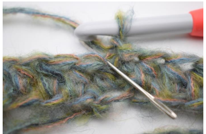
4. Haak 1 Hstk in Al in eerste steek. De naald laat de lus zien waarin je haakt.