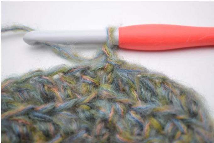
7. Haak 1 L.