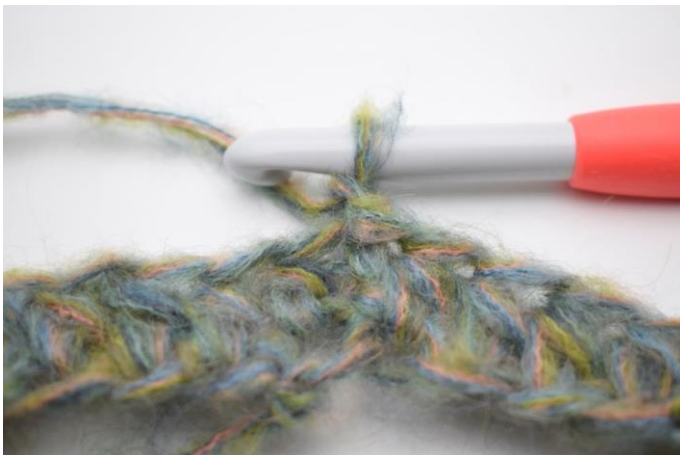
3. Haak 1 L.