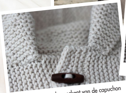
Gevouwen aan de voorkant van de capuchon