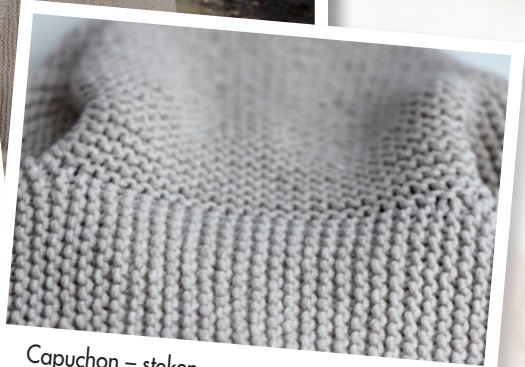
Capuchon – steken opgenomen vanuit de neklijn