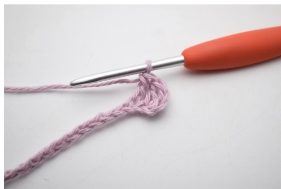
4. Haak 1 stk in volgende l.