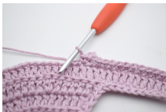
8. Zoals hier.