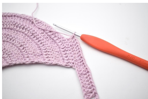
8. Nu wordt er in A1 gehaakt. "Haak 2 stk in volgende s, 1 stk in volgende 8 s".