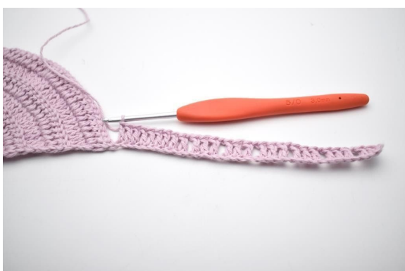
7. Haak 1 l, sla 1 l over en haak 1 stk in de laatste 9 l.