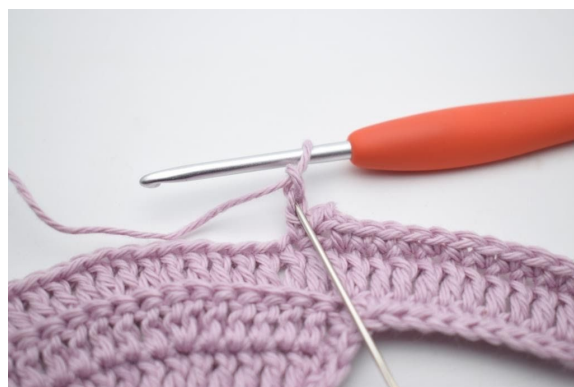
10. Haak 1 hv in 2 l vanaf de naald.