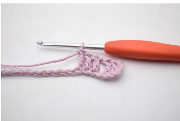
5. "Haak 1 l, sla 1 l over en haak 1 stk in de volgende 3 l".