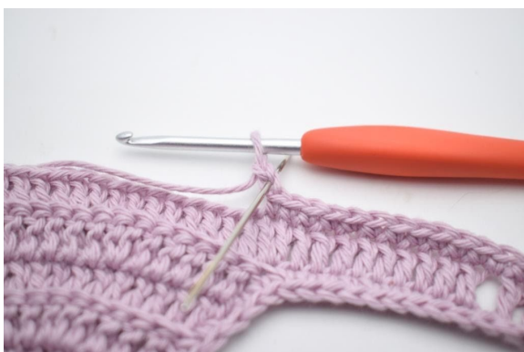
5. Haak 1 hv in 2 l vanaf de naald.