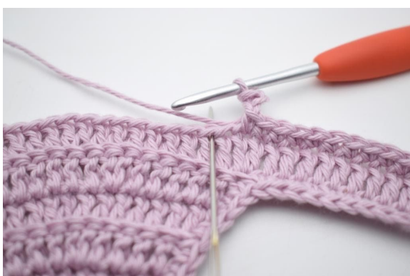
7. Sla 1 s over en haak 1 v in volgende s.