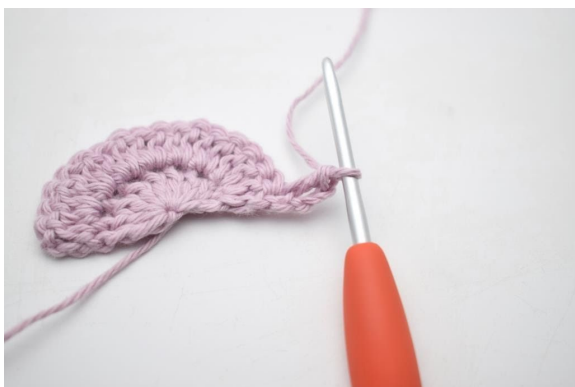
3. Zoals hier.