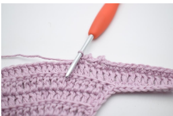
13. Zoals hier.