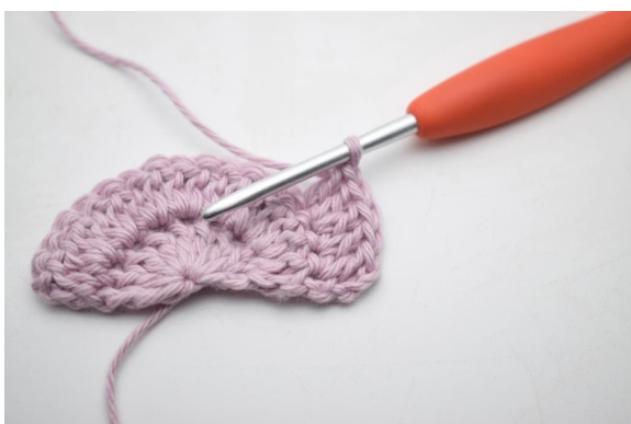
5. "Haak 2 stk in volgende s, 1 stk in de volgende s".