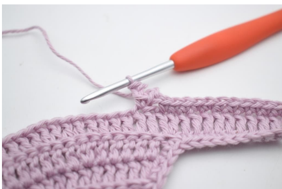
11. Sla 1 s over.