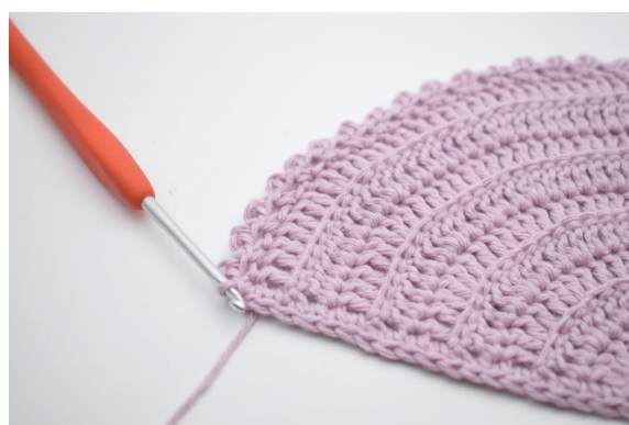
14. "Haak 2 l, haak 1 hv in 2e l vanaf de naald, sla 1 s over en haak 1 v in volgende s". Herhaal van " tot " de toer uit en sluit af met 1 hv in eerste s.