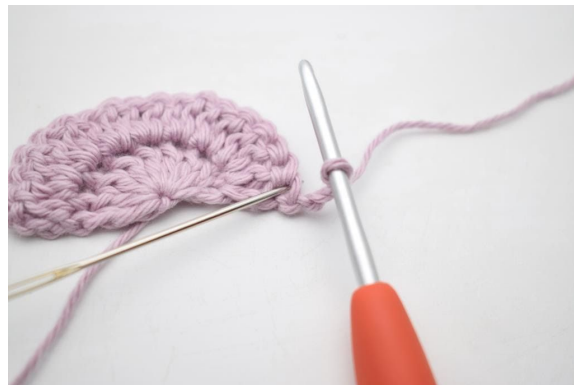
2. Haak 1 stk in dezelfde s.