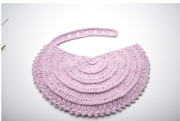
15. Zoals hier. Knip het garen en hecht af.