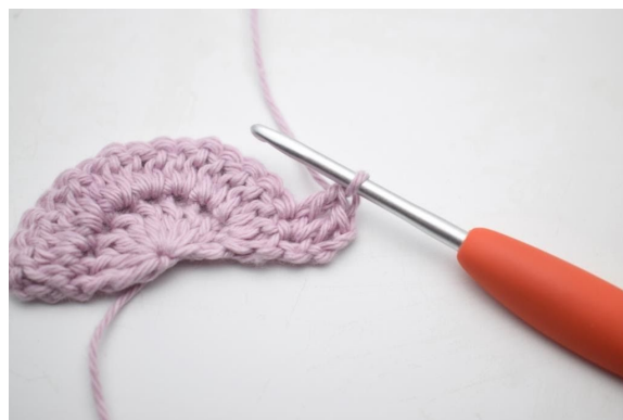
4. Haak 1 stk in volgende s.