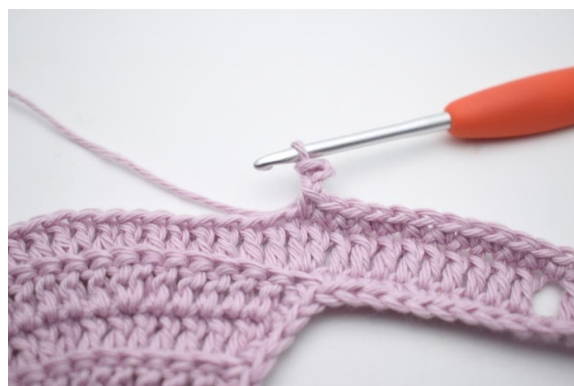
6. Zoals hier.