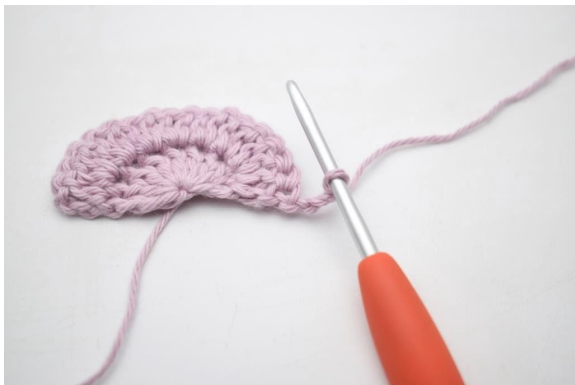
1. Keer met 3 l.