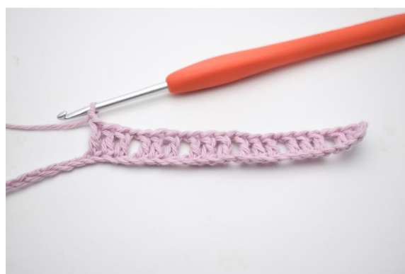
6. Herhaal van "tot" in totaal 5 keer.