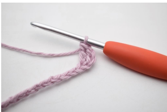
3. Zoals hier.