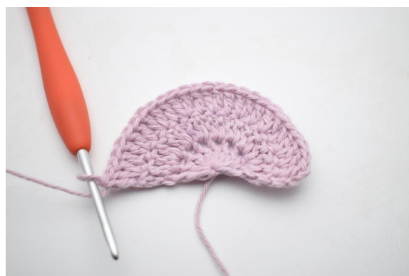
6. Herhaal van "tot" de rij uit . (27)