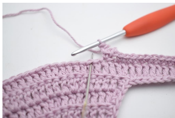
12. Haak 1 v in volgende s.