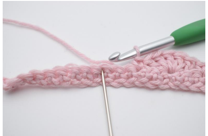
10. Sla 2 steken over en haak 5 Stk in de volgende steek.