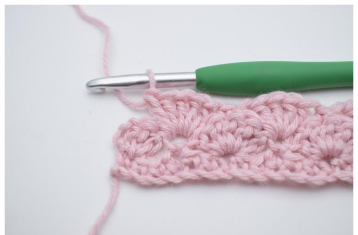
12. Herhaal dit tot je nog 3 steken over hebt.