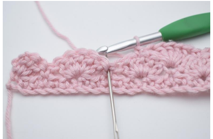
10. Sla 2 steken over en haak 5 Stk in de volgende steek.