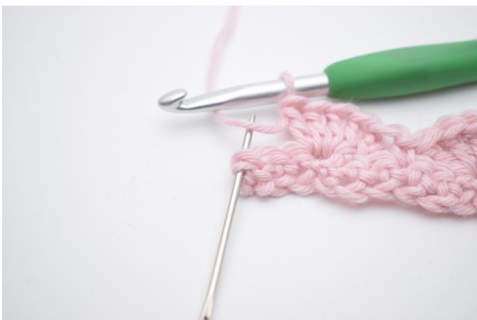
13. In de laatste steek wordt 1 V gehaakt.