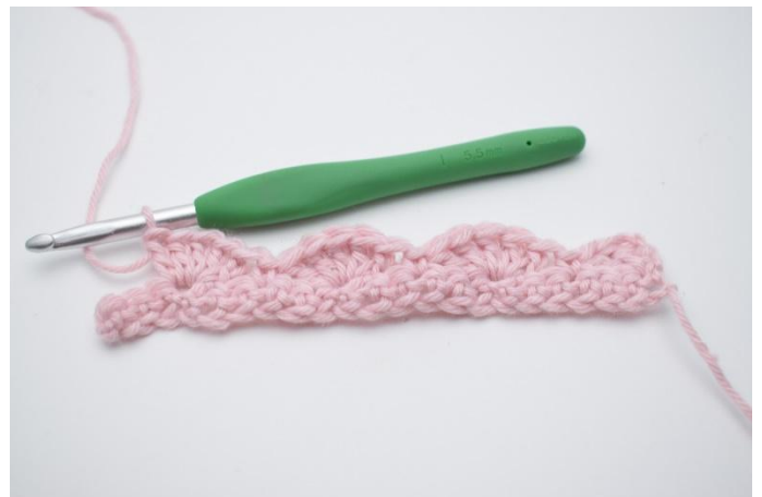
12. Herhaal dit tot je nog 3 steken over hebt.