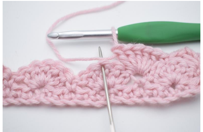
8. Sla 2 steken over en haak 1 V in de volgende steek.