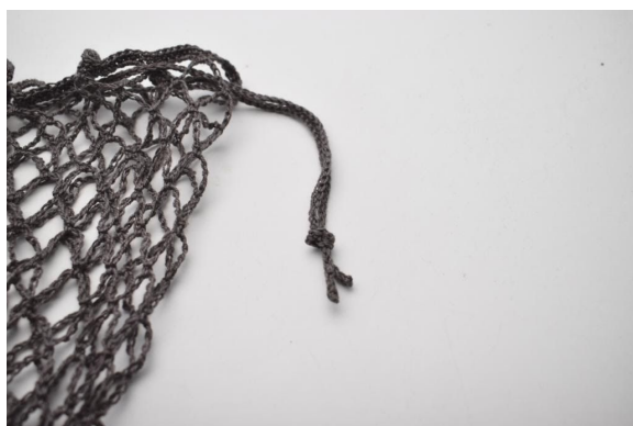
5. Leg een knoop in de uiteinden.