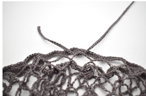
2. Trek het snoer in en uit de openingen onder de rand.