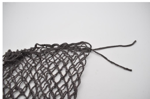
4. Doe dit helemaal rond.