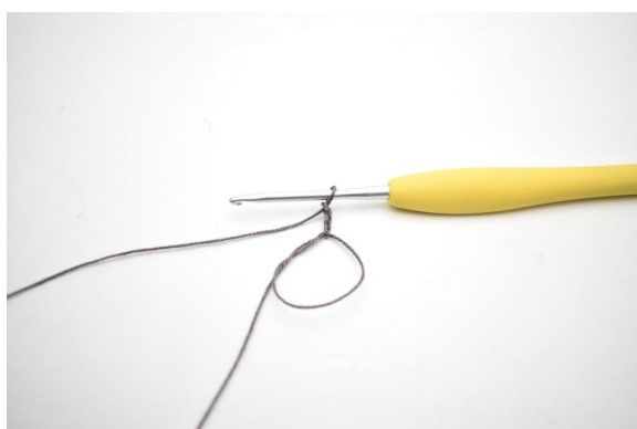
1. Maak een magische ring. Haak 3 L (vervangen 1e Stk).