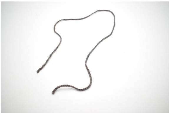
1. Je snoer is nu klaar.

Rijg het koord rond in de opening van het net als op de foto hieronder: