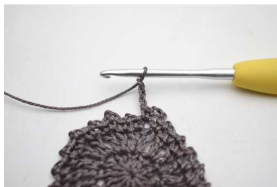
4. “Haak 3 L, haak 1 V in volgende L-boog”.