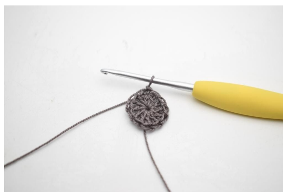
2. Haak 11 Stk in de ring. Sluit met 1 Hv in de 3e L van het begin. (12 Stk)