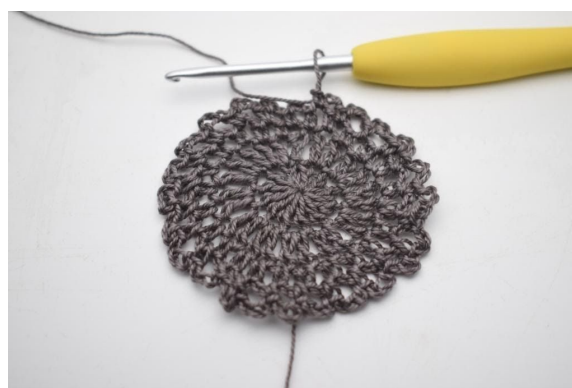
6. Herhaal “tot” de gehele toer. (24 L-bogen)