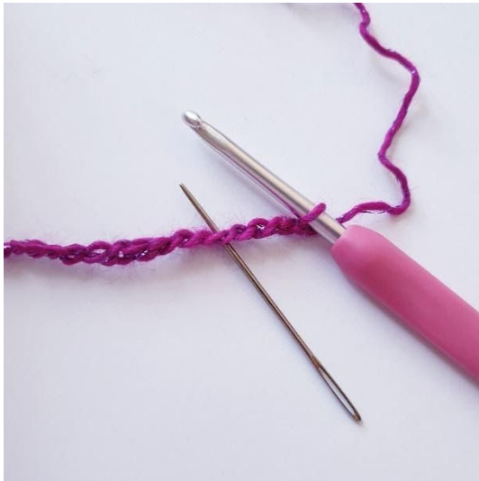
Toer 1: V-s in 5 l vanaf de naald