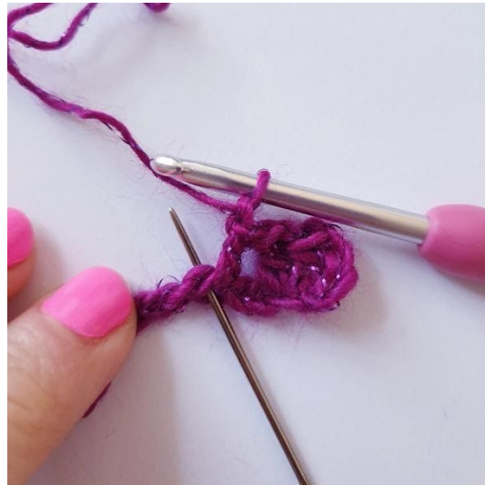
1 l, 1 stk in dezelfde s