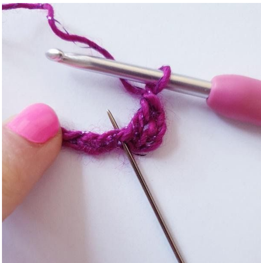
1 l, 1 stk in dezelfde s