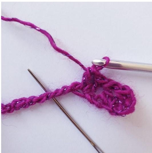
herhaal [sla 2 s over, V-s in volgende s]