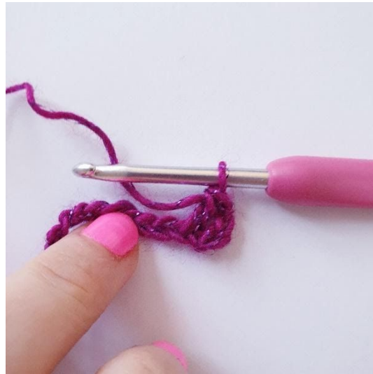
V-steek: 1 stk