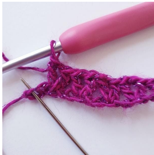
Als er nog 2 steken over zijn: sla 1 s over,