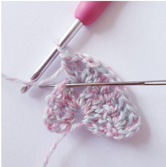
1 stk in de volgende 4 s