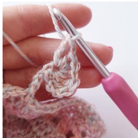
1 l, 1 dstk,