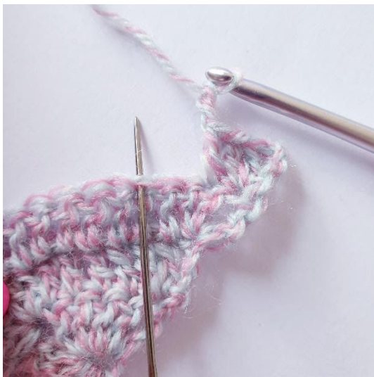
2 l, sla 2 s over