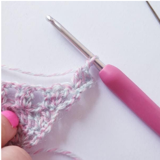
2 stk in eerste s