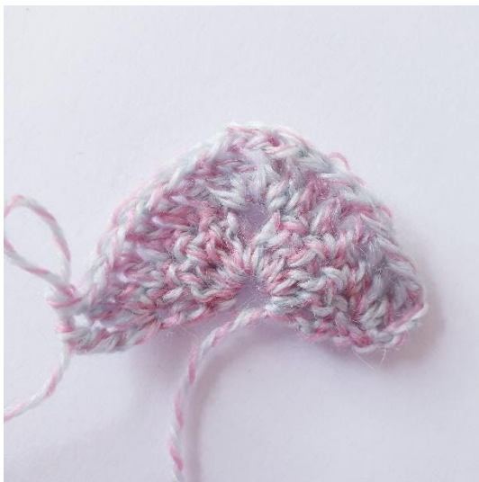
Na toer 2