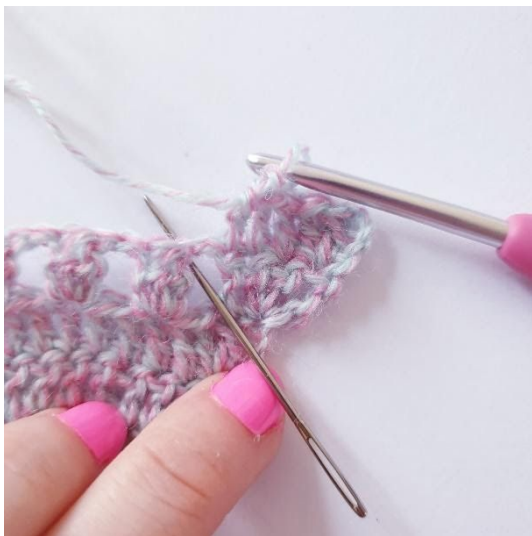
2 stk in l-boog, 1 stk in volgende stk, herhaal tot aan de punt