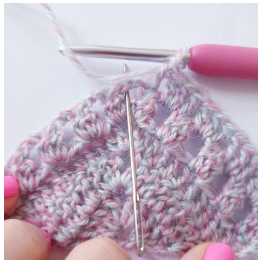
In de punt: [2 stk, 2 l, 2 stk]