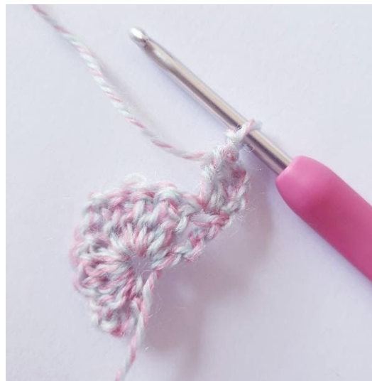
Toer 2: 2 stk in eerste s