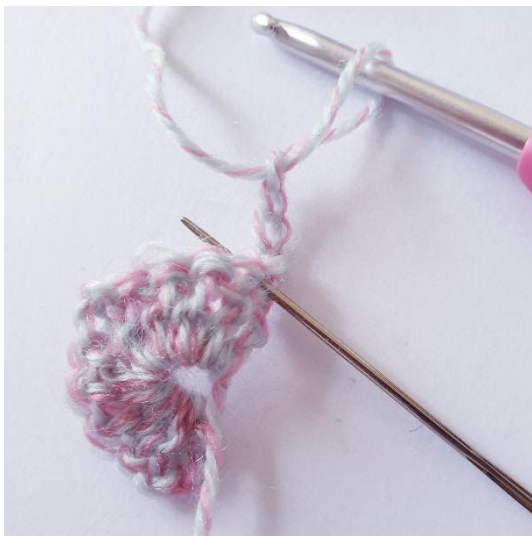
Haak 4 l en keren