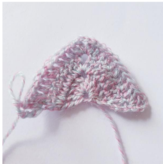
Na toer 3