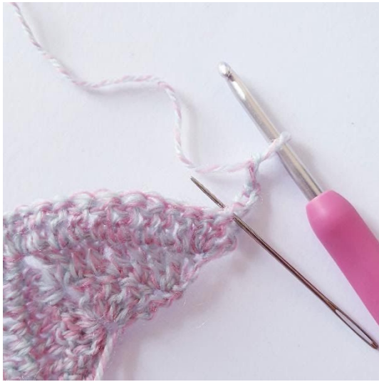
Toer 4: 2 stk in eerste s