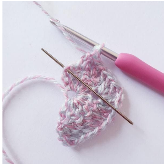
[2 stk, 1 dstk] in kl.