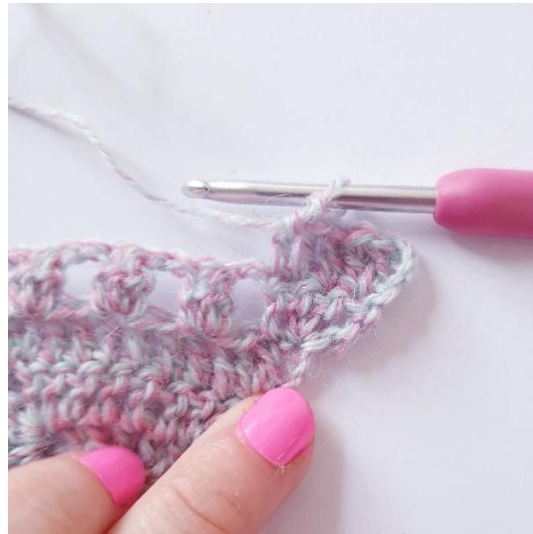
1 stk in de volgende 3 s