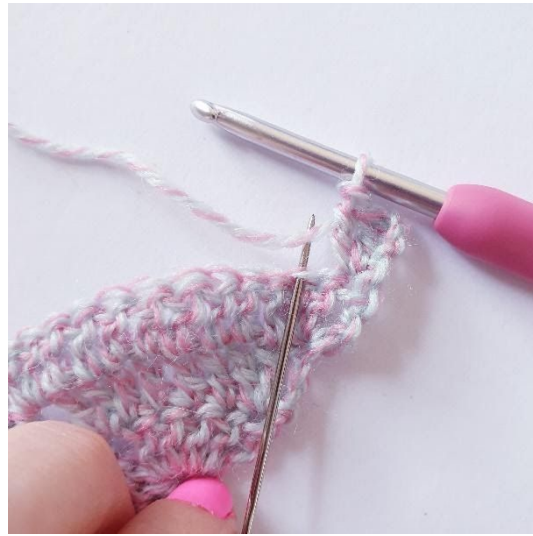
1 stk in volgende s