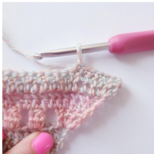
1 v in de volgende 6 s,