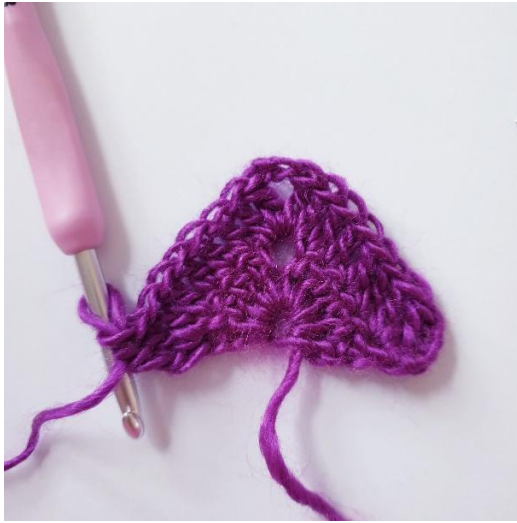
Na toer 2