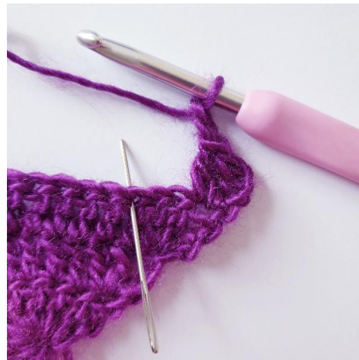
[2 l, sla 2 s over,