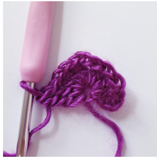
Trek de ring iets meer dicht