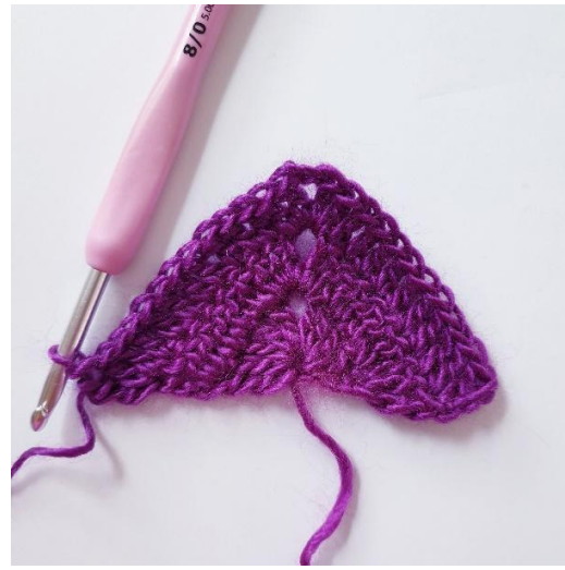
Na toer 3