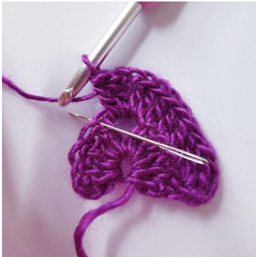
1 stk in de volgende 4 s