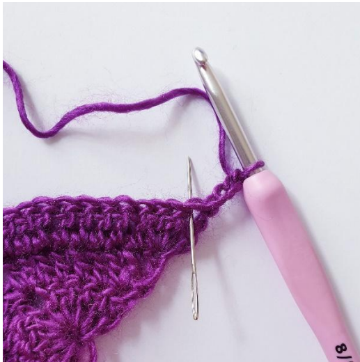
Toer 4: 2 stk in eerste s