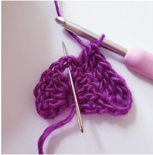
1 stk in de volgende 4 s