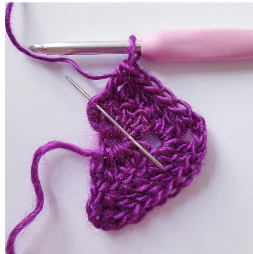
[2 stk, 1 dstk] in kl