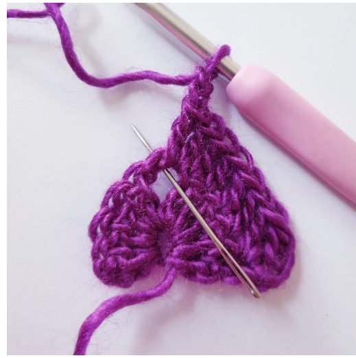
[2 stk, 2 l, 2 stk] in de punt