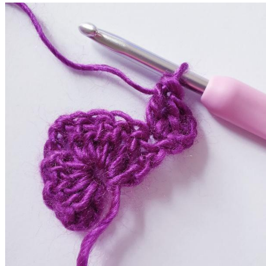
Toer 2: 2 stk in eerste s