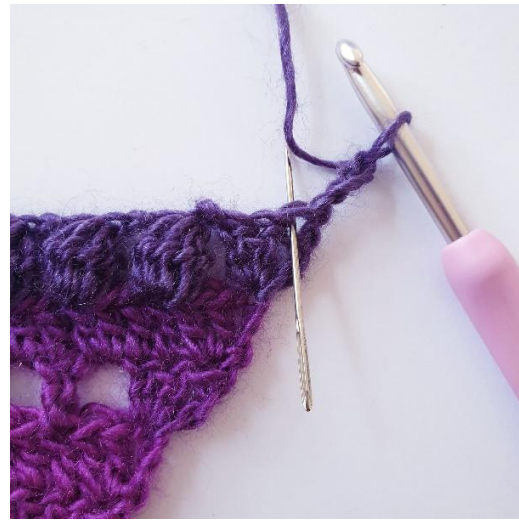
Toer 7: 2 stk in eerste s