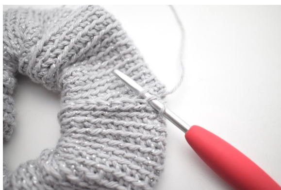
13. Haak weer 1 Hv door beide uiteinden.