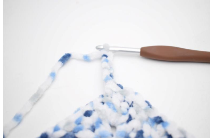
33. Haak 6 l en haak 1 v in 2e l van de naald. Haak 1 v in de laatste 4 l.