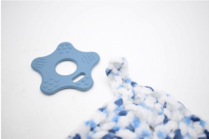
5. Monteer de bijtring in de volgende hoek