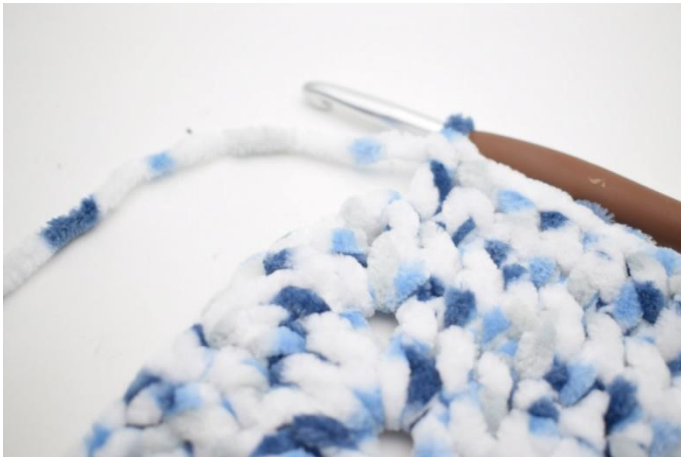
23. Haak "1 stk in de volgende 27 s.