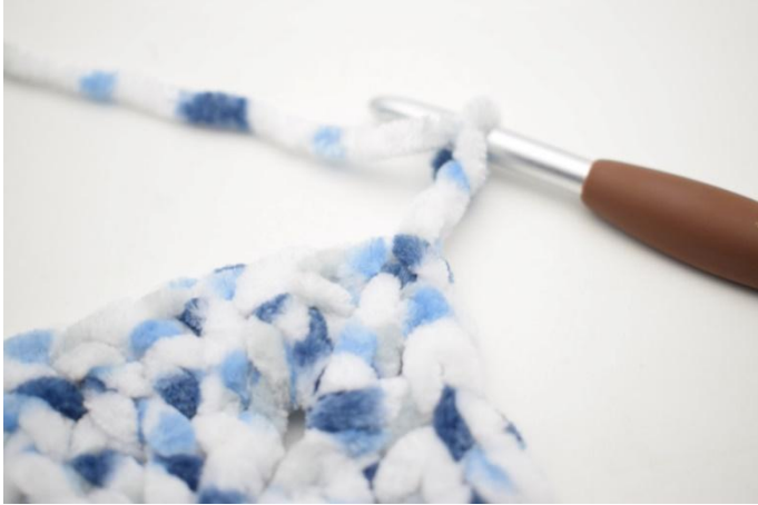
21. Haak 1 hv in l-boog. Haak 3 l.