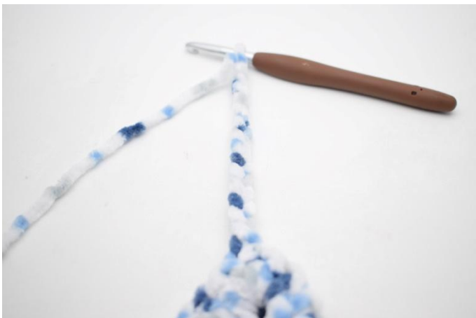
36. Haak 15 l. Haak 3 v in 2e l van de naald. Haak 3 v in alle laatste 12 l.