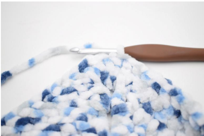
25. Herhaal van " tot " in totaal 3 keer. Haak 1 stk in de volgende 27 s en 1 stk in l-boog van het begin van de toer. Sluit af met 1 hv in 3e l.