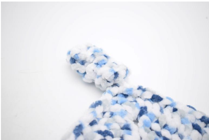
7. De laatste hoek is zoals hij moet zijn.