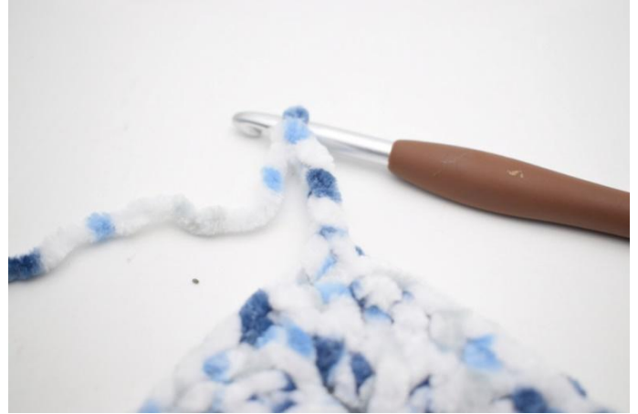
27. Haak 4 l en haak 1 v in 2 l van de naald. Haak 1 v in de laatste 2 l.