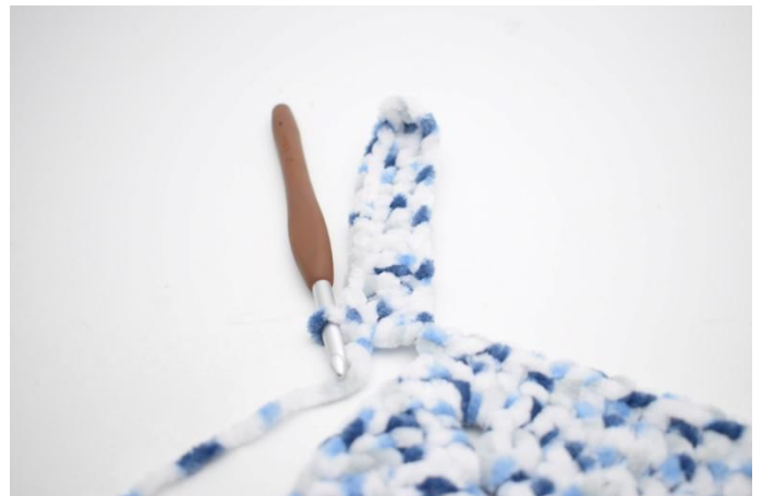
31. Zoals hier.