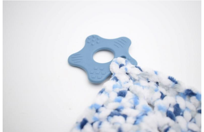
6. Haal de hoek door de opening in de bijtring en naai deze vast.