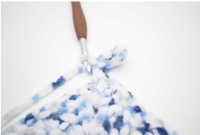
34. Zoals hier.