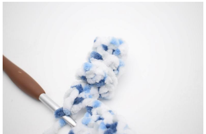
37. Zoals hier.