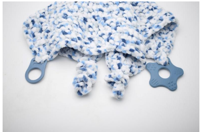
8. Je knuffeldoekje is nu klaar om mee geknuffeld te worden 😊