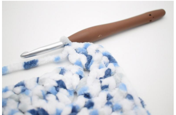
24. Haak 5 stk in volgende l-boog".