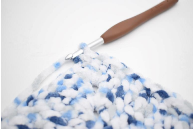
32. Haak 1 v in de volgende 32 s.