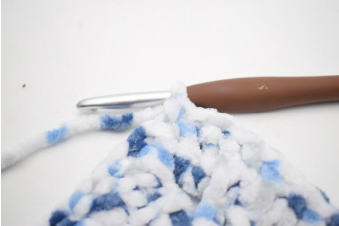
26. Haak 1 l. Haak 1 v in eerste s.