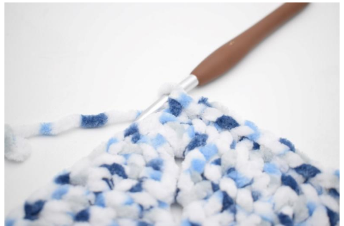
35. Haak 1 v in de volgende 32 s.