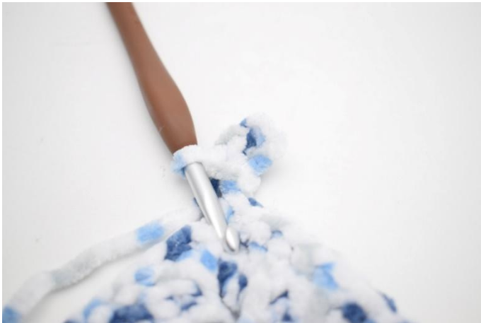
28. Zoals hier.