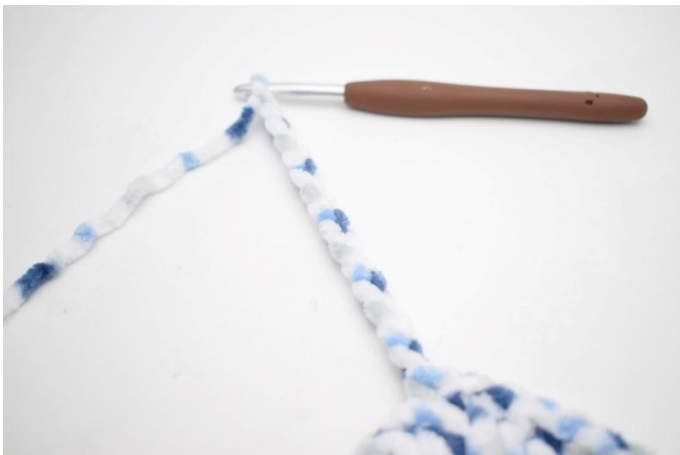
30. Haak 15 l. Haak 1 stk in 3e l van de naald. Haak 1 stk in de laatste 12 l.