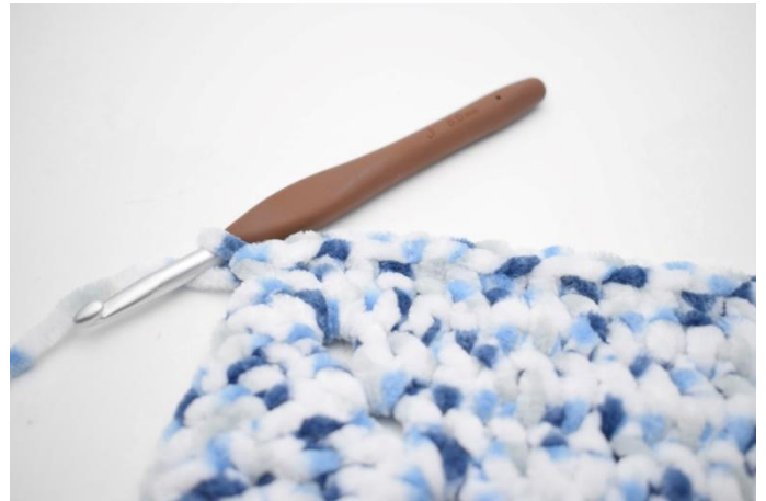
29. Haak 1 v in de volgende 32 s.