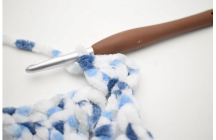
22. Haak 3 stk in l-boog.