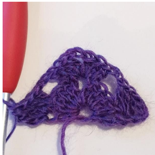
2 Stk, 1 Dstk in KS.