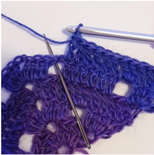
1 Stk in de volgende 6 steken