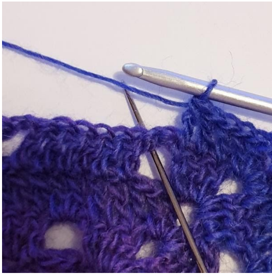
1 Stk in de volgende 3 steken