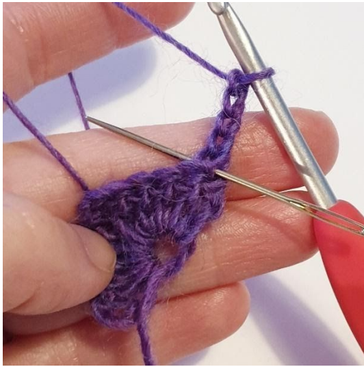
Toer 2: 2 Stk in eerste steek.