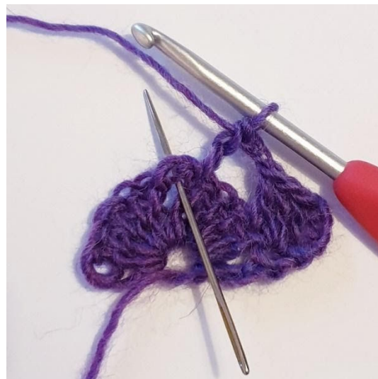
1 Stk. In de punt worden 2 Stk, 2 L, 2 Stk gehaakt.