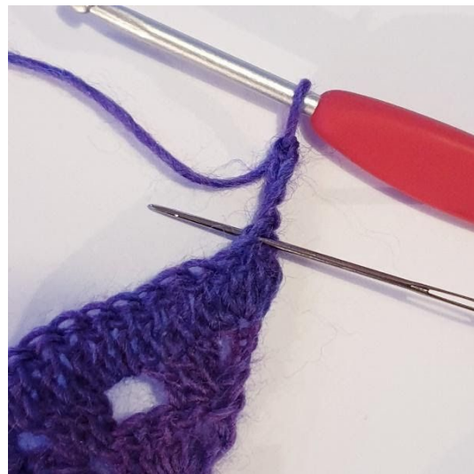
Toer 4: 2 Stk in eerste steek