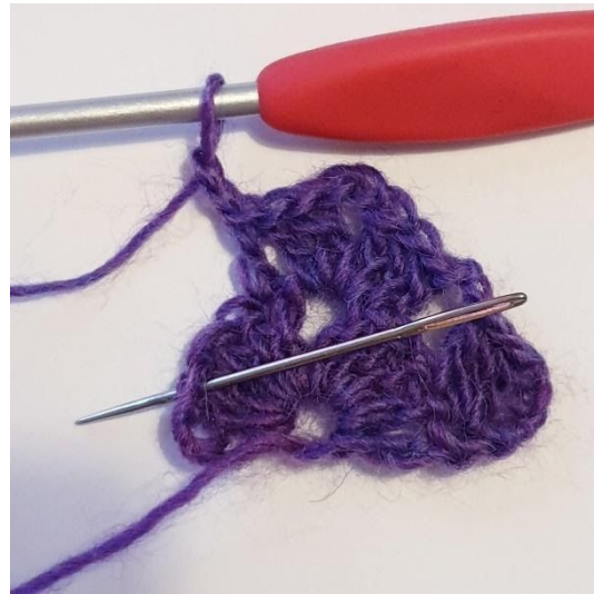
2 L, sla 2 steken over.