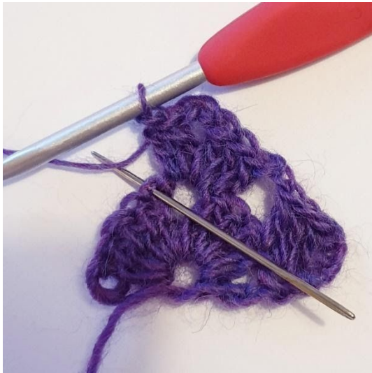
1 Stk in volgende steek