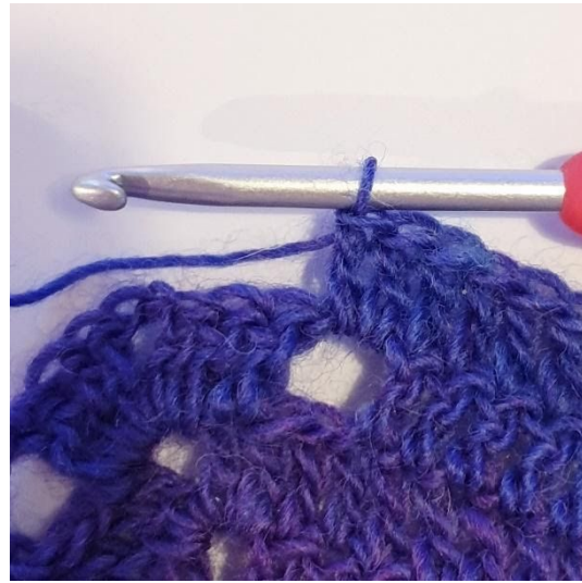
2 Stk in L-boog