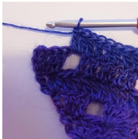
2 Stk in L-boog