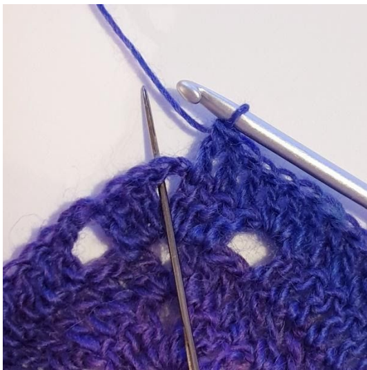
1 Stk in de volgende 3 steken