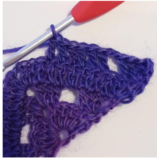
1 Stk in de volgende 6 steken