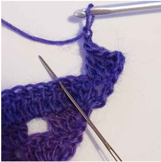
1 Stk, 2 L, sla 2 steken over