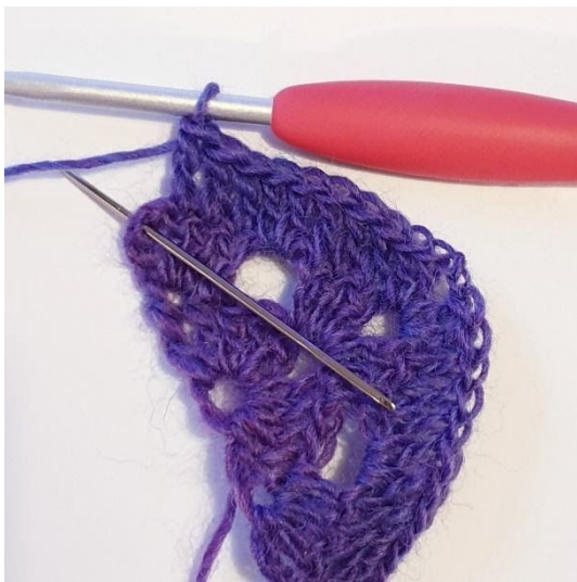
1 Stk in de volgende 3 steken. 2 Stk, 1 Dstk in KS.