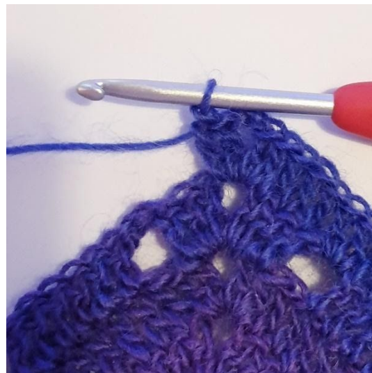
2 Stk, 2 L, 2 Stk in de punt.