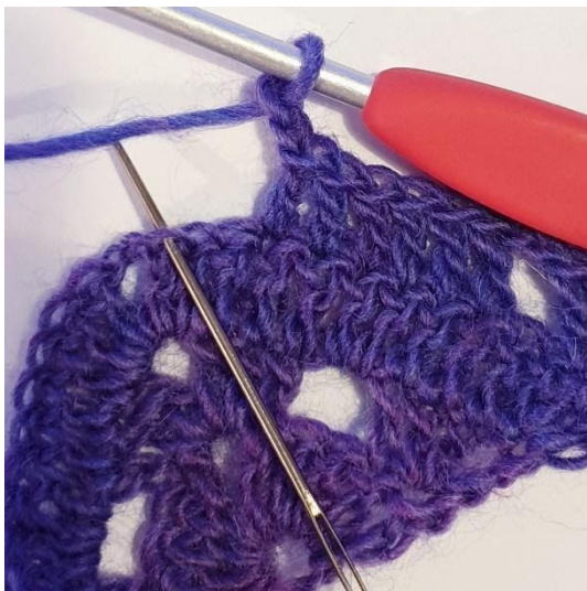
2 L, sla 2 steken over