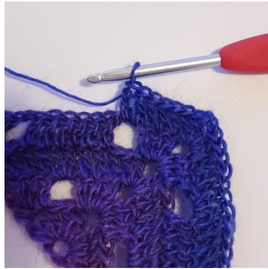
2 Stk in L-boog