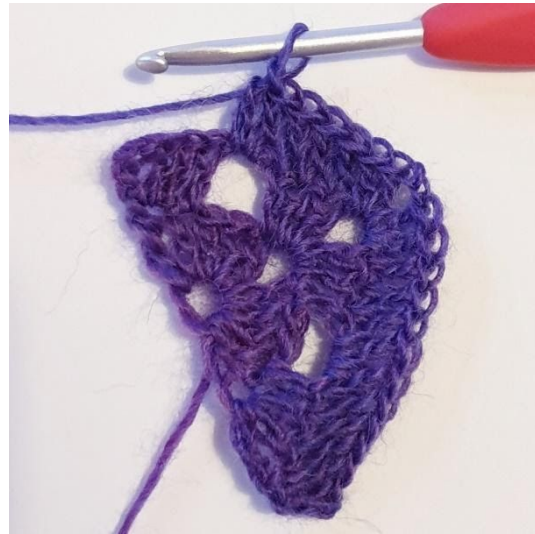
2 Stk in L-boog