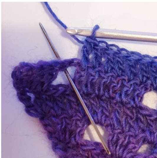
1 Stk in de volgende 6 steken