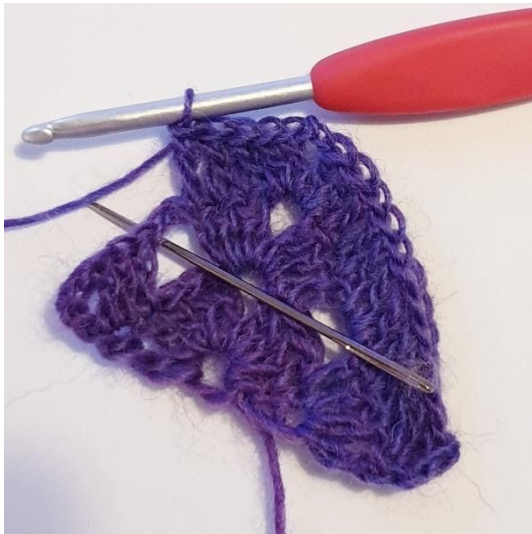
1 Stk in de volgende 3 steken