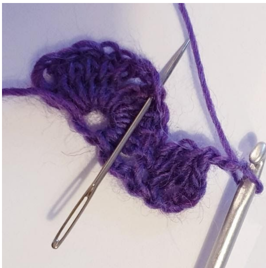
2 L, sla 2 steken over