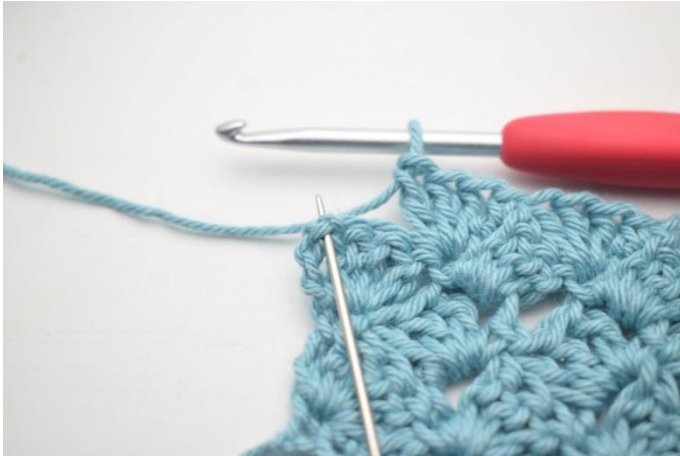
46. Haak 1 v in laatste l-boog.