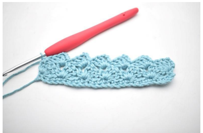
24. Zoals hier.