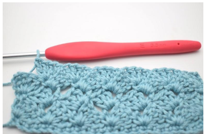
45. Herhaal " tot " in totaal 13 keer.