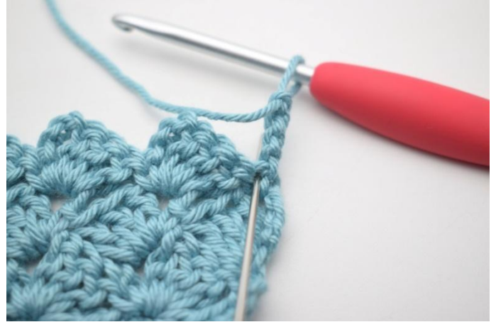
35. Haak 2 stk in eerste s.