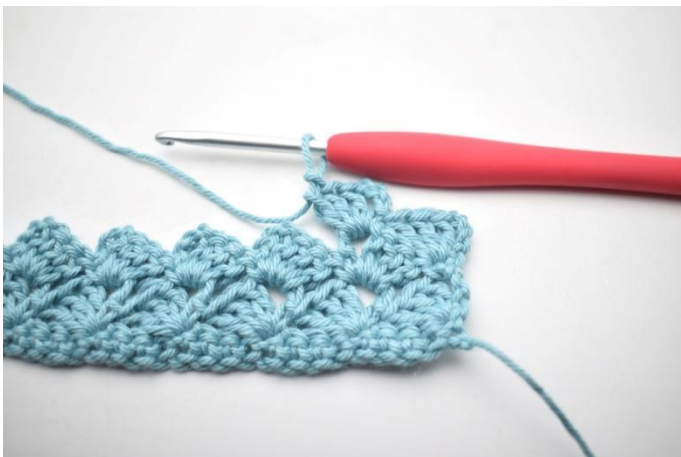
29. Zoals hier.