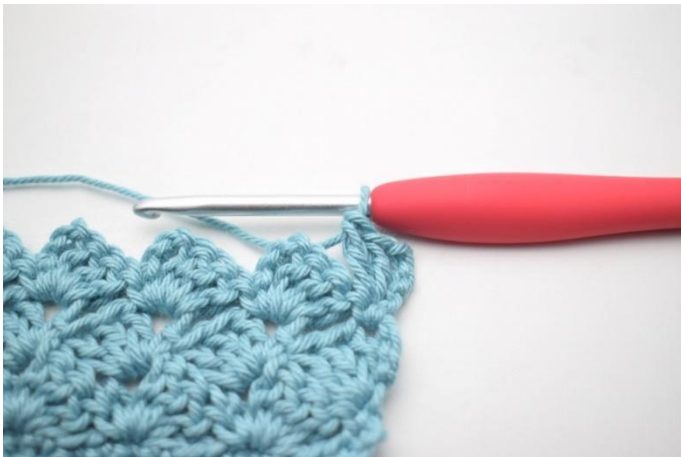
36. Zoals hier.