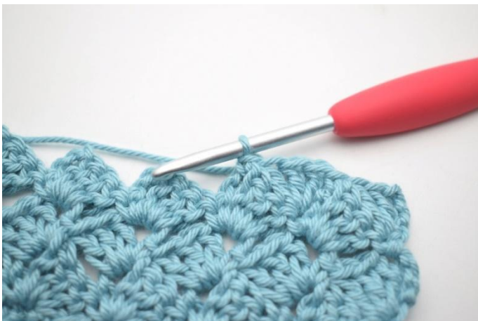
42. Zoals hier.