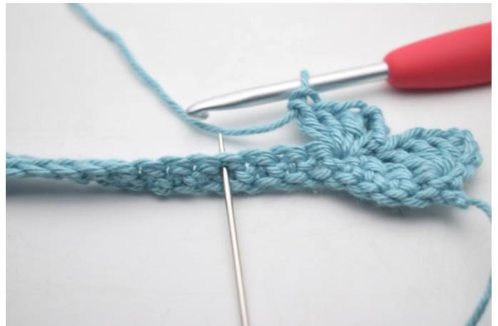
10. "Sla 3 s over, haak 1 v, 3 l en 3 stk in volgende s".