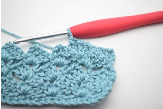
40. Zoals hier.