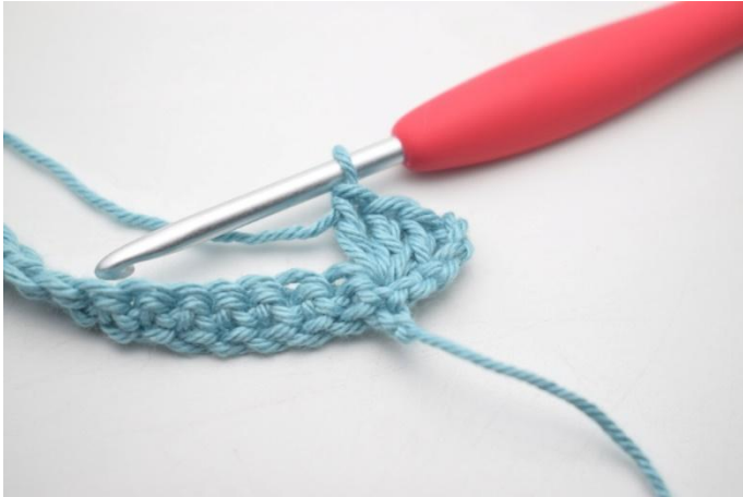
7. Zoals hier.