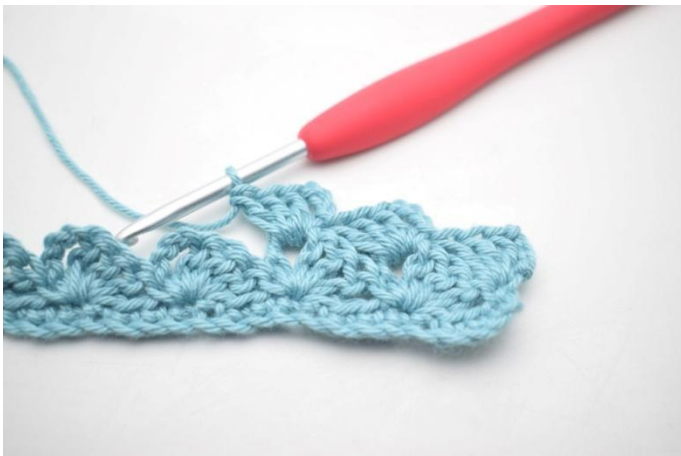
21. Zoals hier.