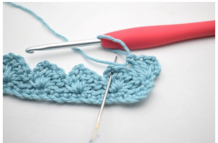
18. "Haak 1 v, 3 l en 3 stk in volgende l-boog".