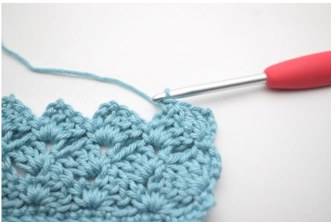
38. Zoals hier.