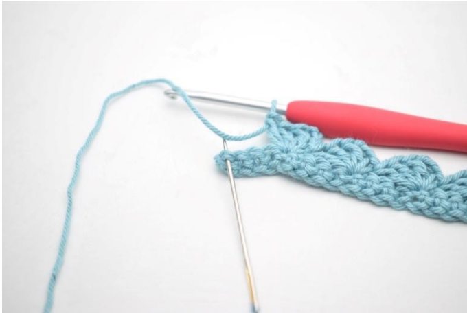
13. Sla 3 s over en haak 1 v in laatste s.