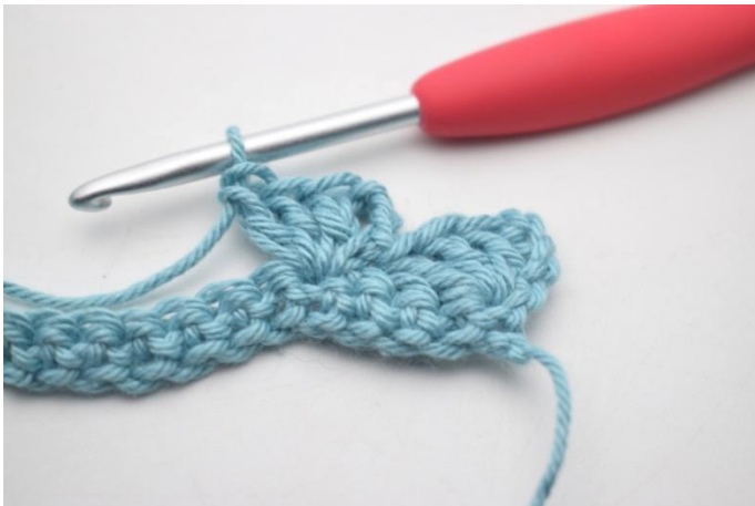
9. Zoals hier.