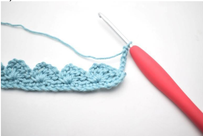
15. Keer met 4 l.