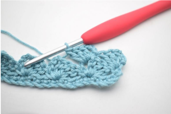
19. Zoals hier.