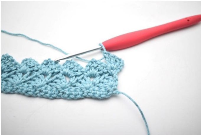
27. Zoals hier.