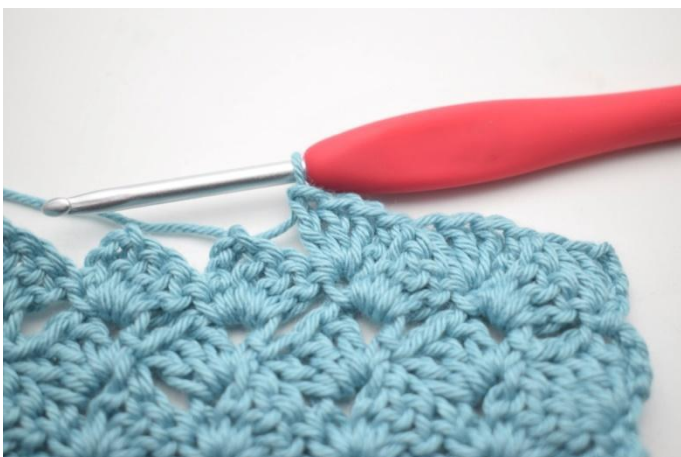
44. Zoals hier.