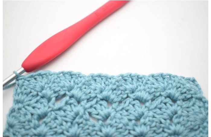
47. Zoals hier.