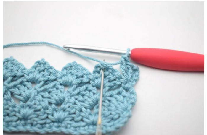
37. "Haak 1 v in volgende l-boog.