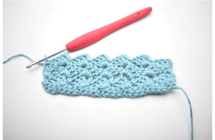
32. Zoals hier.