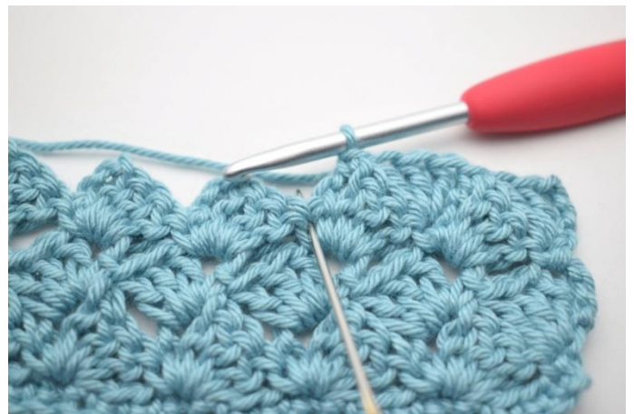
43. Haak 3 stk in v van de vorige rij".