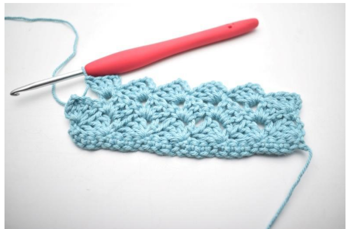
30. "Haak 1 v, 3 l en 3 stk in volgende l-boog". Herhaal "tot" in totaal 13 keer.