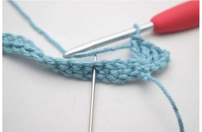
8. "Sla 3 s over, haak 1 v, 3 l en 3 stk in volgende s".