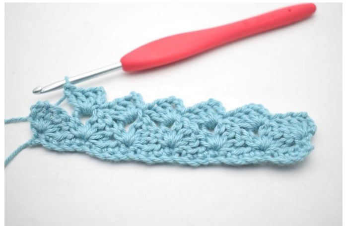
22. Herhaal van "tot" in totaal 13 keer.