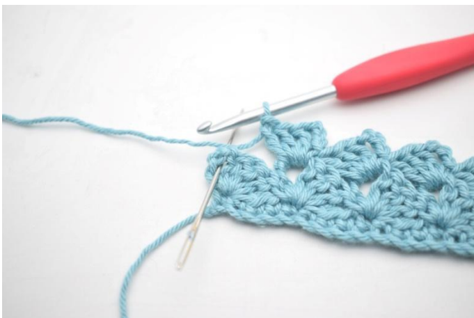
23. Haak 1 v in laatste l-boog.