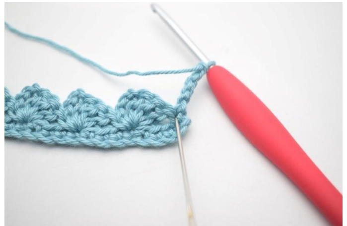
16. Haak 3 stk in eerste s.