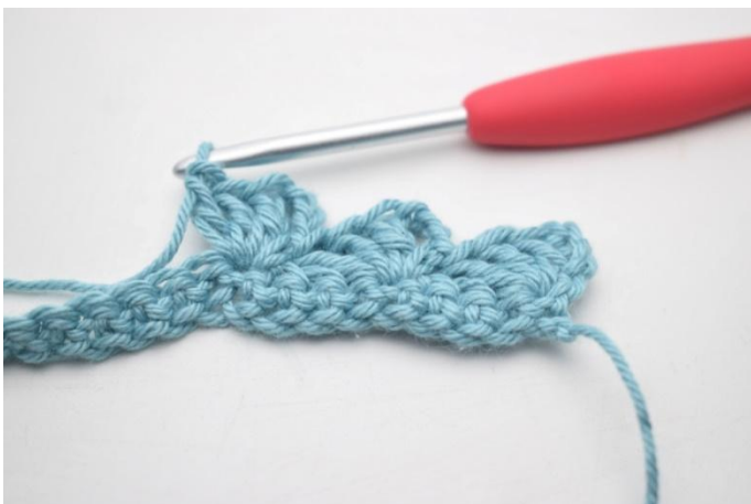
11. Zoals hier.