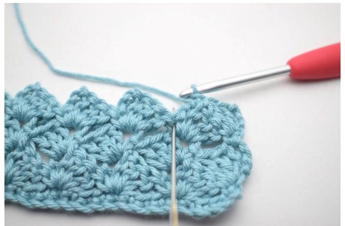
39. Haak 3 stk in v van de vorige rij".