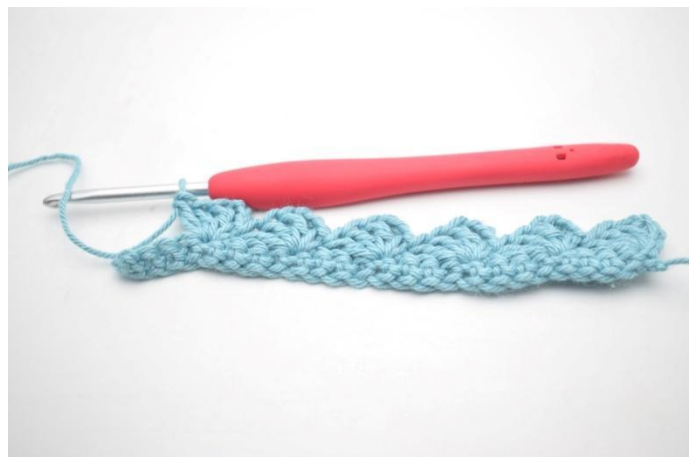
12. Herhaal van " tot " tot je 4 s over hebt.