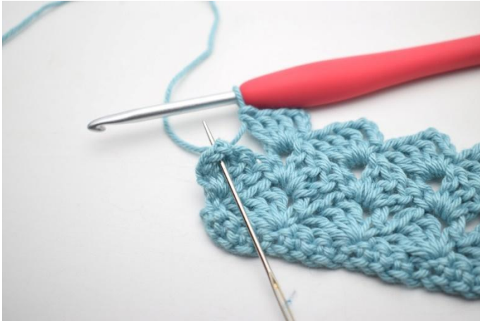
31. Haak 1 v in laatste l-boog.