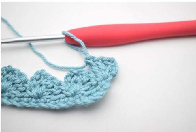
17. Zoals hier.