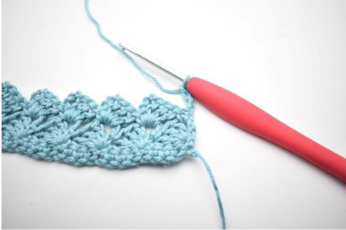
25. Wordt gehaakt als rij 3. Keer met 4 l.