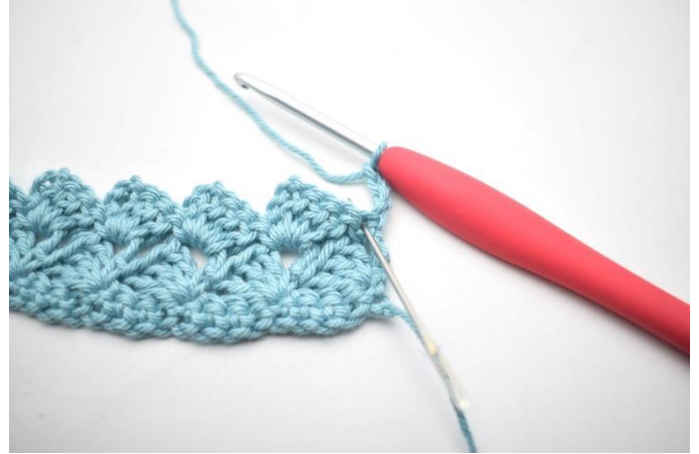
26. Haak 3 stk in eerste s.