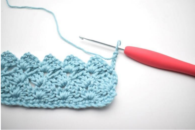
34. Keer met 4 l.