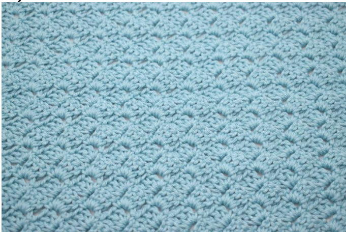
33. Haak verder zoals rij 3 tot je in totaal 24 rijen hebt.