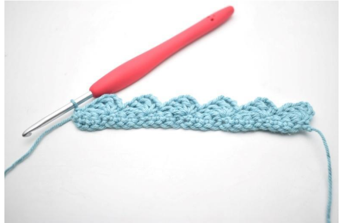
14. Zoals hier.