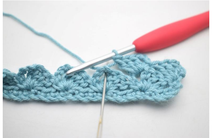
20. "Haak 1 v, 3 l en 3 stk in volgende l-boog".