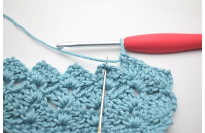
41. "Haak 1 v in volgende l-boog.