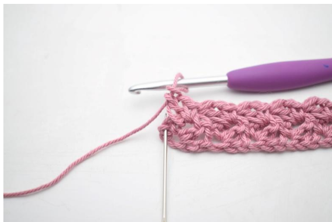
17. Haak 1 v in laatste s.