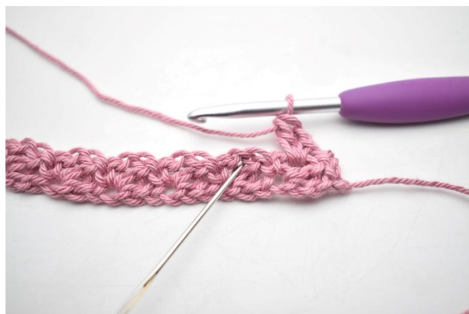
14. "Haak 1 v, 1 l en 1 stk in l-boog van de vorige rij".