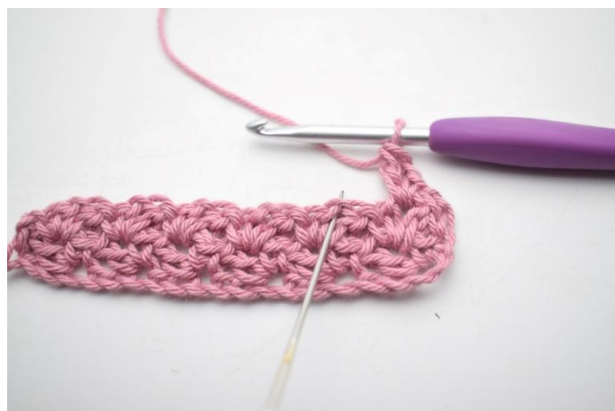
22. "Haak 1 v, 1 l en 1 stk in l-boog van de vorige rij".