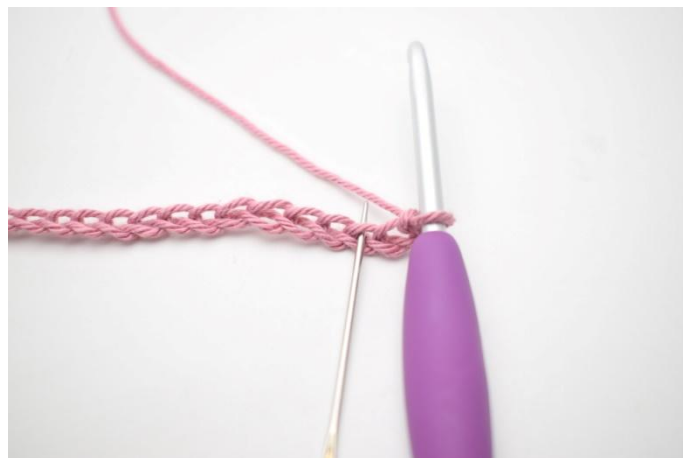
2. Haak 1 v, 1 l en 1 stk in 3e l vanaf de naald.