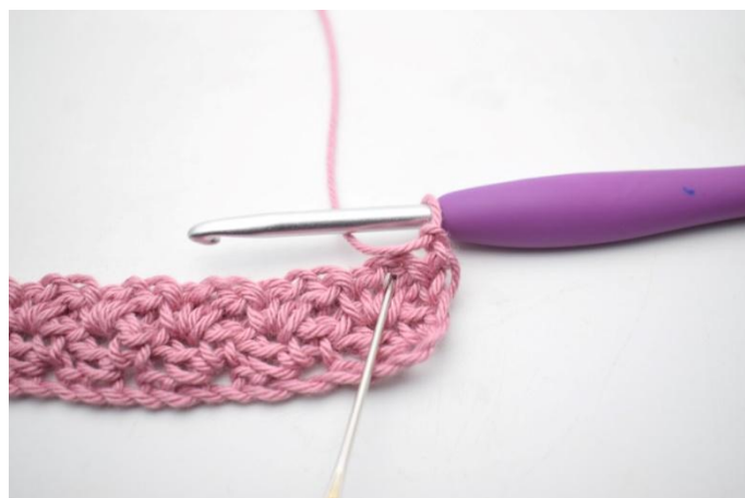
20. "Haak 1 v, 1 l en 1 stk in l-boog van de vorige rij".