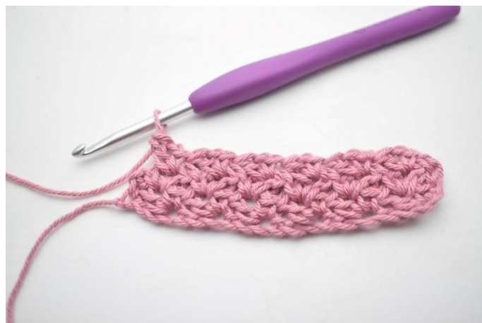
24. Herhaal " tot" de rij uit.