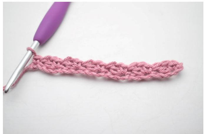
10. Zoals hier.