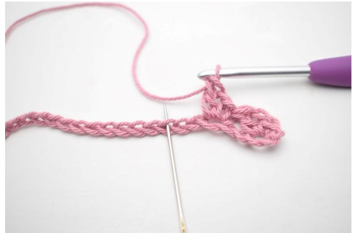
6. "Sla 2 l over en haak 1 v, 1 l en 1 st in volgende s".