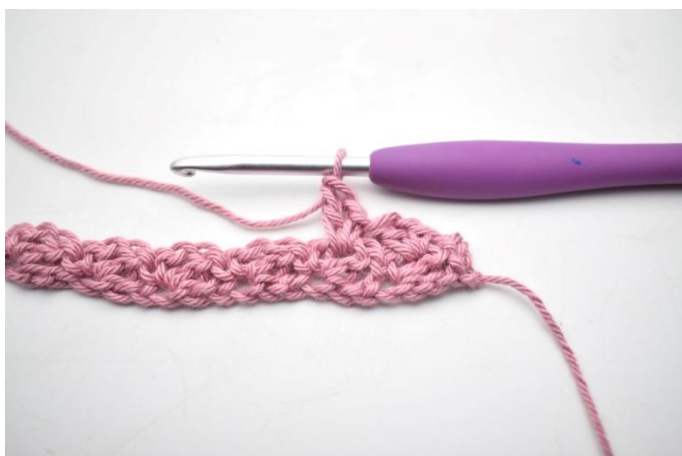
15. Zoals hier.