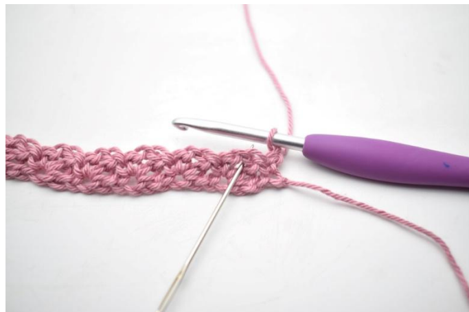
12. "Haak 1 v, 1 l en 1 stk in l-boog van de vorige toer".