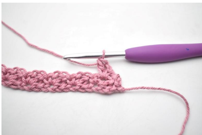
13. Zoals hier.