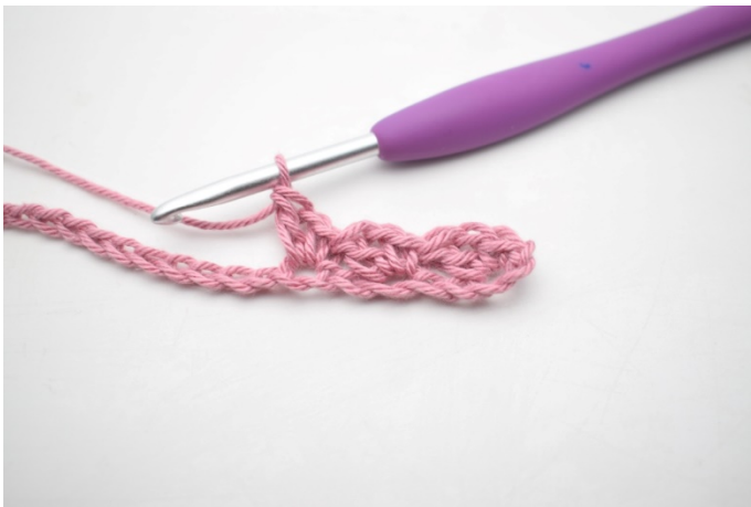
7. Zoals hier.