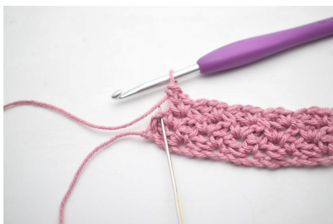
25. Haak 1 v in laatste s.