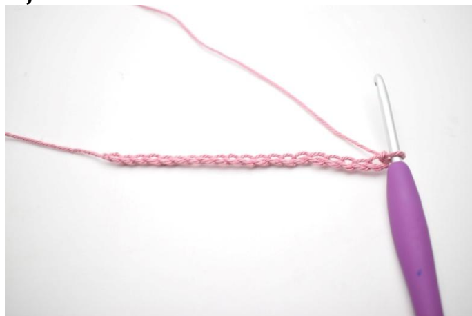
1. Zet 60 l op.