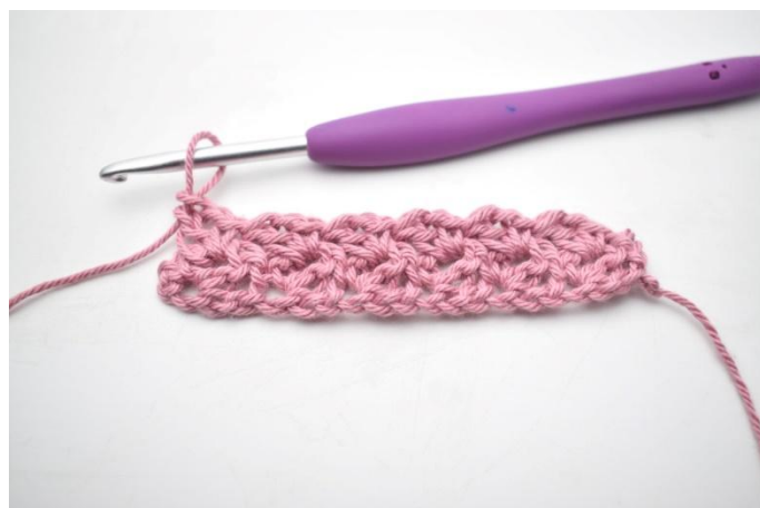
16. Herhaal " tot " de rij uit.