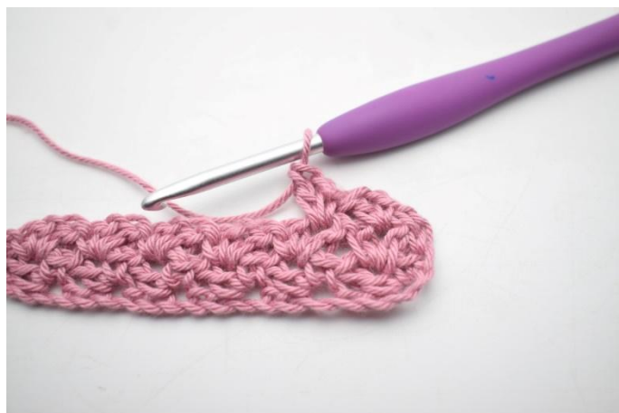
23. Zoals hier.