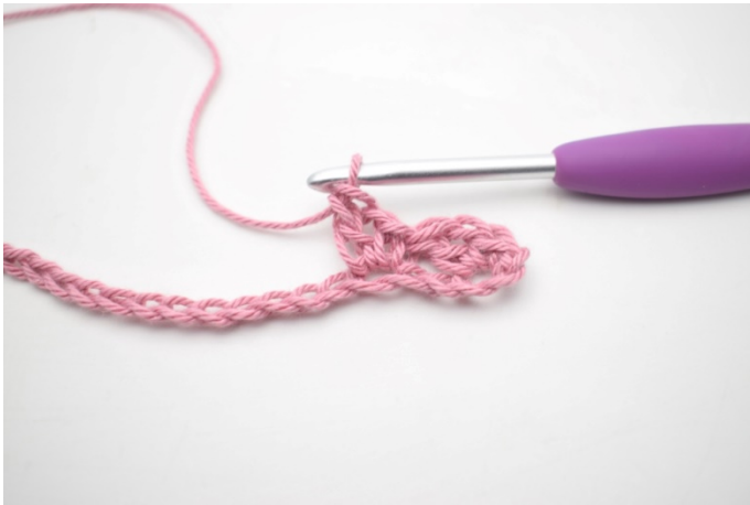
5. Zoals hier.