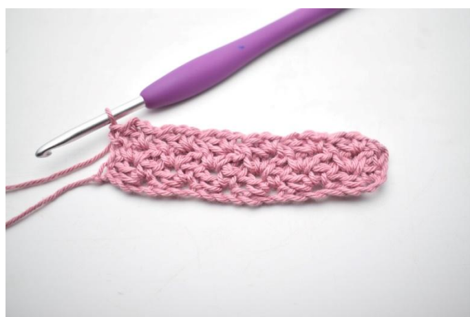
26. Zoals hier.