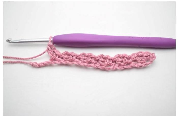
8. Herhaal "tot" tot er nog 3 l over zijn.