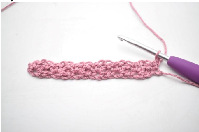
11. Keer met 1 l.