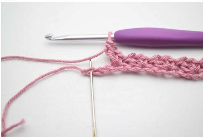
9. Sla 2 l over en haak 1 v in laatste s.