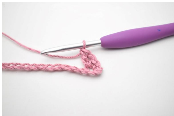
3. Zoals hier.