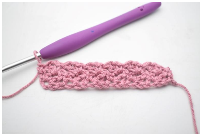
18. Zoals hier.