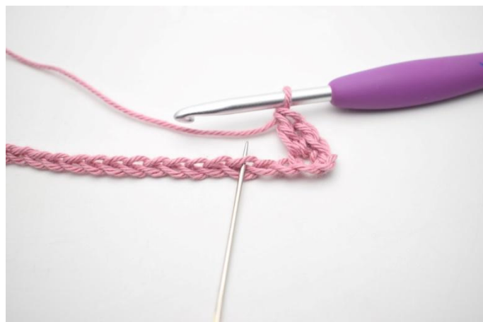
4. "Sla 2 l over en haak 1 v, 1 l en 1 stk in volgende s".