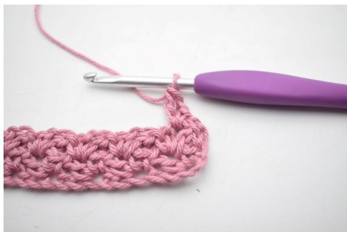
21. Zoals hier.