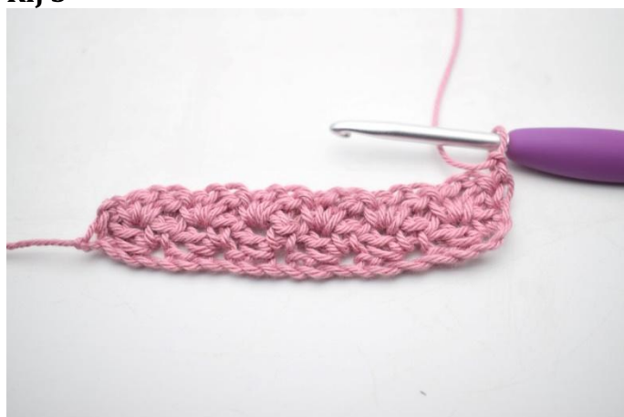
19. Wordt gehaakt als rij 2. Keer met 1 l.