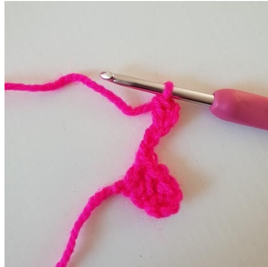
2. Haak 1 stokje in de 3e l vanaf de naald