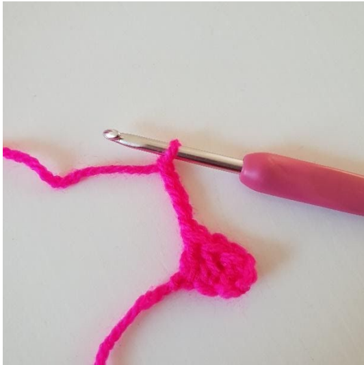
1. Haak 5 lossen