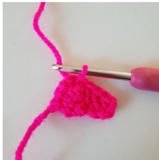
4. Nu haak je de tweede pixel vast aan de eerste. Dit doe je door de pixel te draaien en 1 hv te haken aan de linkerkant van de eerste pixel. De foto laat zien hoe de samengehaakte pixels eruitzien.