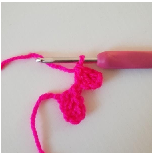
3. Haak stokjes in de volgende 2 lossen. Je hebt nu nog een pixel gehaakt.