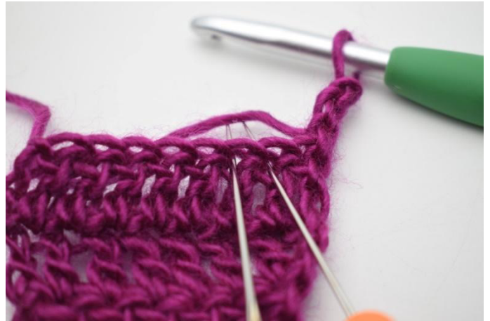
2. Nu wordt er geminderd, door steek 2 en 3 samen te haken.