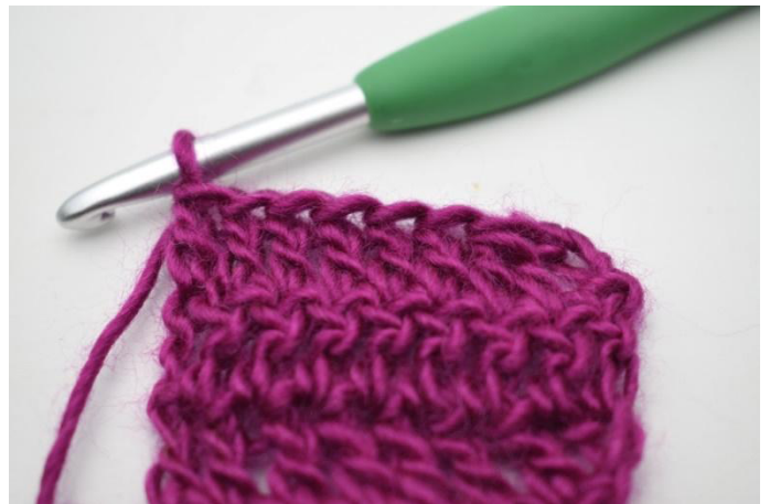
4. Haak Stk tot het einde van de toer.