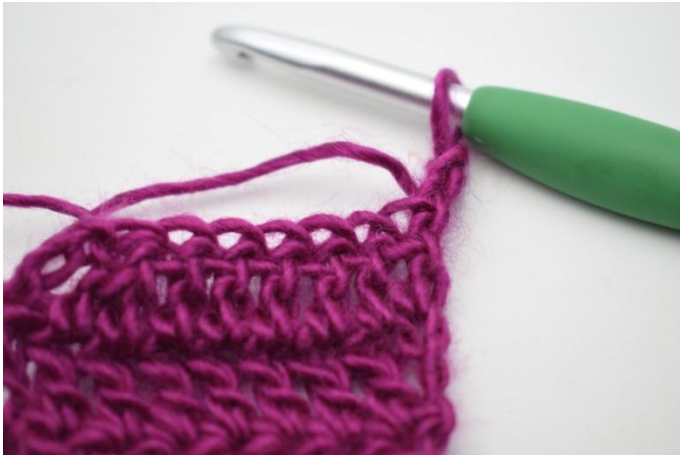
1. Keer met 3 L.

85. Keer met 3 L. Haak de 2 volgende steken samen. Haak Stk tot het einde van de toer. (82)