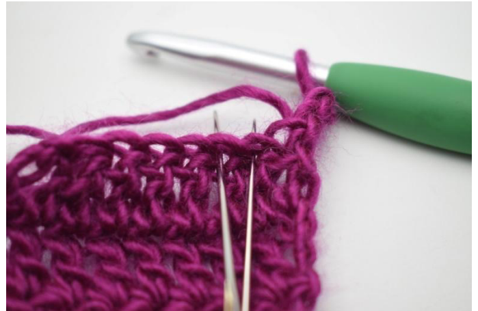
2. Nu wordt er geminderd. Haak hiervoor steek 2 en 3 samen.