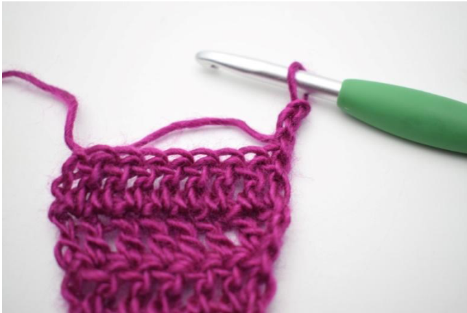
1. Keer met 3 L.