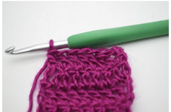
4. Haak Stk tot het einde van de toer.

86.- 165. Herhaal * Keer met 3 L. Haak de 2 volgende Stk samen. Haak Stk tot het einde van de toer* tot 165 toeren. (2) Knip het garen af en hecht af.