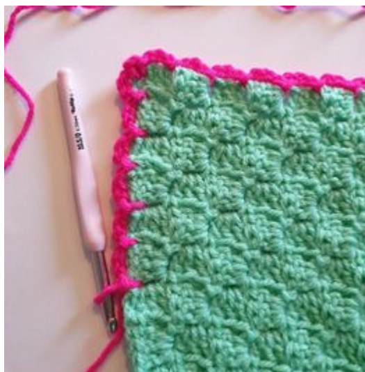
10. Haak op deze manier helemaal rond de plaid.