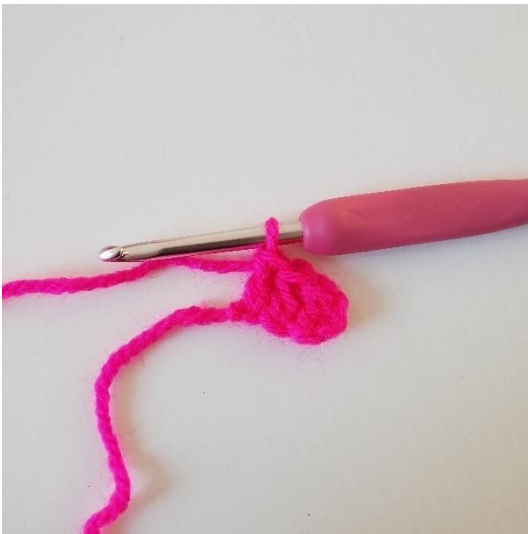
3. Haak Stk in de volgende 2 L. Nu heb je de eerste pixel gehaakt.