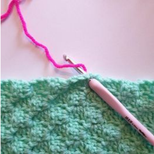
1. Hecht het garen op een willekeurige plek aan.