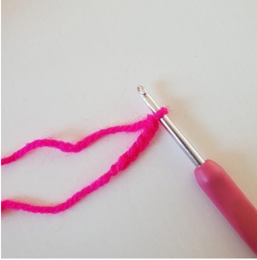
1. Start met het haken van 5 lossen.