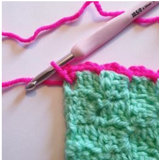
8. Haak nog een Hv in deze hoek.