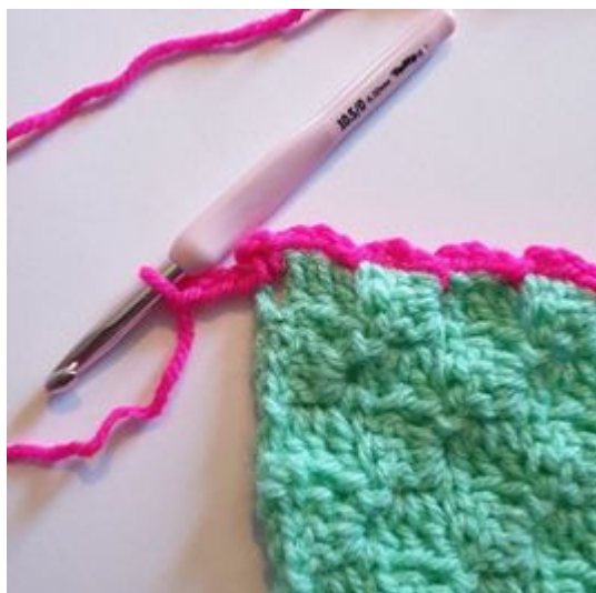
9. Haak 3 L.