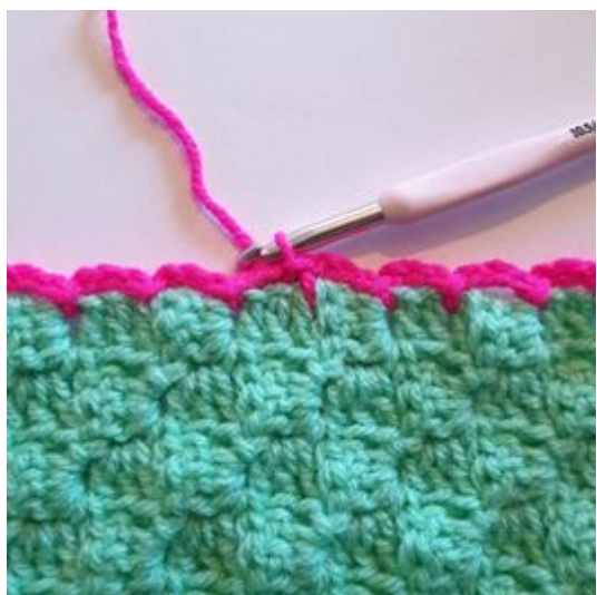
11. Sluit de toer met een Hv in de eerste steek.