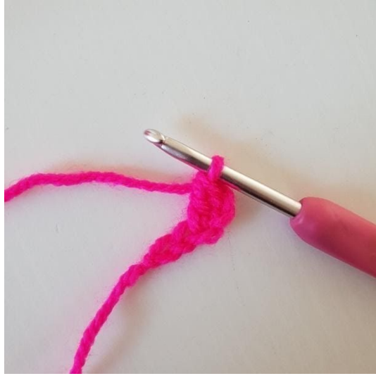
2. In de 3e losse wordt 1 Stk gehaakt.