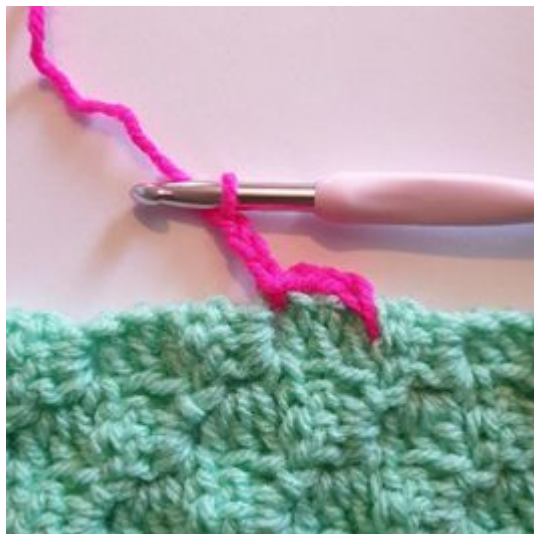
4. Haak 3 L.