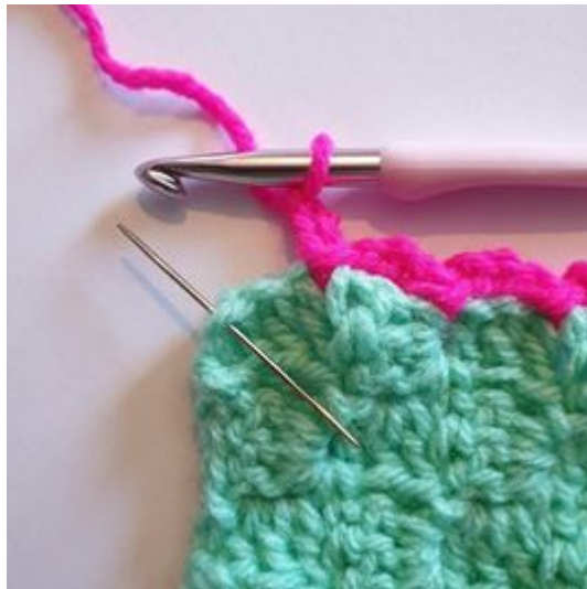
6. Als je bij de hoek bent, haak je 1 Hv in de hoek.