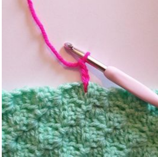
2. Haak 3 L.