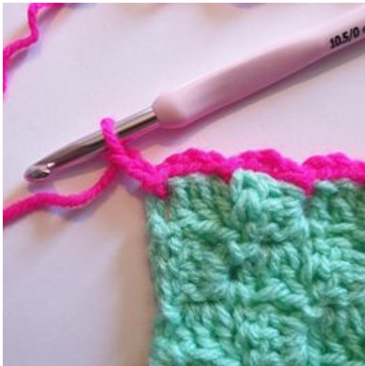
7. Haak 2 L.