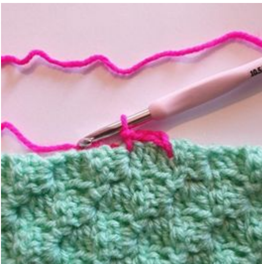
3. Haak 1 Hv tussen de volgende 2 pixels.