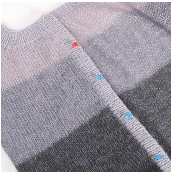
7- Markeer waar de knopen moeten zitten.