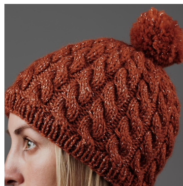
Lichtreflectie in het donker