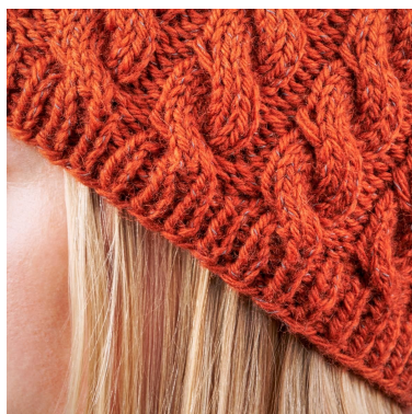
Kant me kabels