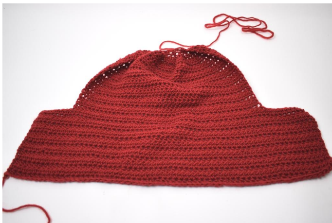
1. De slof ziet er nu zo uit.

NB Vilten kan variëren van machine tot machine. Was nog een keer op 40 grader, als de slof niet genoeg gevilt is. Deze is 2 x op 40 graden in de wasmachine geweest en daarna nat gevormd / uitgerekt aan de voet of op papier gelegd, zodat hij in de juiste vorm droogt.