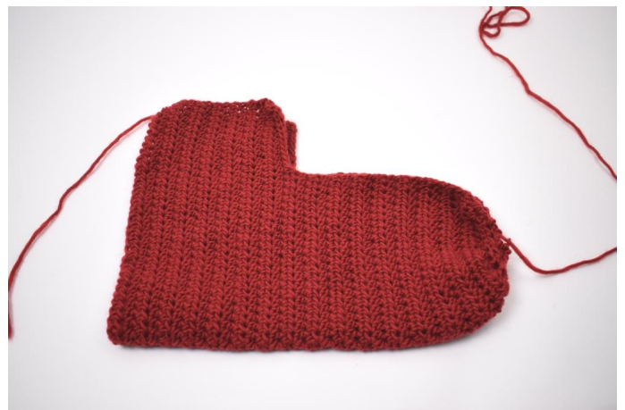
2. Vouw dubbel zoals hierboven afgebeeld.