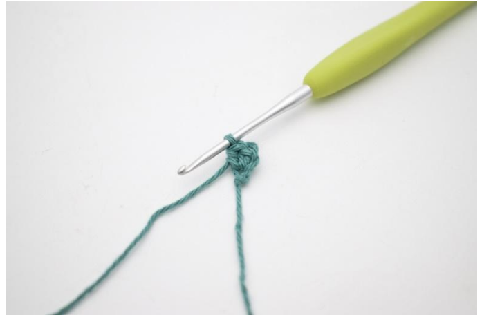
2. Haak 2 hstk in de 2e l.