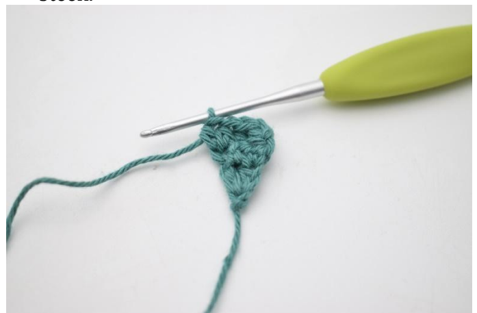
6. Haak 1 hstk in de volgende 2 s, en 2 hstk in de laatste steek.