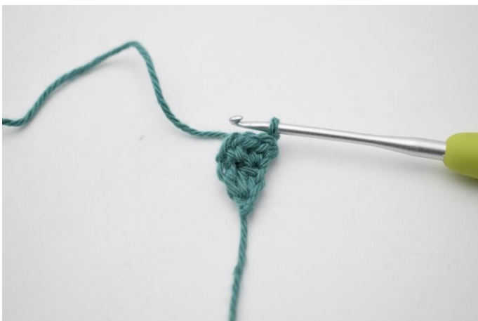
5. Keer met 1 l.