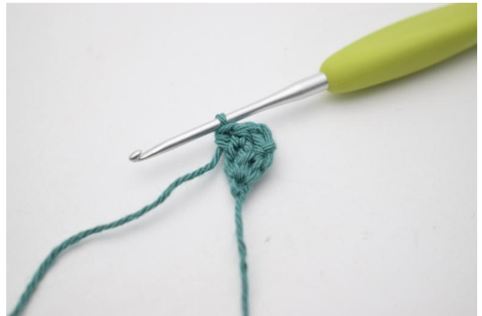
4. Haak nu alle rijen in de achterste lus. Haak 1 hstk in de eerste steek, en 2 hstk in de laatste steek.