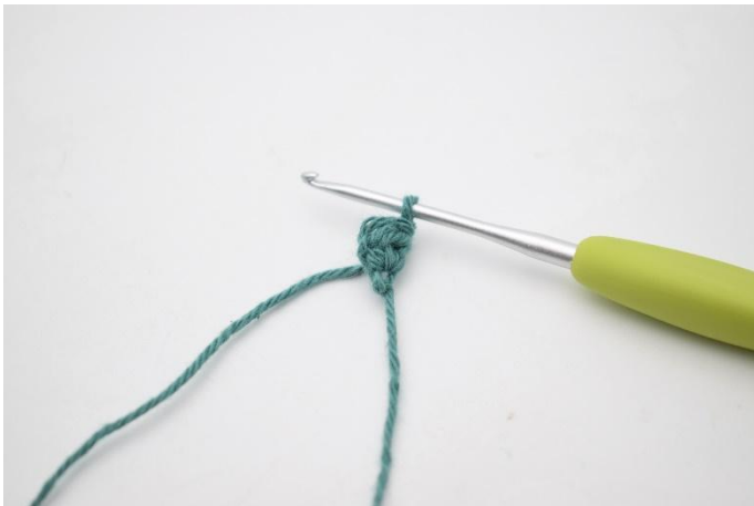
3. Keer met 1 l.