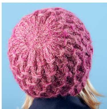
Minderingen aan de bovenkant