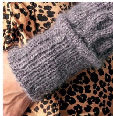
Bies en boord