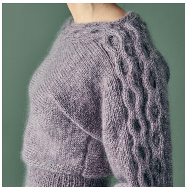
Kabel over de mouw