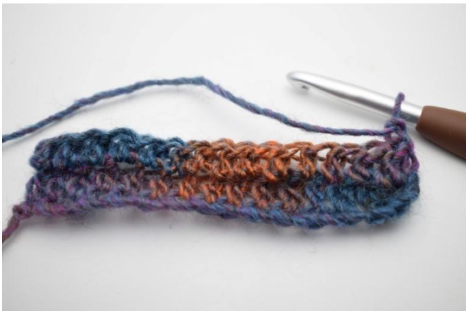
9. Keer met 1 L.