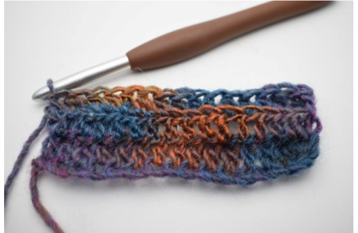
12. Haak Hstk in achterste lus de gehele toer.