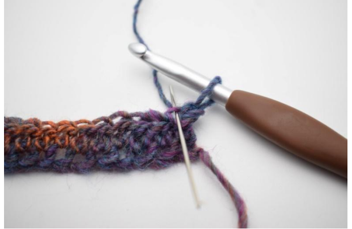
6. Haak 1 Hstk in de achterste lus. De naald markeert hier de lus waarin je haakt.