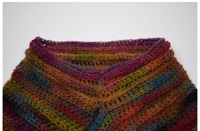
10. Herhaal zoals beschreven in het patroon tot in totaal 6 toeren met Hst.