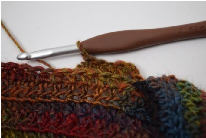
5. Haak 1 L. Haak Hst in achterste lus de gehele toer.