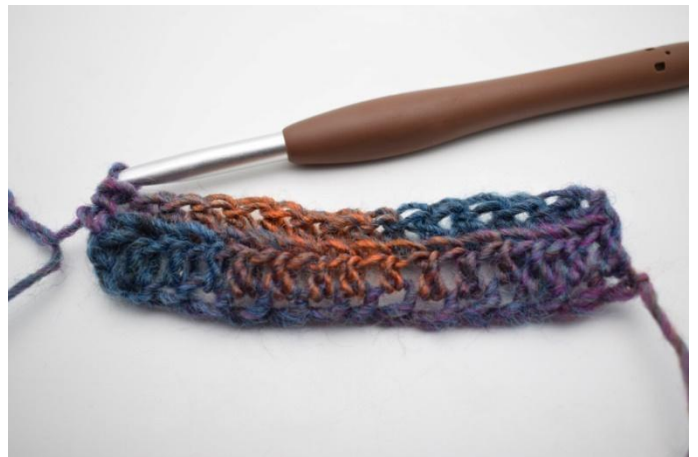
8. Haak Hstk in achterste lus de gehele toer.