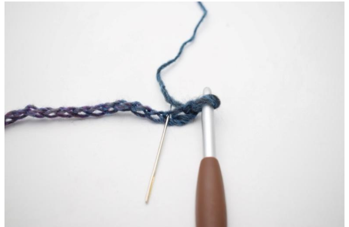
2. Haak 1 Hstk in de 3e L vanaf de haaknaald.