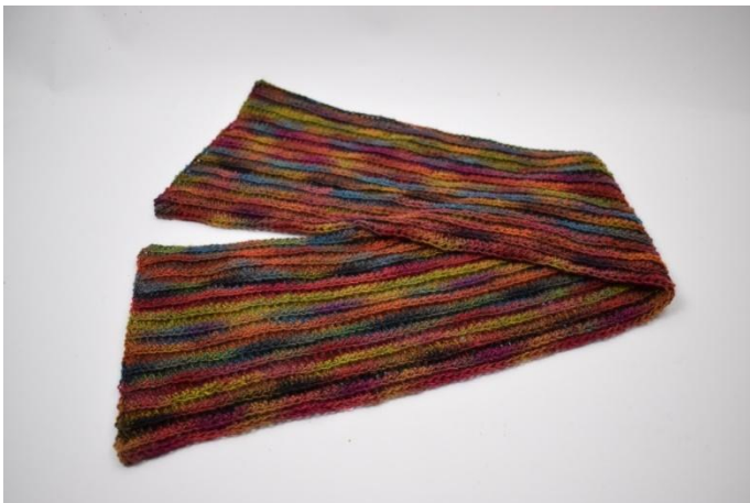
13. Herhaal toer 3 tot in taal 26 toeren. Knip het garen af en hecht af.