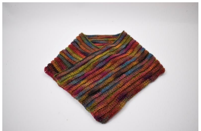
2. Vouw het andere einde over de eerste zijde zodat ze elkaar overlappen met 30 steken.