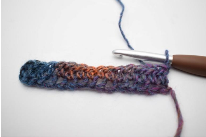
5. Keer met 1 L.