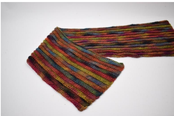
1. Vouw het ene einde in het midden zoals hier op de foto.