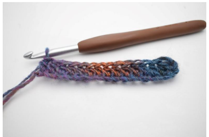
4. Haak Hstk de gehele toer.