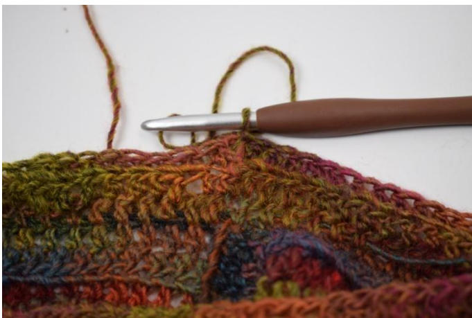
9. Sluit af met Hv in eerste Hst.