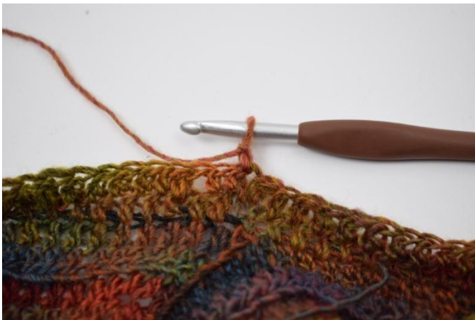
7. Keer het werk met 1 L