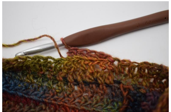
8. Haak Hst in achterste lus de gehele toer