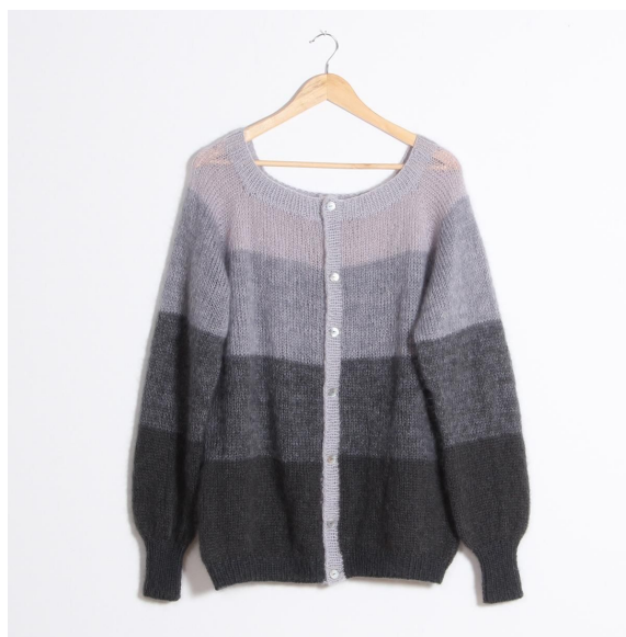
8- Helemaal kant en klaar.