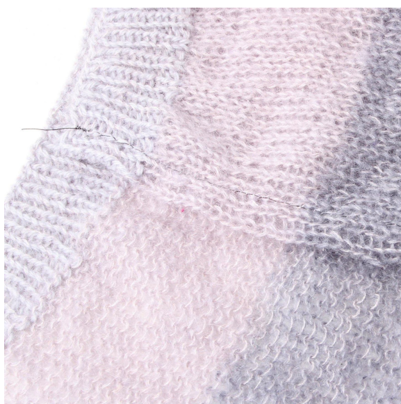
5- De randen zien er nu zo uit.