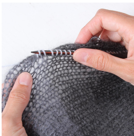
6- Brei vanaf de voorkant steken op langs de rand.