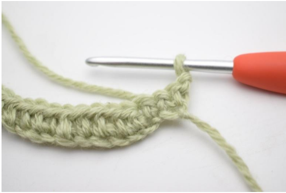
1. Keer met 1 l.