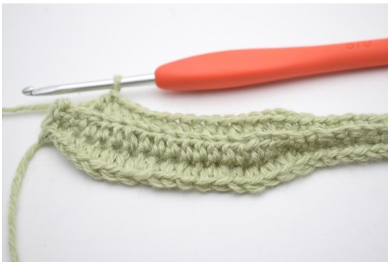
3. Haak 1 hstc in de volgende 11 (15) s.