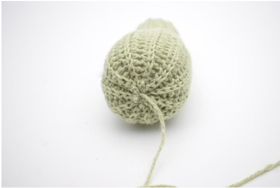
9. Zoals hier.