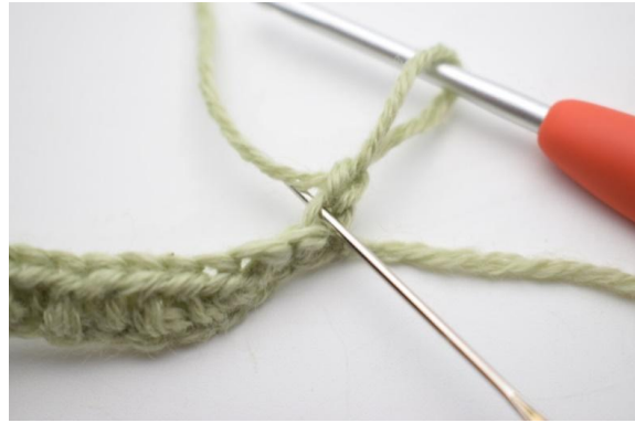
2. Haak vanaf nu ALTIJD in Al.