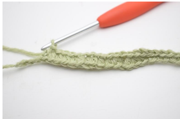
6. Haak 1 hstk in de volgende 11 (15) l.