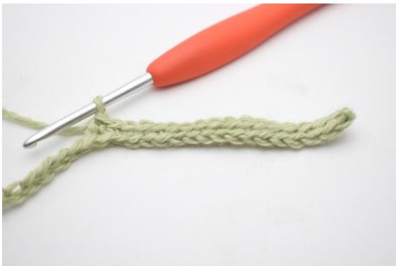
5. Haak 1 v in de volgende 11 (16) l.