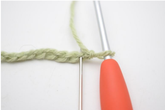
3. Haak 1 v in de 2e l vanaf de naald.