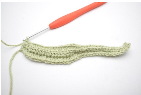
5. Zoals hier.