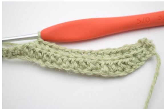
4. Haak 1 hstk in de volgende 11 (15) s.