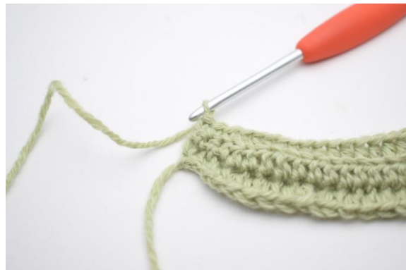
4. Haak 1 v in de laatste 2 (3) s.