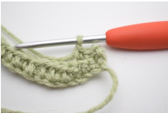
3. Haak 1 v in de eerste 2 (3) s.