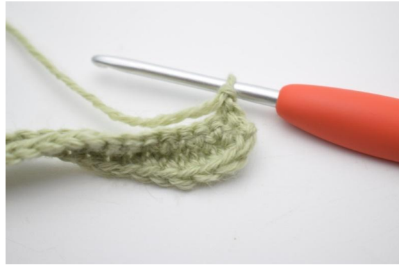
2. Haak 1 v in de eerste 12 (17) s.