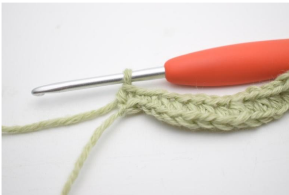
7. Haak 1 v in de volgende 2 (3) l.