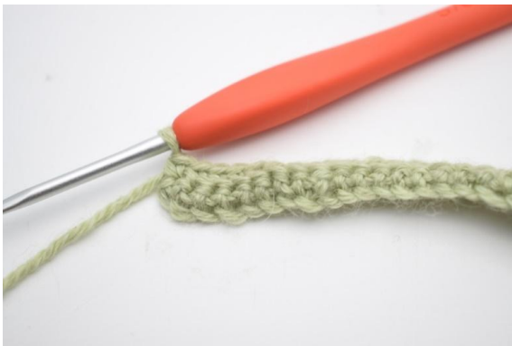
5. Haak 1 v in de laatste 12 (17) s.