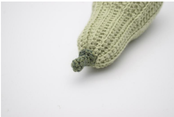
11. Naai het steeltje op de pompoen. Hecht de uiteinden.