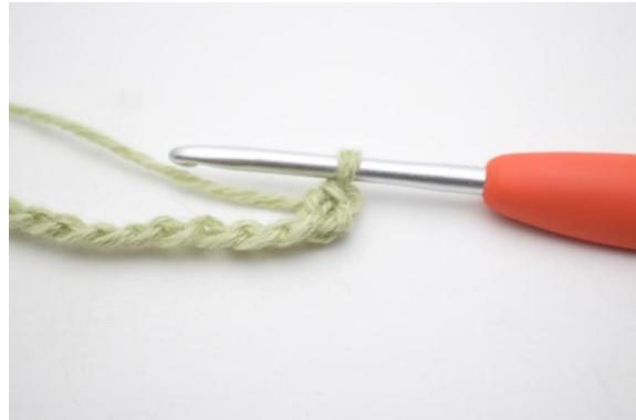
4. Zoals hier.