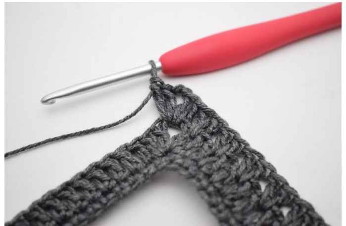
8. Haak 2 Stk, 2 L, 2 Stk in de L-boog.