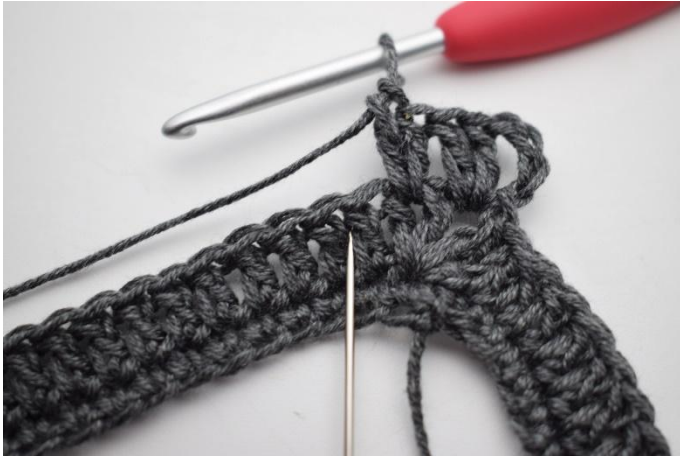
5. Sla 1 steek over en haak 2 Stk tussen de volgende 2 Stk.