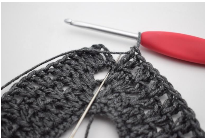
9. Haak 1 Stk in de L-boog van het begin.