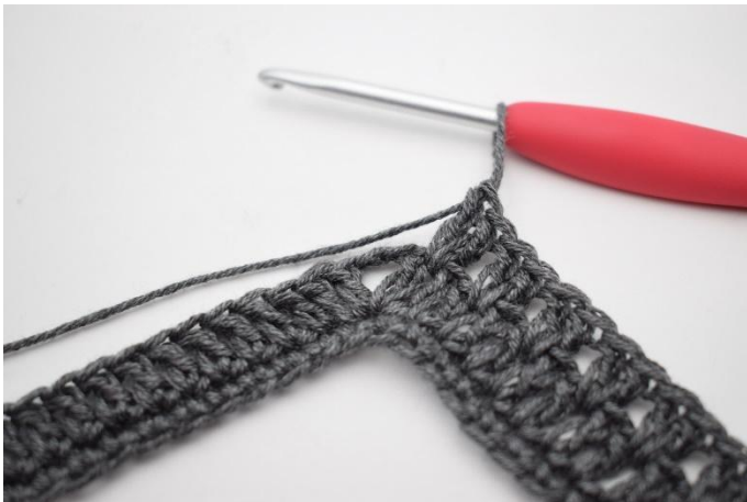
7. Haak "2 Stk tussen de volgende 2 Stk, sla 1 steek over". Herhaal "tot" in totaal 34x.