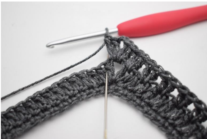
9. Haak 2 Stk tussen de eerste 2 stgm. De naald hier markeert waar je moet haken.