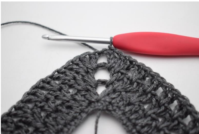
11. Sluit met 1 Hv.