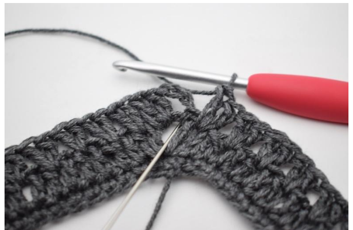
14. Haak 1 Stk in de L-boog van het begin.