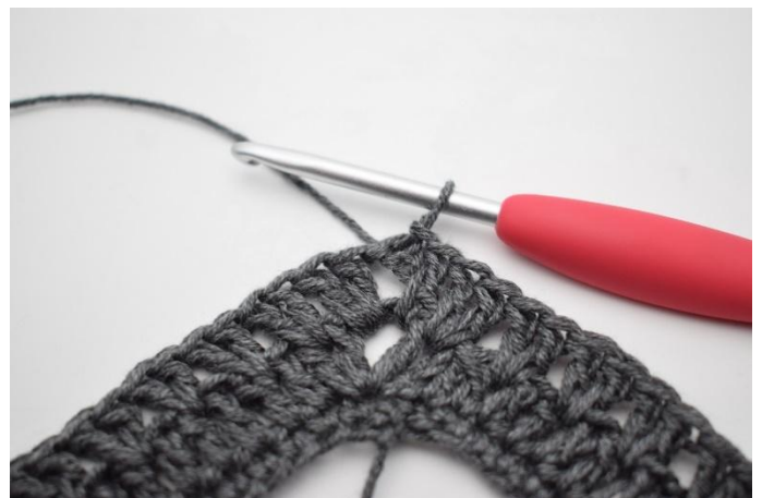
16. Sluit met 1 Hv.