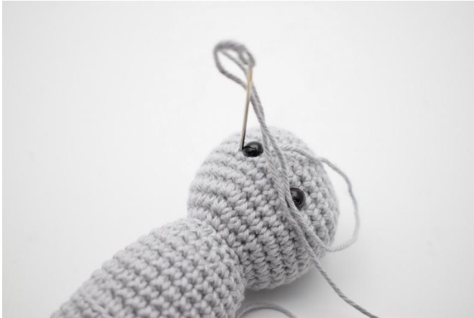
5. En weer terug aan de linkerkant van het oog.