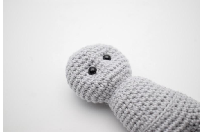
6. Trek iets aan zodat de ogen iets naar binnen worden getrokken en het konijn een lieve uitdrukking krijgt.