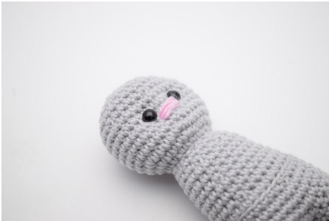
7. Naai de snuit zoals op de foto. Er wordt over 2-3 steken genaaid.