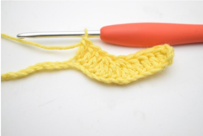
7. Haak 1 Stk in de volgende 3 L.