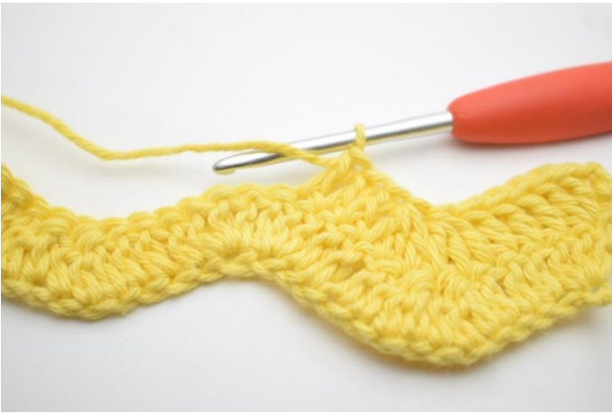
7. Haak 1 Stk in de volgende 3 steken.