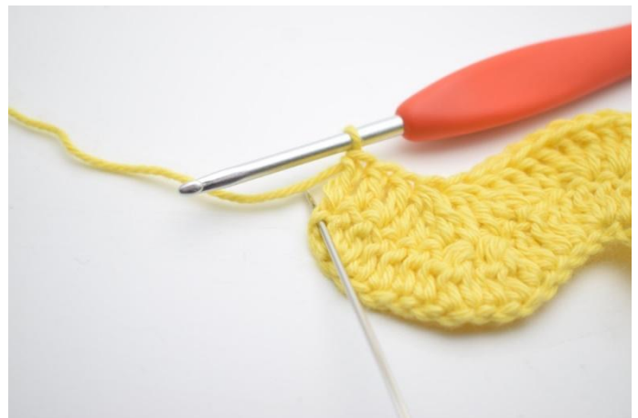
14. In de laatste steek worden 3 Stk gehaakt.