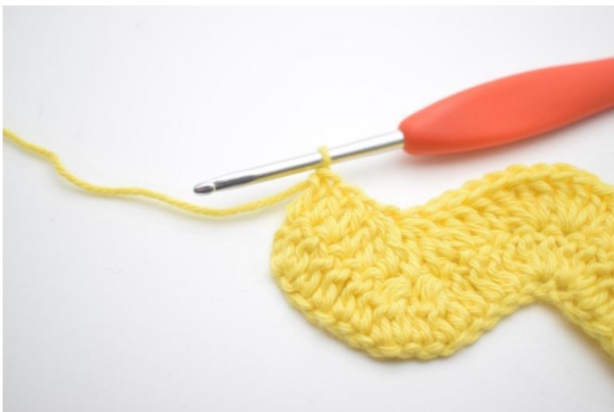
13. Haak 1 Stk in de volgende 3 steken.