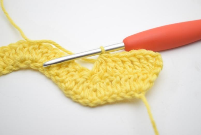
5. Haak 3 Stk samen over de volgende 3 steken.