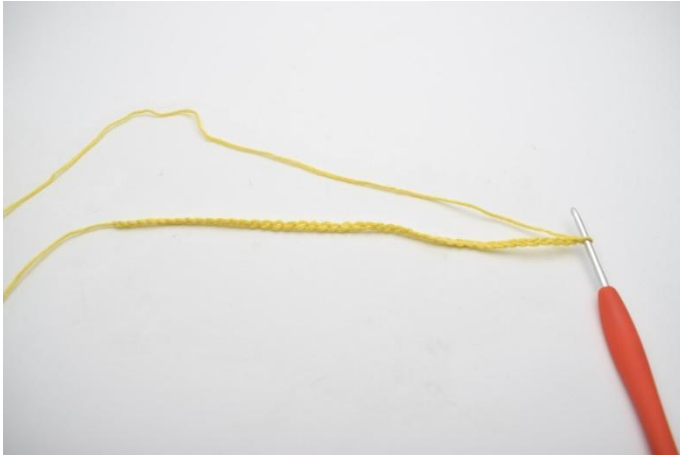
1. Zet 58 L op.