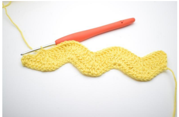
12. Herhaal op deze manier tot er 4 steken over zijn.