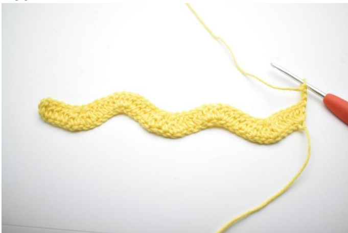
1. Keer met 3 L.