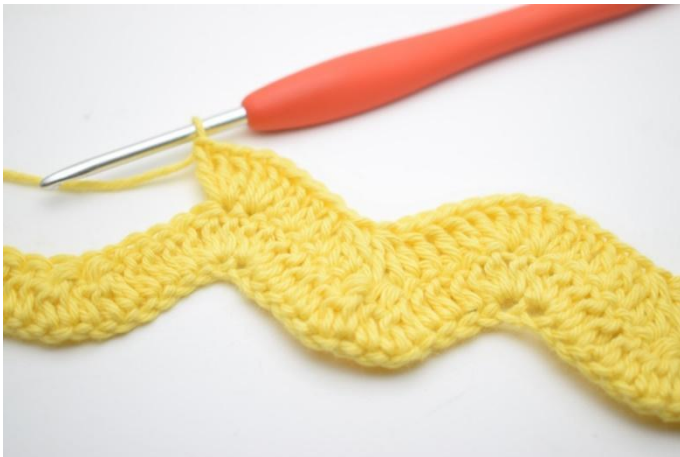
11. Haak 1 Stk in de volgende 3 steken. Haak 3 Stk in de daaropvolgende 2 steken.