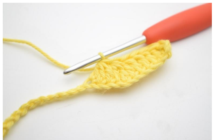
6. Herhaal en haak 3 Stk samen over de volgende 3 L.