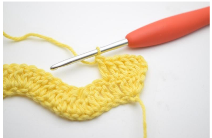
4. Haak 1 Stk in de volgende 3 steken.