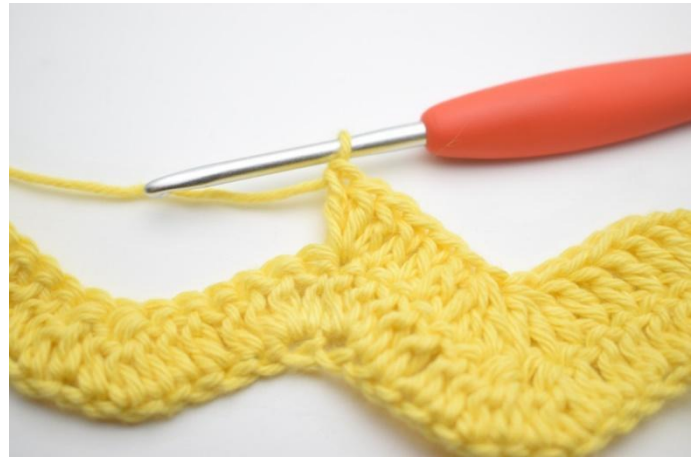
8. Haak 3 Stk in de volgende steek.