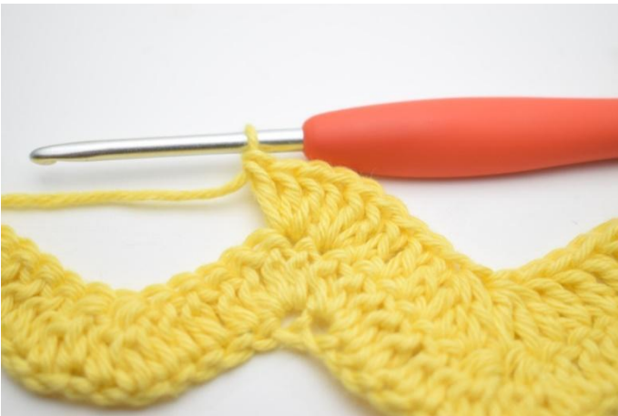
9. Herhaal en haak 3 Stk in de volgende steek.