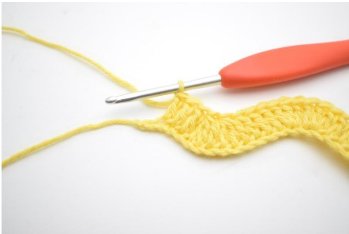
13. Haak 1 Stk in de volgende 3 L.