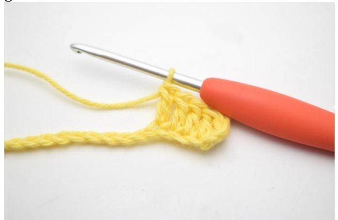
4. Haak 1 Stk in de volgende 3 L.