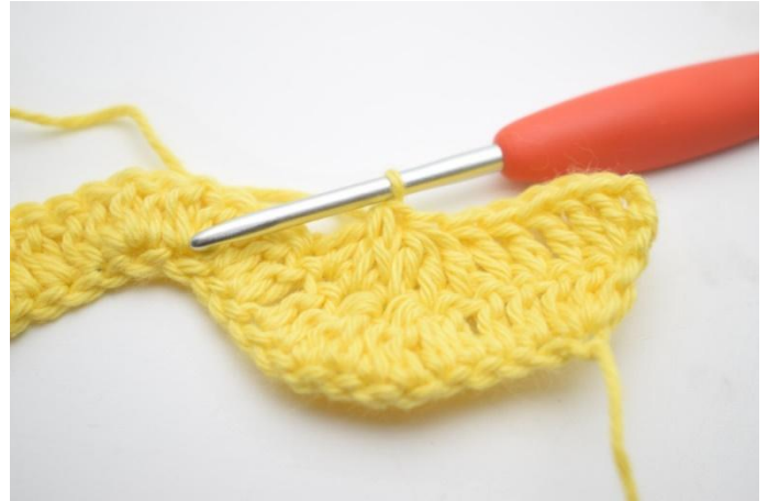
6. Herhaal en haak 3 Stk samen over de volgende 3 steken.