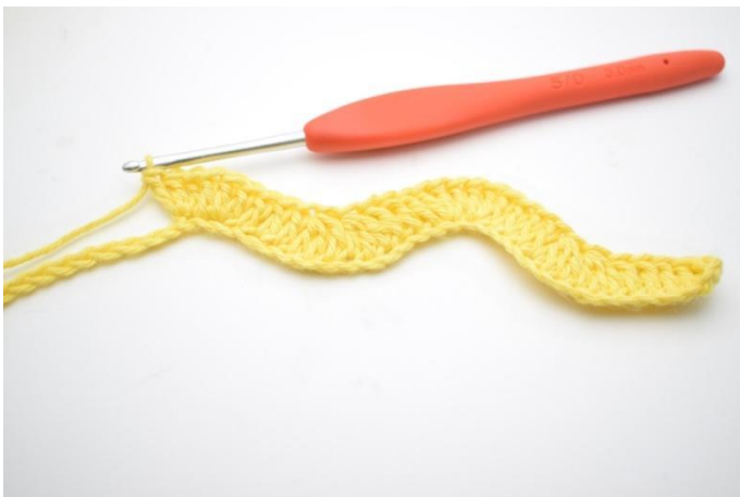
11. Haak 1 Stk in de volgende 3 L. Haak 3 Stk in de daaropvolgende 2 L.