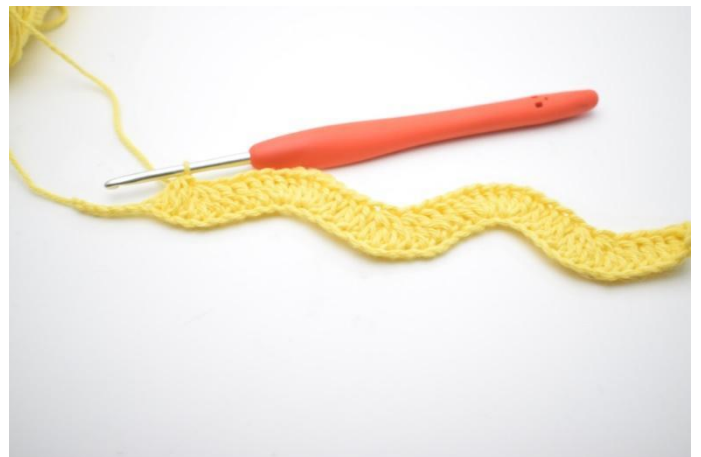
12. Herhaal zodanig tot er nog 4 L over zijn.