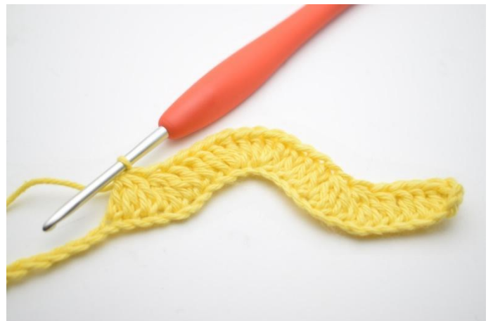
10. Haak 1 Stk in de volgende 3 L. "Haak 3 Stk samen over de volgende 3 L". Herhaal "tot" in totaal 2x.