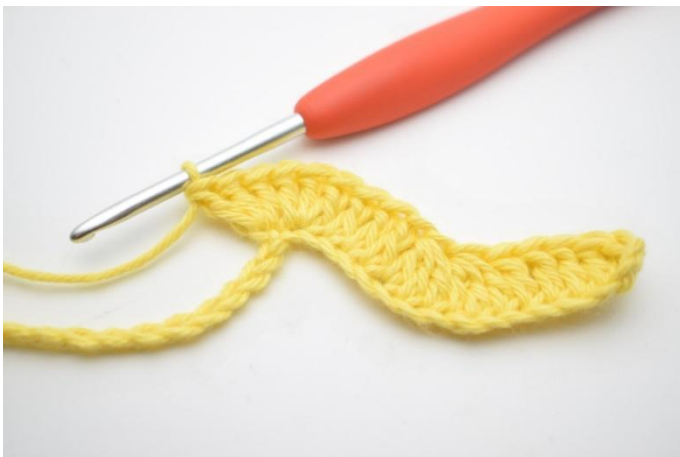
9. Herhaal en haak 3 Stk in de volgende L.