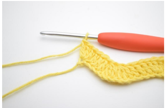
14. In de laatste L worden 3 Stk gehaakt.