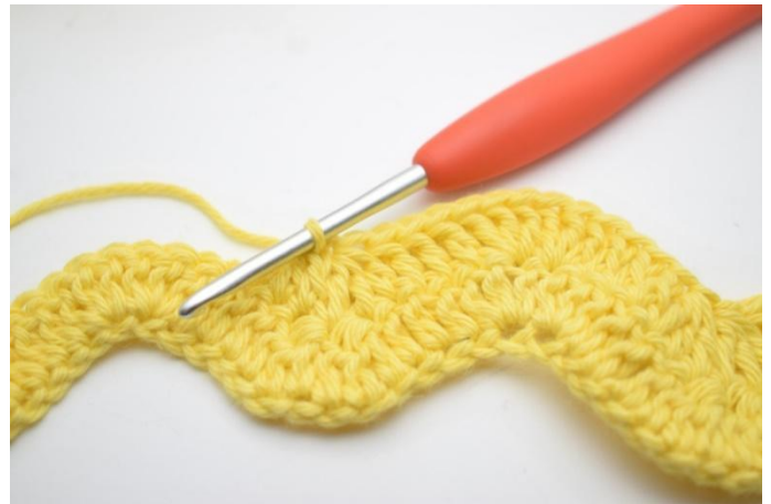
10. Haak 1 Stk in de volgende 3 steken. "Haak 3 Stk samen over de volgende 3 steken". Herhaal "tot" in totaal 2x.