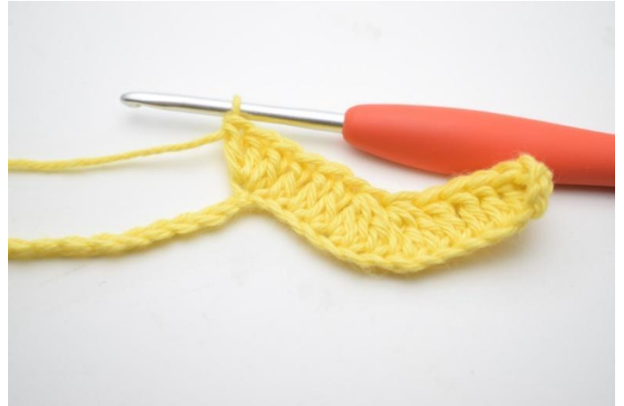
8. Haak 3 Stk in de volgende L.