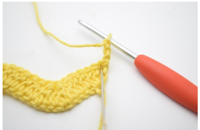
2. Haak 2 Stk in de eerste steek.