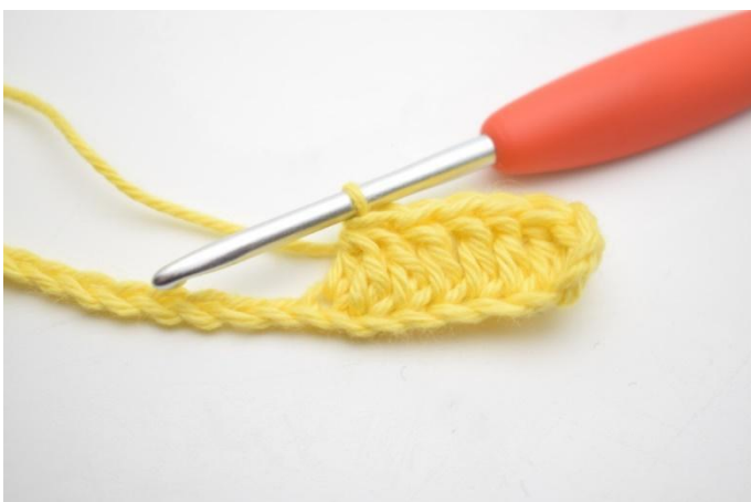
5. Haak 3 Stk samen over de volgende 3 L. (Dat betekent dat je 3 Stk samen haakt tot 1.)