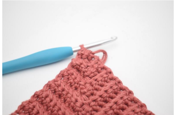
18. Herhaal deze toeren tot er 1 steek over is.