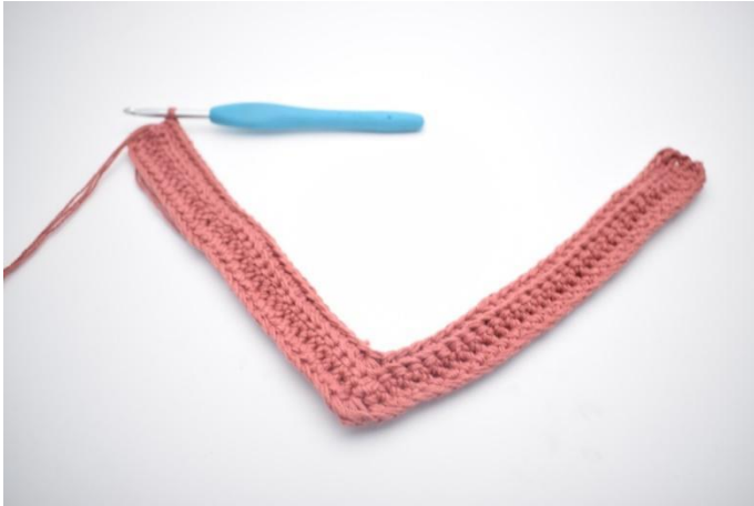
17. Haak V in de laatste 31 steken.