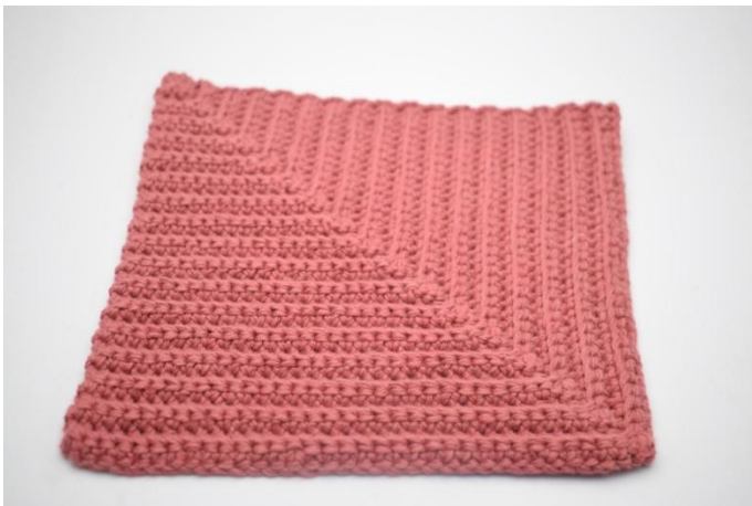
19. Knip het garen af en hecht af.