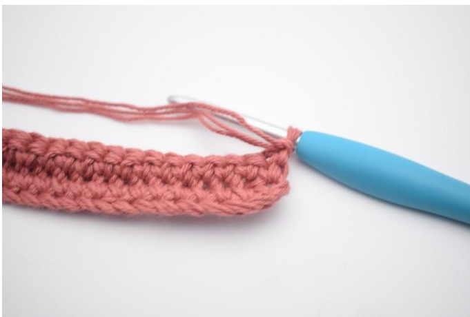
13. Keer met 1 L.