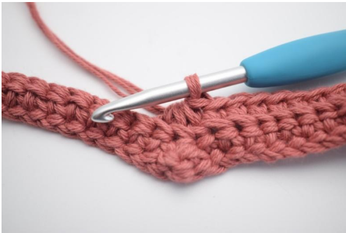
11. Haak de volgende 3 steken samen tot één.