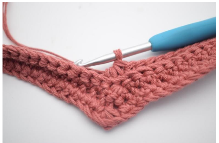
16. Haak de volgende 3 steken samen tot één.