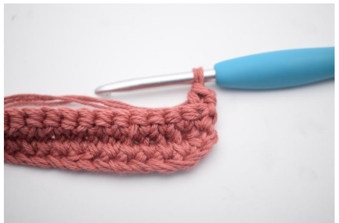
14. Haak 1 V in de achterste lus.