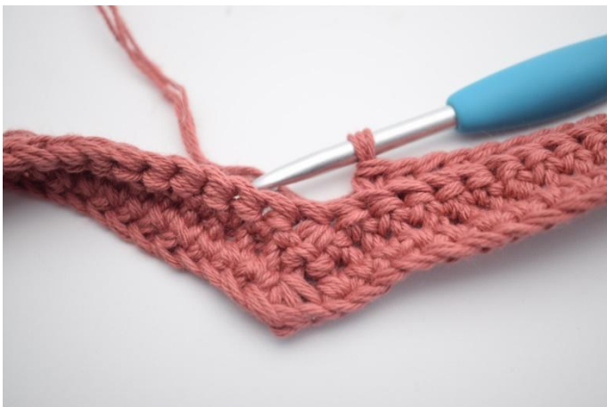
15. Haak V in de volgende 30 steken.